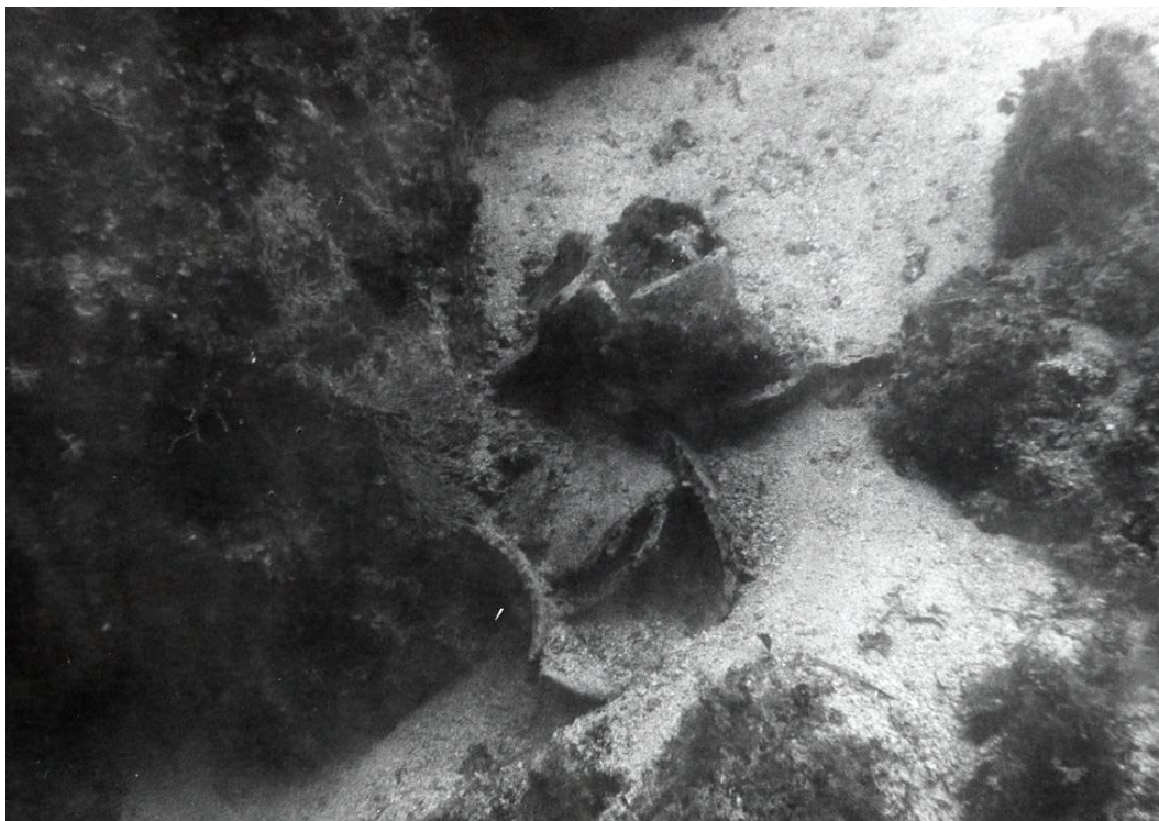
Slika 8 Fragmenti amfora Lamboglia 2 tipa između Malog i Velikog Pržnjaka (I. RADIĆ-ROSSI, 2005, 49-63.)

Stručnim pregledom 1990. godine, između Malog i Velikog Pržnjaka, utvrđeni su ostatci opljačkanog antičkog brodoloma s teretom amfora Lamboglia 2 tipa iz 1. stoljeća prije Krista (Slika 8). Koncentracija ulomaka amfora nalazi se na dubini od 12 do 40 m. 39