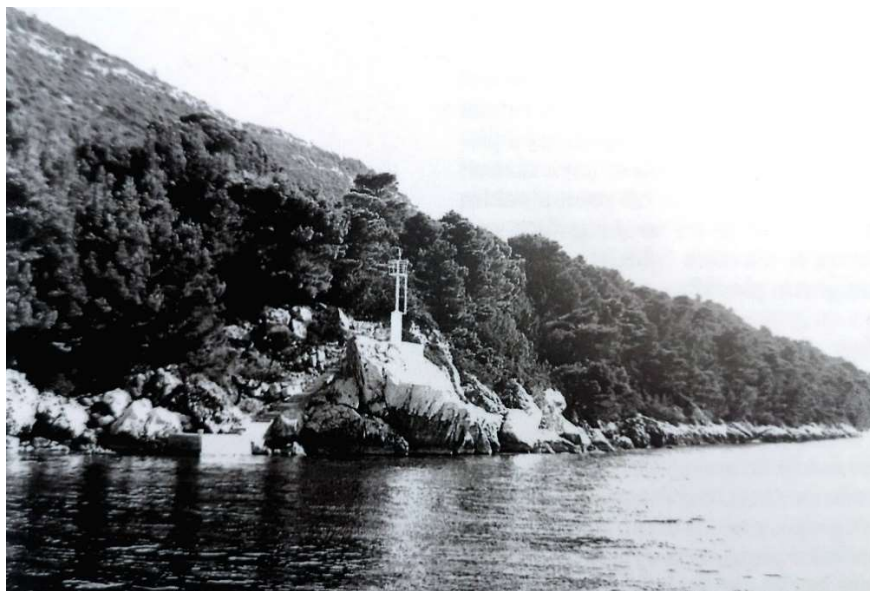
Slika 2 Rt sv. Ivana kod Vignja (M. RADALJAC, 2017, 6)

Zapadno od Vignja na poluotoku Pelješcu nalazi se Rt sv. Ivana (Slika 2). On je udaljen oko jednu milju od mjesta Viganj. Nedaleko Punte sv. Ivana, na dubini od oko 30 m, nalazi se antički brodolom. Istraživanja su provedena u dvije kampanje (1971. i 1972. godine). Voditelj