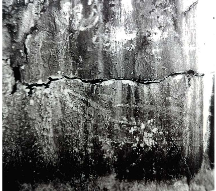
Slika 5 Crtež broda na Puntii sv. Ivana (M. RADALJAC, 2017, 14.)

Na strmoj hridi Punte sv. Ivana, gdje se sada nalazi svjetionik, možda se nalazi crtež broda (Slika 5). Zbog toga crteža, mještani nazivaju ovo mjesto „Galija“ ili „Pod galiju“. Analogiju sa tim prikazom Ž. Rapanić vidi u jantarnoj pločici iz Nina gdje se u oba slučaja vide 2 veslača i mali brod. 26