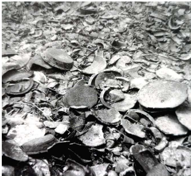
Slika 3 prikaz ulomaka keramičkog posuđa nakon spužvara (M. RADALJAC, 2017, 7)

istraživanja bio je Željko Rapanić. Lokalitet se prvi put spominje 1935. godine, kada spužvari vade olovnu prečku olovno-drvenog sidra. Nakon toga, 1958. godine izvađena je i druga olovna prečka koja se danas čuva u Gradskom muzeju u Korčuli. Već tada uslijedilo je pljačkanje lokaliteta pa su tako 1964. godine spužvari iz Krapnja izvadili više od 70 komada raznog posuđa. Na posljetku svi su ti predmeti prodani Opatskom muzeju u Korčuli. Nakon toga, Mladen Nikolanci koji je tada radio za Arheološki muzej u Splitu, zajedno s timom ronilaca obavlja pregled antičkog brodoloma. Površina puna razbijenog posuđa, koju su pronašli na lokalitetu, iznosila je 10 x 5-6 m. Vjerojatno su spužvari sa svojom teškom opremom razbili posuđe (Slika 3). Na žalost, destrukcija lokaliteta se i dalje nastavila. Godine 1969. Skupština Općine Korčula bez dopuštenja organizira vojnu vježbu u svrhu vađenja posuđa sa lokaliteta sv. Ivan nedaleko Vignja. Pri tom vađenju predmeta izvađen je i dio drvene brodske konstrukcije te su upotrebljavane i sisaljke. Ponovnim pregledom lokaliteta 1970. godine površina s fragmentiranom keramikom proširila se na 18 x 12 m. 13