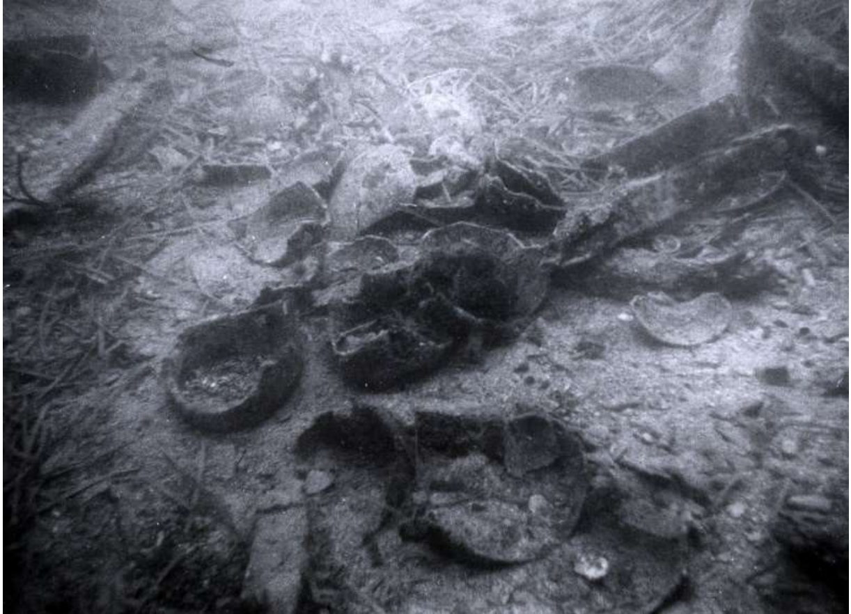
Slika 15 Novovjekovni brodolom nedaleko otoka Sridnjaka (M. JURIŠIĆ, 2001, 194)

Jadranu nazivaju „piljuška“. Datiranje keramike je problematično zbog sličnih oblika koji se susreću kroz široki vremenski raspon novoga vijeka. Vjerojatno je da je velik broj keramičkih posuda iz Opatske riznice u Korčuli izvađen upravo sa ovoga lokaliteta. 92