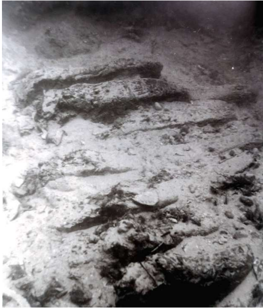
Slika 6 Rebra broda (M. RADALJAC, 2017, 12.)