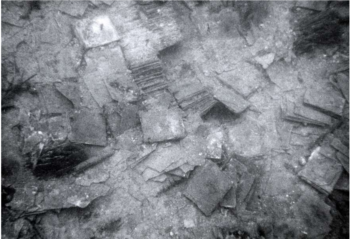
Slika 12 Teret novovjekovnog brodoloma kod otočića Otočca (I. RADIĆ-ROSSI, 2005, 49-63)