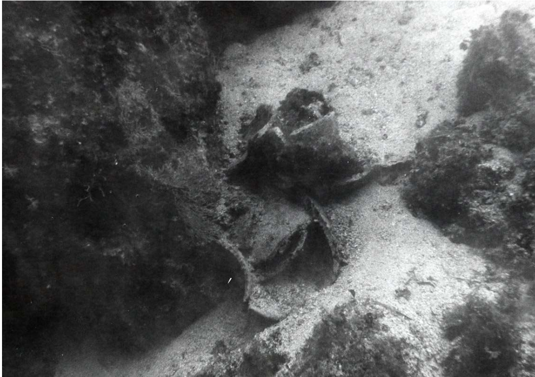
Slika 8 Fragmenti amfora Lamboglia 2 tipa između Malog i Velikog Pržnjaka (I. RADIĆ-ROSSI, 2005, 49-63.)

Stručnim pregledom 1990. godine, između Malog i Velikog Pržnjaka, utvrđeni su ostatci opljačkanog antičkog brodoloma s teretom amfora Lamboglia 2 tipa iz 1. stoljeća prije Krista (Slika 8). Koncentracija ulomaka amfora nalazi se na dubini od 12 do 40 m. 39