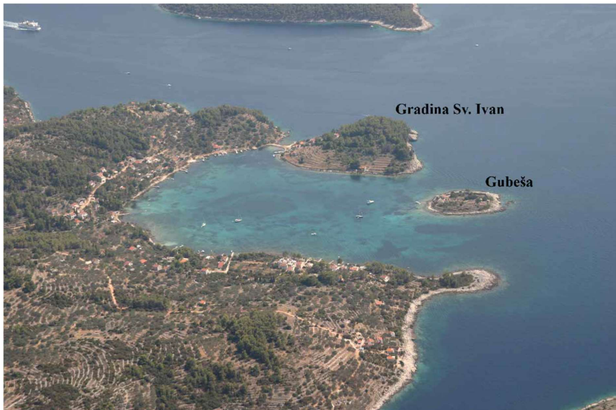
Slika 9 Položaj i okolina uvale Gradina (I. BORZIĆ, 2009, 85.)

Uvala Gradina nalazi se na zapadnoj strani otoka Korčule u zaljevu Vele Luke. Zaljev Vele Luke je vrlo razveden, a uvala Gradina se nalazi na sredini sjeverne strane zaljeva gdje se širina zaljeva smanjuje. Dubina uvale iznosi od 1 do 6 m, a dno je pjeskovito. Uvalu sa južne strane zatvara Gradina sv. Ivana, a sa zapadne strane otočić Gubeša te se tako smanjuje djelovanje svih vjetrova u uvali (Slika 9). Zbog odličnih maritimnih uvjeta, pogodnost uvale kao sidrišta je neupitna. Nedaleko uvale u blago brežuljkastoj unutrašnjosti otoka nalazi se polje Bradat. Ovakve geografske karakteristike uvale i okoline rezultiraju ne samo korištenjem uvale od najranijeg vremena naseljavanja ovog dijela otoka, nego i razvojem duž jadranske i prekojadranske plovidbe. U prilog tome ide arheološki materijal pronađen u podmorju uvale te na lokalitetima Gubeša, Gradina sv. Ivana i Bradat – Mirje, koji se trebaju promatrati u zajedničkom kontekstu. Važno je napomenuti kako se izvor žive vode nalazio na sjevernoj obali uvale, nedaleko od današnjeg mola. Može se zaključiti da je u ranija antička vremena izvor imao veći i duži tok zbog obalne linije koja je bila pomaknuta bliže sredini uvale. Izvor je sredinom 20. stoljeća zatrpan nestručnim miniranjem. 41