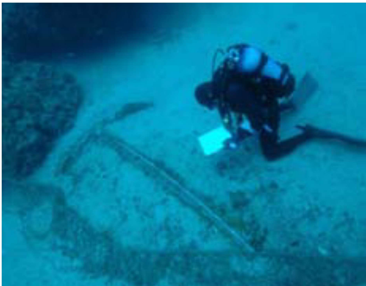
Slika 17 Dokumentiranje novovjekovnog sidra u podmorju otoka Majsana (I. MIHOLJEK, 2008, 673.)

krakovi zabijeni u stijenu. Dužina prečke iznosi 2,70 m, a krakovi su vidljivi u dužini od samo 70 cm, što upućuje na lom krakova. Sidro br. 6 najveće je sidro, dužine 3,05 m, s dužinom krakova od 1,70 m. Debljina mu je 15 cm u promjeru. Sidro ima i alku promjera 45 cm. Prilikom dokumentiranja sidara nije pronađen nikakav drugi arheološki materijal pa datacija pojedinih sidara nije moguća. Pet sidara je jasno datirano u novi vijek, dok je jedno željezno sidro moguće svrstati u antičko razdoblje, zbog specifičnog T-oblika jednostavne forme. 95