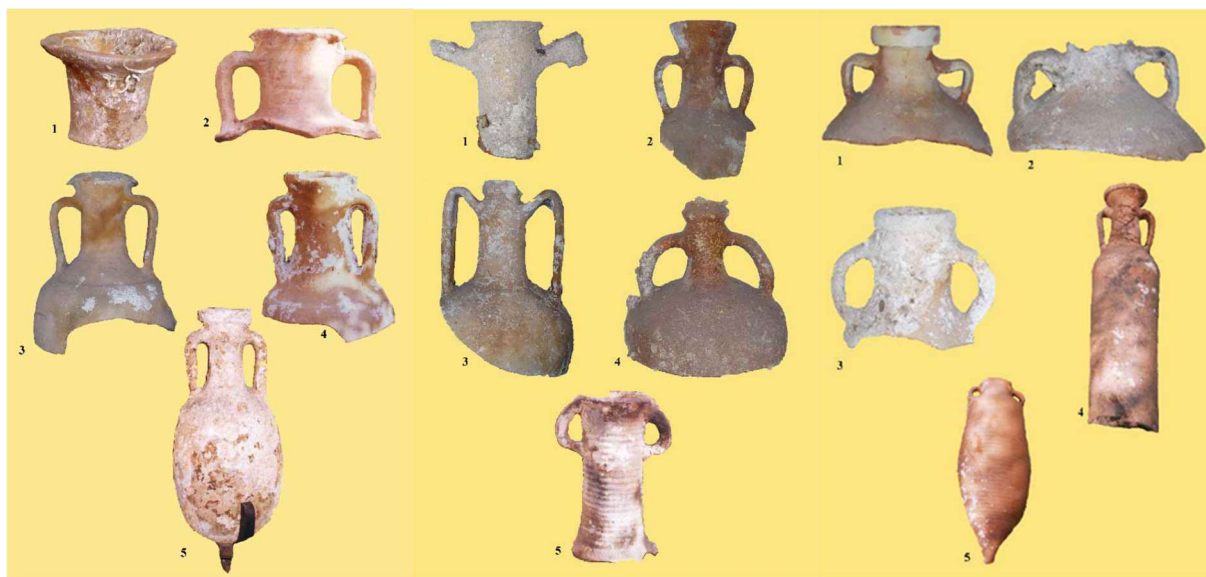
Slika 10 Amfore iz uvale gradina (I. BORZIĆ, 2009, 86-88.)

Nalazi iz uvale Gradine nedvojbeno nam pokazuju kako se uvala kontinuirano koristila kao sidrište. Uvala je bila izlazna luka lokaliteta na tom dijelu otoka Korčule, s iznimnim maritimnim vrijednostima. Već je istaknuto kako je uvala bila dio „otočnog mosta“ koji spaja istočnu i zapadnu obalu Jadrana u prapovijesti. U antici je uvala Gradina imala ulogu u centralnoj prekojadranskoj ruti s tendencijom kretanja prema Naroni. Naime, ušće Neretve udaljeno je 40 Nm, što se moglo preploviti u jedan dan. Uvale Tankaraca, Žukova, Prihonja i Badnjena na sjevernoj strani otoka Korčule mogle su poslužiti kao zaklon od nevremena o čemu nam svjedoče arheološki nalazi te tako dokazuju pravac plovnoga puta. Također, uvala Gradina se mogla naći na plovnoj ruti u slučaju plovidbe akvatorijem zapadne obale otoka Korčule. 73 To nam dokazuju antički lokaliteti kod otočića Vrhovnjaka, Malog i Velikog Pržnjaka, hridi Čerina kod Prižbe i uvale Grščice na jugozapadnoj obali otoka 74 te rta Vranine, uvale Maslinove i Kremenjače u zaljevu Vele Luke. 75