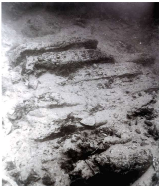
Slika 6 Rebra broda (M. RADALJAC, 2017, 12.)