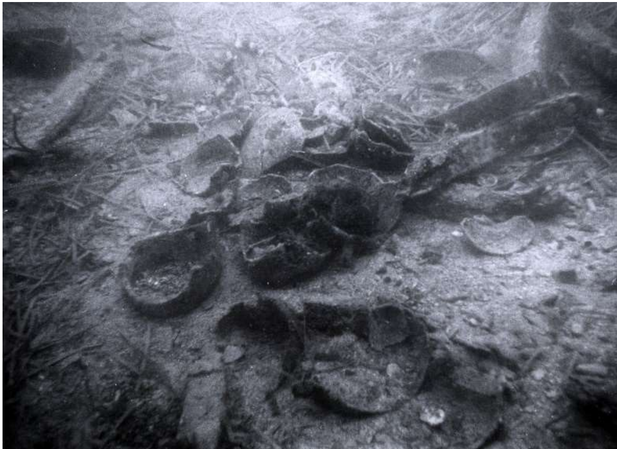
Slika 15 Novovjekovni brodolom nedaleko otoka Sridnjaka (M. JURIŠIĆ, 2001, 194)

Jadranu nazivaju „piljuška“. Datiranje keramike je problematično zbog sličnih oblika koji se susreću kroz široki vremenski raspon novoga vijeka. Vjerojatno je da je velik broj keramičkih posuda iz Opatske riznice u Korčuli izvađen upravo sa ovoga lokaliteta. 92