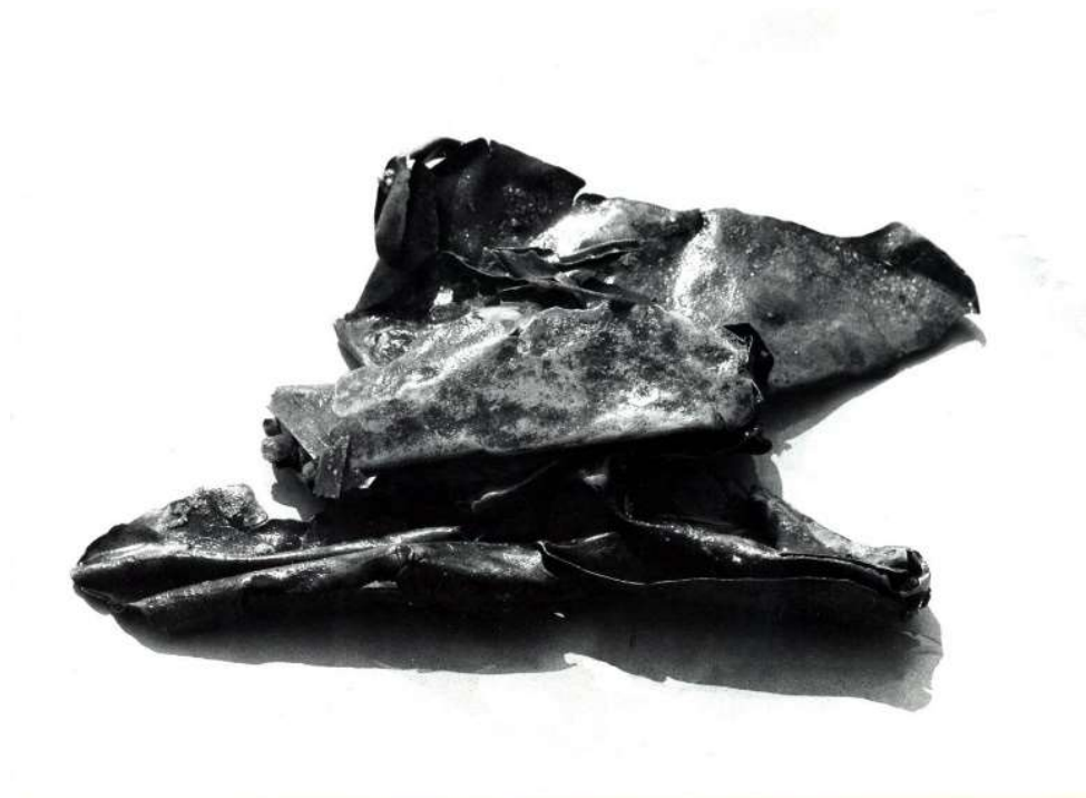
Slika 14 Ulomci zgužvane bakrene brodske oplata s otočića Lukovca (I. RADIĆ-ROSSI, 2005, 49-63)

Na jugoistočnoj strani otočića Lukovca pronađeni su ulomci zgužvane bakrene brodske oplata (Slika 14), a na nešto većoj dubini, nedaleko brodske oplata, nalazio se komad željeza nepoznate namjene, dug 2 m. Bakrena brodska oplata probno se koristila tijekom druge polovice 18. stoljeća te tako možemo okvirno datirati brodolom. 88 Prema prikupljenim podacima, tu se trebao nalaziti i željezni top. Na jednom od privatnih imanja uočen je top u poluraspadnutom stanju. Utvrđeno je kako je top izvađen upravo sa lokaliteta Lukovac te je tamo i vraćen. 89