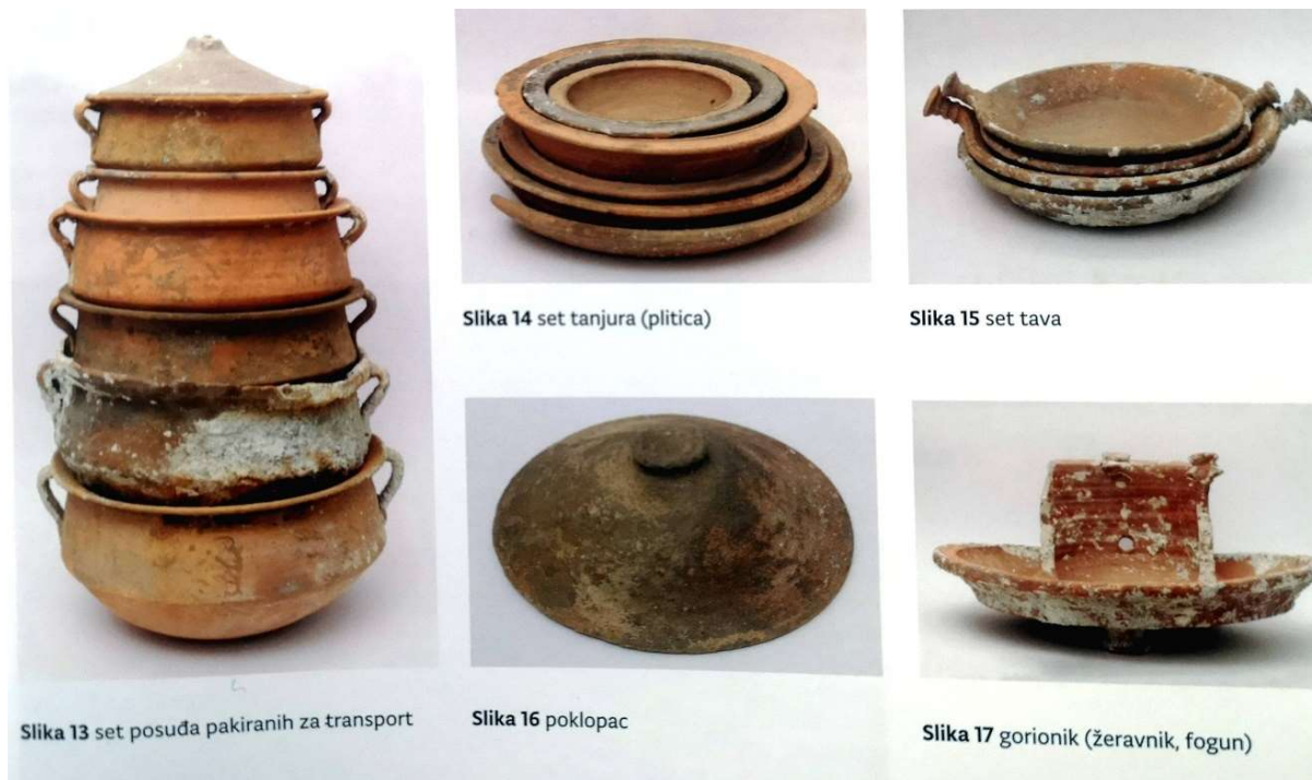
Slika 4 Keramičko posuđe sa lokaliteta sv. Ivan kod Vignja (M. RADALJAC, 2017, 11.)

Tijekom istraživanja brodoloma kod Vignja prvi put je stavljen naglasak na dokumentiranje i vađenje drvene konstrukcije potonulog broda te su tako utvrđeni osnovni elementi brodske konstrukcije. 24