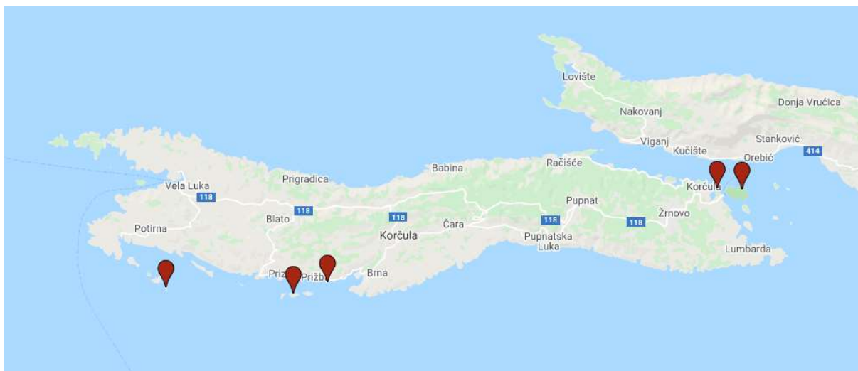
Slika 11 Položaj novovjekovnih lokaliteta (napravljeno uz pomoć alata Google Maps, 2020)