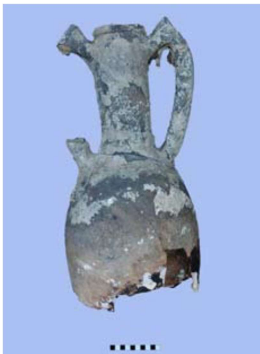
Slika 18 Egejska „horn-handled“ amfora, pličina Lučnjak (I. MIHOLJEK, 2008, 674.)