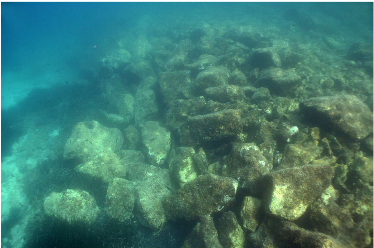
Slika 7 Potopljena lučka instalacija na otoku Sutvari (M. PARICA, I. BORZIĆ, 2018, 991.)

Na sjevernoj strani otoka Sutvare nalazi se lučka instalacija u obliku operativne obale. Konstrukcija je duga oko 40 m, a sastoji se od kamenog nasipa. Kamen koji je korišten za izgradnju uglavnom je neobrađen, dok pravilnost pokazuju neki blokovi u samom licu obale (Slika 7). 29 Morska razina nalazi se oko 2 m od vrha rubnog dijela lučke instalacije, a količina kamena koji je urušen tolika je da bi se izvorna obala mogla u rekonstrukciji podići ne više od jednog reda. Pogledamo li današnju morsku razinu i potopljenju konstrukciju, možemo datirati nastanak lučke instalacije u antiku ili kasnu antiku. 30