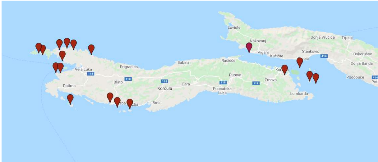
Slika 1 Položaj antičkih lokaliteta (napravljeno uz pomoć alata Google Maps, 2020)

U nastavku će biti prezentirani svi antički lokaliteti koji su istraživani ili samo zabilježeni na prostoru Pelješkog kanala i otoka Korčule.