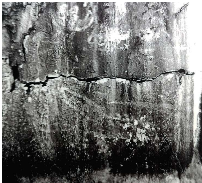
Slika 5 Crtež broda na Puntici sv. Ivana (M. RADALJAC, 2017, 14.)

Na strmoj hridi Punte sv. Ivana, gdje se sada nalazi svjetionik, možda se nalazi crtež broda (Slika 5). Zbog toga crteža, mještani nazivaju ovo mjesto „Galija“ ili „Pod galiju“. Analogiju sa tim prikazom Ž. Rapanić vidi u jantarnoj pločici iz Nina gdje se u oba slučaja vide 2 veslača i mali brod. 26