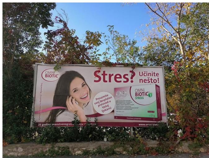
Slikovni prilog 2.

Slikovni prilog 2. Fotografija fotografirana u Zadru ispred trgovačkog centra City Galleria dana 8. studenog 2020.