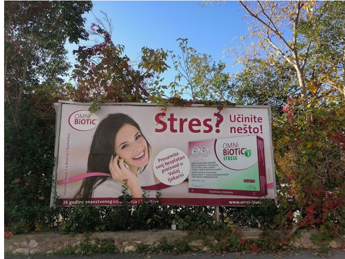
Slikovni prilog 2.

Slikovni prilog 2. Fotografija fotografirana u Zadru ispred trgovačkog centra City Galleria dana 8. studenog 2020.