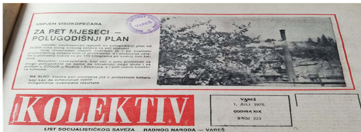
Slika 2. Fotografija visoke peći u „proljetnom beharu kao da simbolizuje njene ovogodišnje izvanredne rezultate“ (Kolektiv, 1975., Knjižnica u Varešu)

Da se socijalistički projekt i vrijednosti počeo urušavati već 50ih, uvođenjem tržišnih načela u proizvodnji te povećanim brojem privatnika, što označava blagi početak tranzicije, koja se u poveznicu s BiH više raspravlja u današnjem kontekstu, tvrdi Ines Prica (2014), te se kroz Kolektive može vidjeti polagani pad i propadanje socijalističkog projekta. Bivši radnici kao „junaci rada“ služe kao simboli projekta „zadovoljnih i ispunjenih pojedinaca“ koji je „pošao po zlu“ te su danas većinom neostvareni – ni u profesionalnom ni osobnom smislu (Matošević 2015:186), što će detaljnije biti prikazano u sljedećem poglavlju.