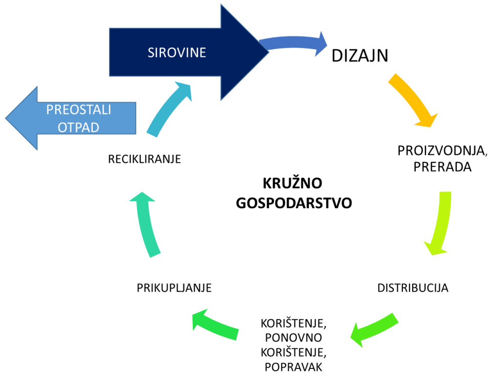
Slika 2: Kružno gospodarstvo