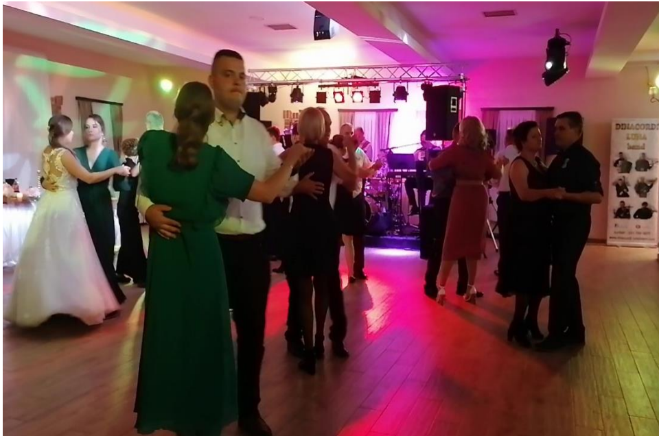
Sl. 5. Svadba u Cepidlaku (19.9.2020.,)

Tijekom privatnih proslava ljudi angažiraju glazbeni sastav prema dvama kriterijima: cijena i kvaliteta. Što popularniji i kvalitetniji sastav, to je veća cijena za njihov angažman. Glazbeni sastavi sastoje se od tri do pet članova, a uobičajeni instrumenti kojima se sastavi na ovom području koriste su harmonika, klavijature, bubnjevi i električna gitara, ponegdje i violina. Sastavi najčešće imaju jednog glavnog vokala i nekoliko pratećih. Članovi tih sastava uglavnom su glazbeni amateri koji su naučili svirati po sluhu , ali postoje i oni koji su pohađali glazbenu školu. Sviranje u takvim bendovima nije im glavni izvor zarade, te tijekom tjedna rade kao zaposlenici u tvrtkama, dok vikendima tamburaju .