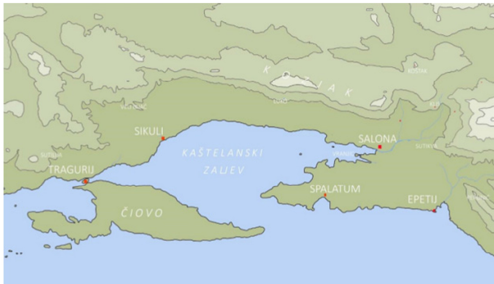
Karta 3. Karta Kaštelanskog zaljeva

Najstariji nalazi importirane grčko-helenističke keramike na području Tragurija jesu: atički krater koji se datira u V. st. pr. Kr. i apulski riton koji se datira u IV. st. pr. Kr. Najčešće se nalazi helenističke keramike koja je pronađena na području Trogira datiraju u III. i II. st. pr. Kr. To su obično ostatci keramike tipa Gnathia , crnoprermazane helenističke keramike ili keramike tipa West slope . Nalazi sivoprermazane i reljefno ukrašene helenističke keramike datiraju se nešto poslije, u II. i I. st. pr. Kr. Budući da je dekor na reljefnim helenističkim čašama iz Tragurija, od kojih valja istaknuti motiv dupina, rozeta i lišća lotosa usporediv s motivima na reljefnim čašama isejske produkcije, vrlo je moguće kako su proizvedene lokalno. Pretpostavlja se kako su čaše koje su pronađene u Traguriju proizvedene u helenističkom naselju koje se nalazilo na položaju Resnik-Sikuli, jer u Trogiru, za razliku od Resnika, nema nalaza kalupa koji bi dokazali produkciju keramike. 86 Udaljenost od Trogira do Resnika iznosi oko osam kilometara. 87