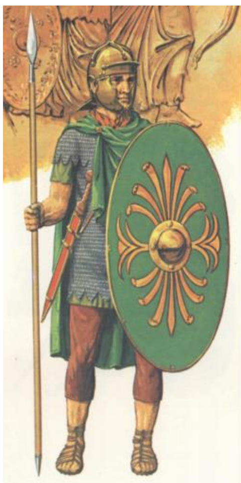
Slika 2: Auksilijarni vojnik (P. CONNOLY, 1975, 50.)

i kao granični garnizoni. Sastoje se od raznih vrsta vojnika, kao što su konjica, strijelci, praćkaši i ostali netipični oblici vojnika za rimsku vojsku. Osnovna razlika od tipične auksilijarne jedinice je što su numeri slabije organizacije i discipline. 44 U pogledu vojnih plaća, auksilijarni vojnici su plaćeni u iznosu trećinske plaće od standardnog legionara, unatoč tome nakon časnog odsluženja vojnog roka u trajanju 25 godina, dobivaju rimsko građansko pravo i postaju punopravni građani Rimskog Carstva kao i njihova prva žena (ukoliko su ih imali više), uz svu njezinu djecu. 45 Bez obzira na inferiorni status u odnosu na legije, auksilijarne jedinice također bi dobivale službena priznanja i počasne titule od strane cara za iznimna vojna postignuća i odanost. 46