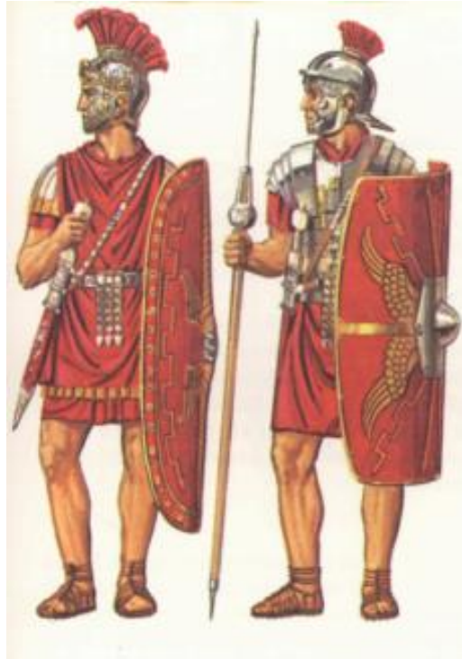
Slika 3: Pretorijanac u svečanoj i vojnoj odori (P. CONNOLY, 1975, 39.)

Formiranjem pretorijanske garde i proširenjem njene uloge putem Augustovih odluka, u ranom Principatu čitava se rimska vojska integrira u samu srž carske administracije, čime car učvršćuje svoju vlast i osigurava veću učinkovitost državnih službi na razini čitavog Carstva.