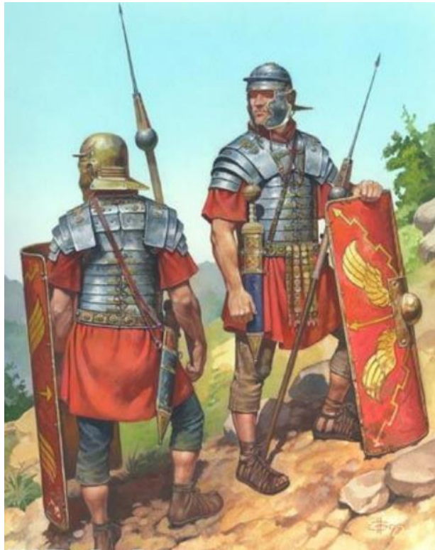
Slika 1: Legionari

Takva se praksa počela primjenjivati od vladavine cara Tiberija (14-37 AD) te je omogućila povećanu fleksibilnost i brzinu odaziva čitave rimske vojske. 34