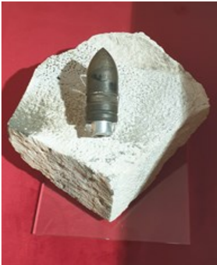
SLIKA 1: Zrno koje pogađa kupolu katedrale svetog Jakova

Svakim danom otprilike tri topa uz branitelje sa „STRELAMA 2M“ pogađali su agresorske zrakoplove iznad Zečeva. 43