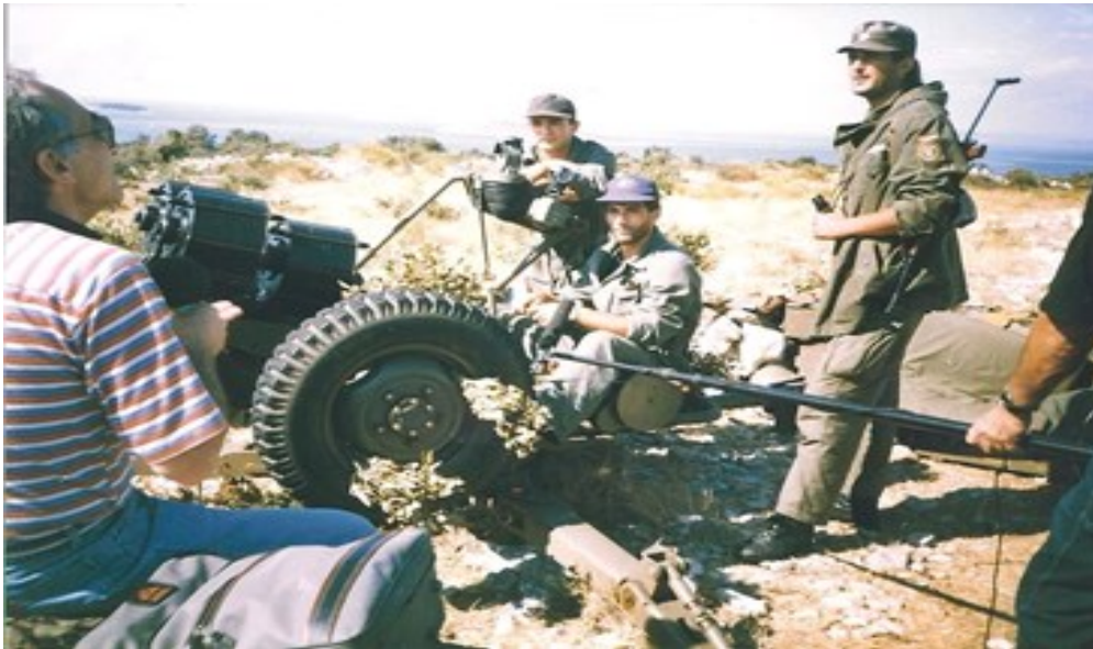
SLIKA 2: Akcija topnika na Zečevu

Nije ni slutio da će njegov poklik obradovati i oduševiti čitavu Hrvatsku, ali i običi skoro cijelu Europu - kao simbol uspjeha hrabrih hrvatskih vojnika na šibenskom bojištu. Kao nesvakidašnje ohrabrenje hrvatskim borcima u nastavku Domovinskog rata. 61