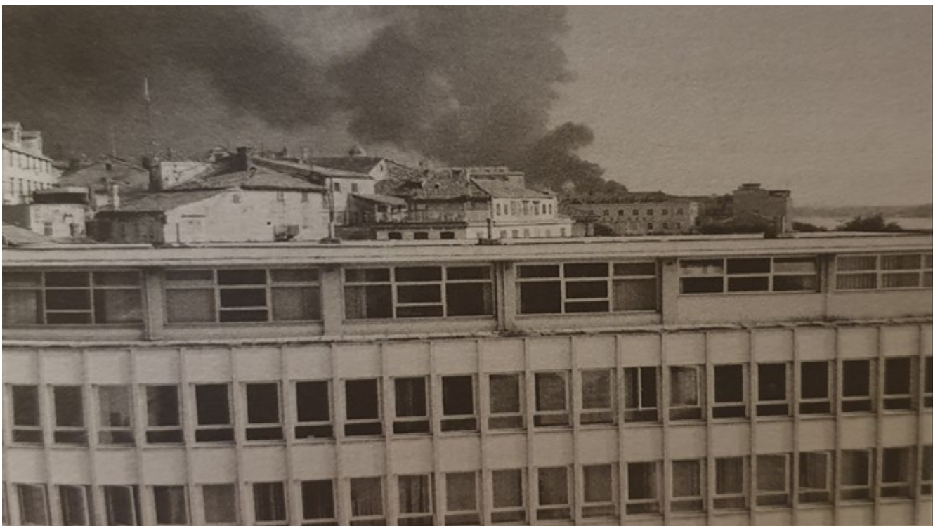
SLIKA 3: Ratni dim na šibenskom nebu

Šibenskog biskupa ohrabрили su pozivi iz Europe, odakle nisu dolazile samo poruke podrške, već se najavljavao i dolazak nemale pomoći stradalom Šibeniku. 85