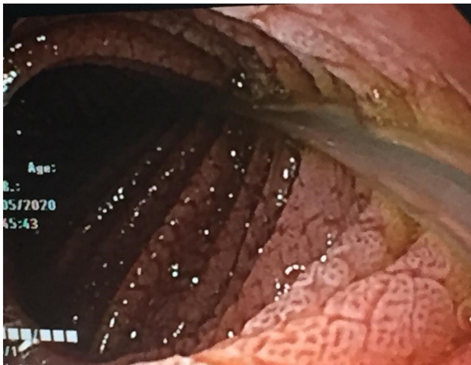
SLIKA 2. Endoskopski prikaz tankog crijeva 2