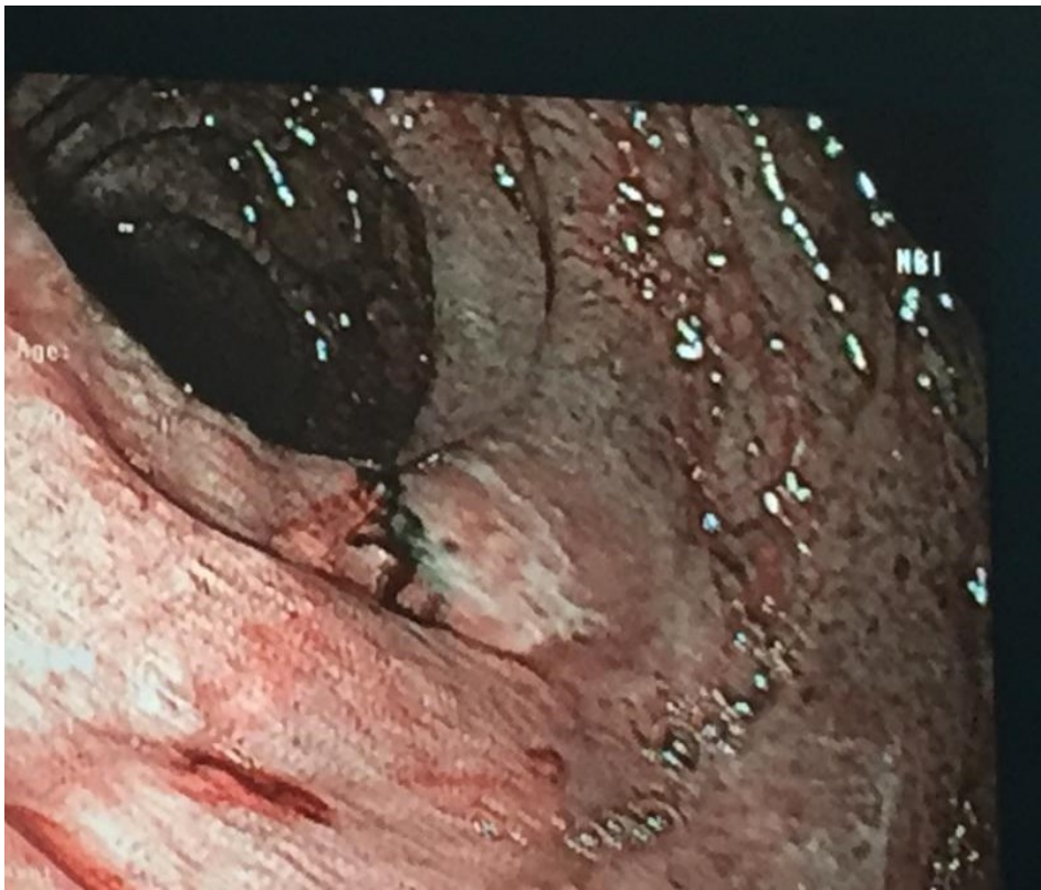
SLIKA 1. Endoskopski prikaz tankog crijeva 1