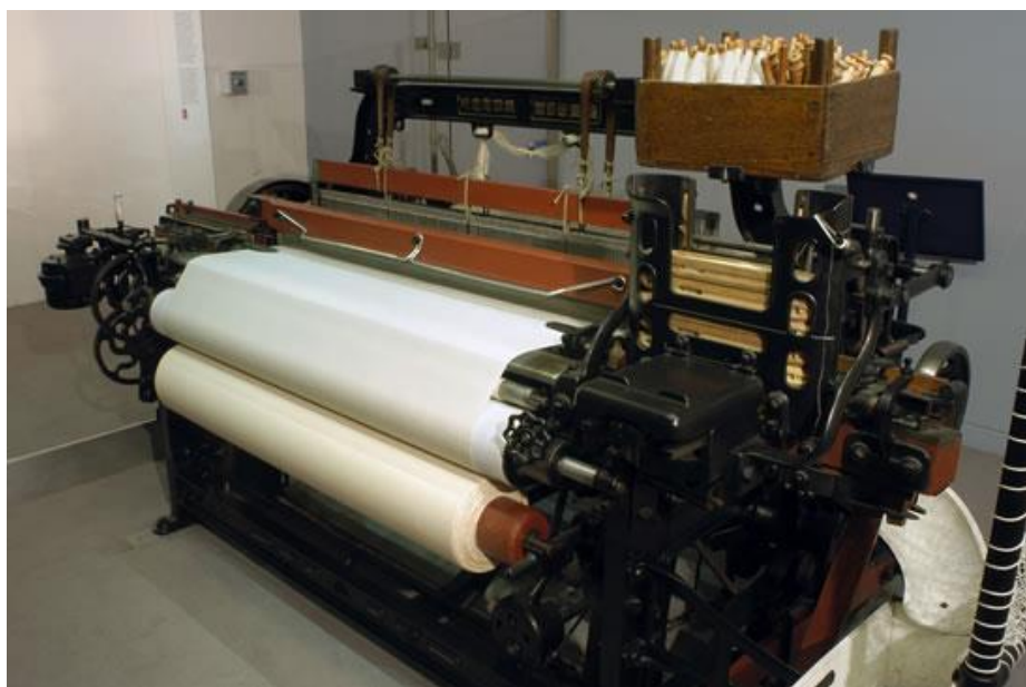
Slika 1. Automatizirani tkalački stroj tvornice Toyota