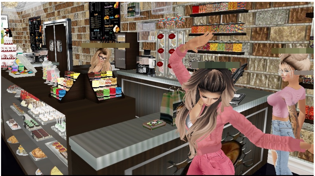
Slika 5. Prikaz tehničkih mogućnosti chata : ples avatara