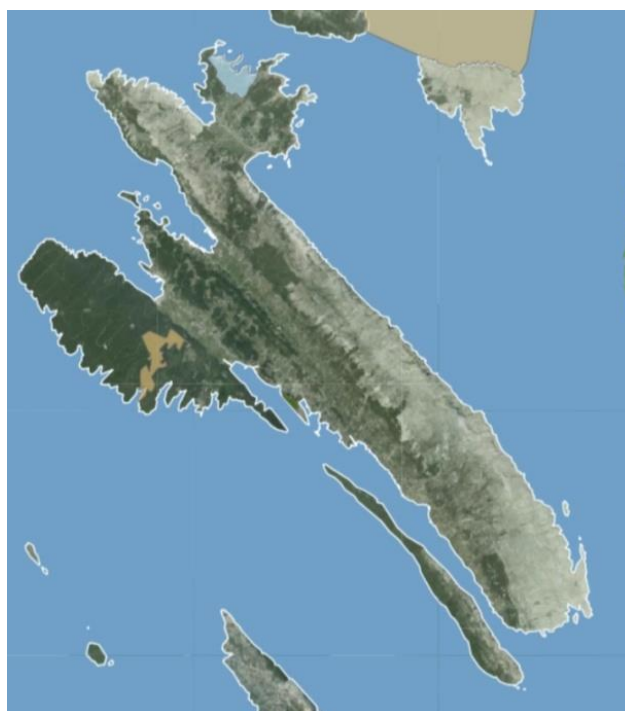
Slika 2. Položaj šume Dundo

Nama najzanimljiviji dio otoka Raba je krška zaravan Kalifront koja je ujedno i najšumovitiji dio otoka. Kalifront se nalazi na jugozapadu otoka Raba i obuhvaća posebni rezervat šumske vegetacije Dundo (slika 2.) čija je površina 106,51 ha (Subotić, 1997.).