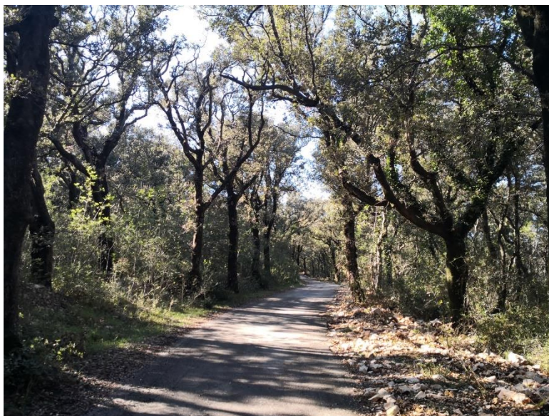
Slika 1. Šuma Dundo

Šuma Dundo smještena je na otoku Rabu s mediteranskim tipom klime, oznake prema Kopperu Cfa. Veliki značaj za raznoliki biljni pokrov otoka ima vapnenački greben Kamenjak koji ga štiti od jakih udara bure i juga. Na području šumovitog poluotoka Kalifronta smještena je šuma Dundo (slika 1.) zauzimajući 106 ha. Tla na kojima se šuma Dundo razvila su crvenice i smeđa tla na vapnencu (Španjol 1997.). Takva tla pogodna su za razvoj eumediteranske šume hrasta crnike i crnog jasena ( Orno-quercetum ilicis H-ić) sa različitim biljnim vrstama u sloju drveća, grmlja i prizemnog rašća.