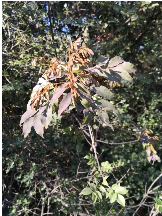
Slika 4. Crni jasen u šumi Dundo