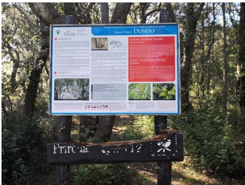
Slika 6. Poučna ploča u šumi Dundo

Ekološka mreža Natura 2000 obuhvaća cijeli otok Rab, pa tako i posebni rezervat šumske vegetacije Dundo, pod identifikacijskim brojem HR2001359. Otok Rab uvršten je u ekološku mrežu Natura 2000 (slika 7.), kao područje od velike važnosti za očuvanje ugroženih vrsta ptica i staništa na kojima te ptice obitavaju. Na ovom području posebno se štite vrste ovisne o otvorenim predjelima. Takva vrsta je bjelonokta vjetruša ( Falco naumanni Felischer) čije je jedino poznato mjesto gniježđenja na Rabu. Na Rabu obitavaju i druge ugrožene ptičje vrste poput, sove ušare ( Bubo bubo L.), bjeloglavog supa ( Gyps fulvus Hablizl), zmijara ( Circaetus gallicus Gmelin), legnja ( Carimulgidae Vigors), sivog ćuka ( Athene noctua Scopoli), ševe krunice ( Lullula arborea L.) i primorske trepteljke ( Anthus campestris L.) (Udruga Biom).