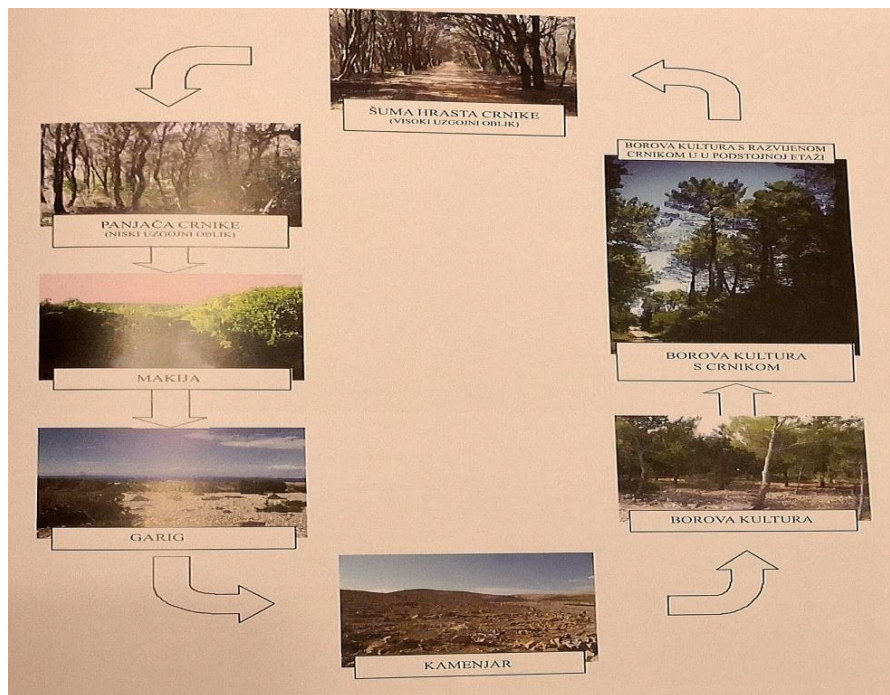
Slika 5. Sukcesija u šumama hrasta crnike