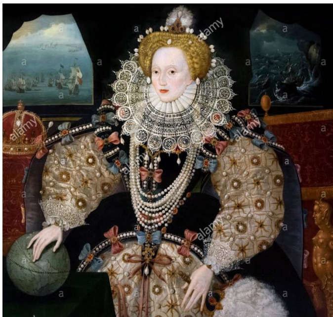
Slika 6. Armada portret Elizabete I.: Alamy poveznica 30. rujna 2020.

Neizostavan podatak u Elizabetinoj vladavini jest pobjeda nad tzv. Nepovjedivom Armadom, španjolskog kralja Filipa II. koji je bio moćno oružje Rimokatoličke Crkve. Naime, Elizabeta je kroz nekoliko svojih postupaka uspjela provocirati Filipa koji je odgovorio napadom na Englesku. Dopustila je pljačkanje španjolskih brodova, zatim je pomogla protestantima u Nizozemskoj koje je bila pod Filipovom vlašću kako bi lakše