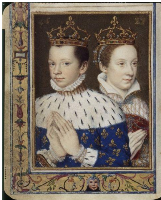
Slika 3. Franjo II. (15 godina) i Marija Stuart (17 godina), 1559. godina

Morayja, koji je, uz preostalih osam predstavnika škotskog Parlamenta, bio prisutan na potpisivanju još jednog ženidbenog ugovora. Marija je potvrdila škotske slobode i zakone, dok je Franjo dobio krunu suvladara Škotske koja će priznavati nasljedstvo u ženskoj lozi. 37 Također, ne bi trebao iznenaditi podatak kako je postojao tajni dio ugovora, sastavljen od strane Marijinih ujaka koji su djevojku prisilili na njegovo potpisivanje, a nalagao je kako će Škotska zajedno s njenim nasljednim pravima na Englesku i Irsku, u slučaju njene smrti bezuvjetno pripasti francuskoj kruni. 38 Kraljica Škota je na ovaj način nesvjesno digla ruke od Engleske i još jednom potvrdila kako su ona i, njena rodna Škotska, postale komad kolača za koji će se svi otimati ne bi li tako proširili katolički utjecaj na Otoku. U škotskom se Parlamentu, tijekom 1550-ih godina, dala naslutiti određena netrpeljivost između Francuza i Škota zbog sve većeg broja francuskih podanika, što je pogodovalo Mariji od Guisea. Francuski je kralj, podmitivši škotsko plemstvo, doveo udovicu na poziciju regentice.