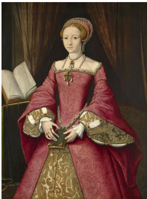
Slika 2. Elizabeta kao princeza: RCT poveznica 17. kolovoza 2020.