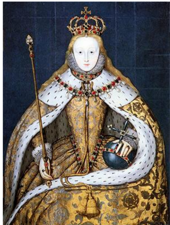
Slika 4. Elizabetina krunidba: History Today poveznica 5. rujna 2020.