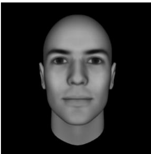
Slika 3. Primjer nemanipuliranog lica (osoba s nižim fWHR-om) (Oosterhof i Todorov, 2008)

Četiri odabrane slike zatim su manipulirane koristeći besplatan online program za uređivanje slika PicMonkey . Kako ten modela ne bi utjecao na odgovore sudionika, korištene su slike u crno-bijeloj verziji (Slika 3). Takve slike korištene su kao lica nižeg fWHR-a, a kako bi se dobila lica višeg fWHR-a te četiri slike proširene su za 12 posto (Slika 4). Dakle, ukupno je korišteno osam slika modela, četiri proširena odnosno višeg fWHR-a i četiri neproširene slike odnosno nižeg fWHR-a.