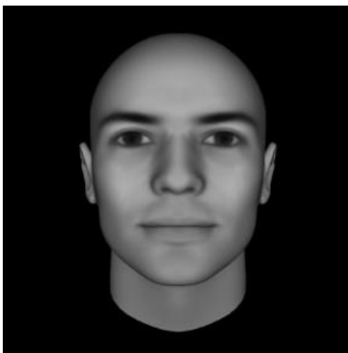
Slika 4. Primjer manipuliranog tj. proširenog lica (osoba s višim fWHR-om) (Oosterhof i Todorov, 2008)