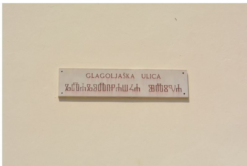
Slika 11. Latinica i glagoljica na natpisu u Glagoljaškoj ulici (4.8.2013.)

Zaključno, u četvrti Relja i Jazine primjećuje se polagan rast broja privatnih natpisa i rast broja višejezičnih natpisa. Privatni natpisi generiraju veću raznolikost u jezičnom krajoliku. Hrvatski je najbrojniji prvi jezik natpisa te je 2. na popisu drugih jezika natpisa. Engleski jezik slijedi hrvatski na popisu prvih jezika natpisa, dok je na vrhu popisa drugih jezika natpisa. Taj nam podatak govori da je hrvatski primarni jezik pisane komunikacije ove gradske četvrti, a engleski služi kao pomoćni jezik. Uz ta dva jezika mogu se vidjeti i talijanski i njemački. Hrvatski je najčešći na reklamama, objektima i na informativnim natpisima, dok je engleski najviše prisutan na reklamama. Relja i Jazine su prvenstveno