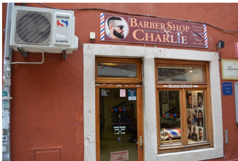
Slika 33. Briačnica u ulici Špire Brusine (21.10.2018.).