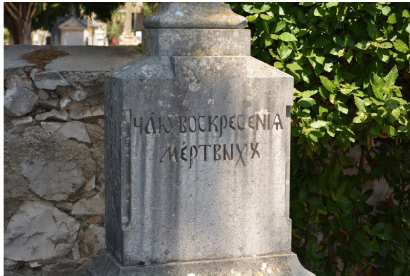
Slika 26. Nadgrobnji spomenik na ruskom jeziku i ćirilici (6.8.2013.)

Natpisi s nadgrobnih spomenika s Gradskog groblja pokazuju nam raznolikost koje više nema u vertikalnom jezičnom krajoliku Zadra, a možemo pretpostaviti da je takva raznolikost postojala i u javnom prostoru grada. Za vrijeme fašističke vlasti u Zadru javni je prostor također sadržavao mnoge režimske natpise i parole (v. Slika 27). Promjenama vlasti i režima vertikalni se jezični krajolik briše ili korigira te se postavljaju natpisi koji su u skladu s novom ideologijom.