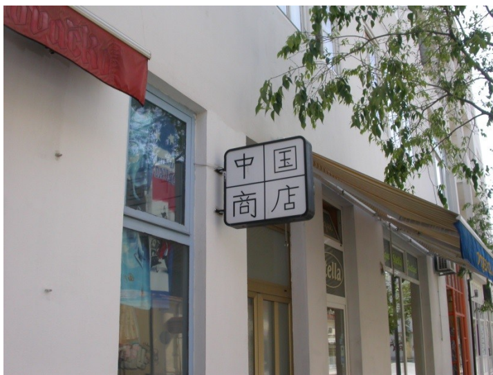
Slika 9. Reklama na kineskom jeziku na Relji (28.4.2012.)

Osim pretežitog latiničnog pisma, u jezičnom krajoliku ove četvrti nalazimo kinesko pismo i glagoljsko pismo. Kinesko pismo korišteno je na reklamama i u izlogu kineske trgovine (v. Slika 9), dok je glagoljsko pismo korišteno na grafitu posvećenom zadarskom nogometnom i košarkaškom klubu (v. Slika 10). Osim na grafitu, glagoljica je prisutna i u Glagoljaškoj ulici koja se nalazi odmah pored Samostana sv. Ivana Krstitelja u kojem franjevci trećoređci stoljećima čuvaju glagoljaštvo (v. Slika 11). Istočni zid Glagoljaške ulice urešen je kamenim pločama u koje su uklesana sva glagoljska slova. S obzirom na dinamiku jezičnoga krajolika, u 2019. godini kineskoga teksta više nema u javnom prostoru ove gradske četvrti, dok je glagoljica i dalje prisutna: kameni natpisi su i dalje tamo, no grafit bi mogao biti uklonjen zbog intenzivnih građevinskih radova u pozadini zida na kojem se tekst nalazi.