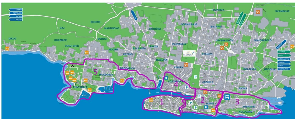
Slika 1. Područje uzorkovanja kod proučavanja jezičnoga krajolika Zadra

Razlog zašto smo odabrali baš ove dijelove grada jest u tome što je u njima najveći protok stanovništva na dnevnoj bazi, budući da se na Poluotoku, Jazinama, Relji i Voštarnici nalazi najveći dio državnih, gradskih, županijskih, sudskih i obrazovnih institucija, čime je kroz te četvrti primjetna i najveća komutacija stanovništva. Relevantnost protoka stanovništva na dnevnoj bazi očituje se u tome što će u tim dijelovima grada posljedično biti i više natpisa usmjerenih prema tom stanovništvu, a samim time je i utjecaj jezičnoga krajolika veći jer ga konzumira veći broj prolaznika. Drugim riječima, jezični krajolik u tim četvrtima ima najveći utjecaj na prolaznike, a veći broj prolaznika ima najveći utjecaj na količinu i sadržaj natpisa u jezičnom krajoliku.