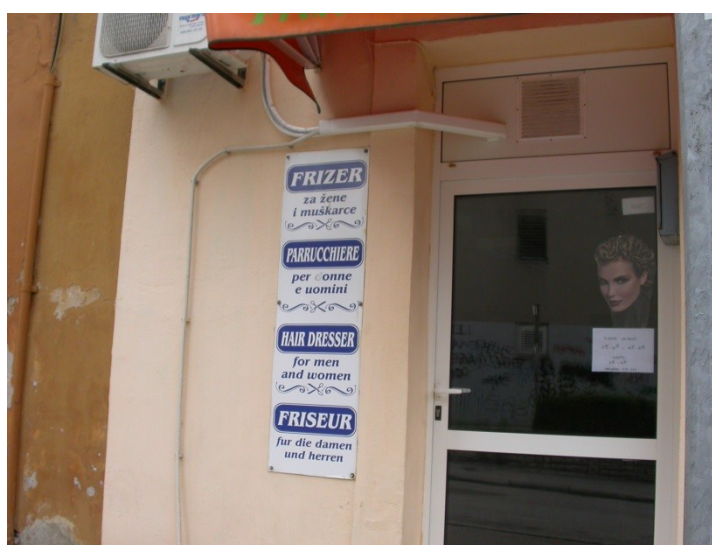
Slika 13. Reklama na hrvatskom, talijanskom, engleskom i njemačkom jeziku u Ulici Ivana Mažuranića (22.4.2012.)

Ako promotrimo koji su jezici prisutni na kojem žanru natpisa vidjet ćemo da je primjerice latinski prisutan na reklamama, što nam sugerira da se radi o tvrtkama koje su odabrale naziv na latinskom zbog zakona koji je dopuštao isključivo nazive na hrvatskom ili nekom od klasičnih jezika. Njemački i talijanski prisutni su na reklamama i informativnim natpisima, budući da mnogi proizvodi i usluge na hrvatskom tržištu dolaze iz Njemačke, odnosno iz Italije (v. Slika 13).