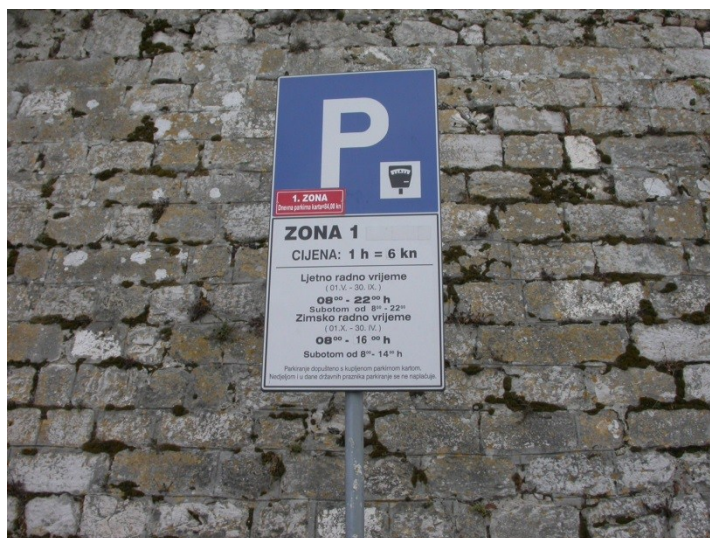
Slika 3. Prometni znak na parkiralištu (11.9.2011.).

Prema redoslijedu pojavljivanja na natpisu hrvatski je prvi jezik na velikom broju natpisa (Tab. 8) koji pripadaju infrastrukturnom sektoru (INF) (27,04%). Takvi su natpisi uglavnom postavljeni od strane gradskih institucija i uključuju ploče s nazivom ulice, parkirne automate, kanalizacijske poklopce i prometne znakove. Važno je primijetiti da su 2011. godine parkirni automati imali vrlo malo teksta prevedenog na engleski jezik i to tiskanog sitnim slovima tako da je njihova korist u turističkoj sezoni zasigurno bila upitna. Ostali infrastrukturni natpisi, posebice prometni znakovi (v. Slika 3) koji se također odnose na parkiranje, bili su isključivo na hrvatskom jeziku. Hrvatski je prvi jezik i kod velikog broja trgovačkih natpisa (TRG) (16,76%).