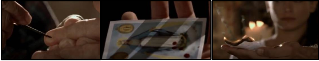
Figura 3 La punciuta nella serie Squadra antimafia – Palermo oggi.

non tradire mai e per nessun motivo le regole dell'organizzazione. (Falcone, Padovani 2016:110-114)