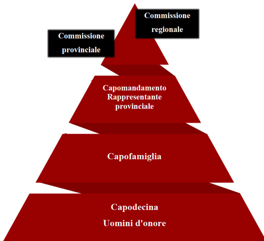
Figura 2 Struttura piramidale di Cosa Nostra

Come racconta in un documentario Pietro Grasso (2012), procuratore nazionale antimafia, è grazie a Tommaso Buscetta, pentito di Cosa Nostra, che nel 1984 sono state fatte delle chiarezze a riguardo. Il pentito ha deciso di collaborare con la giustizia, soprattutto con Giovanni Falcone. Ha dato un grande contributo all'investigazione rivelando alcuni segreti e informazioni sull'organizzazione fino a quel momento ignote.