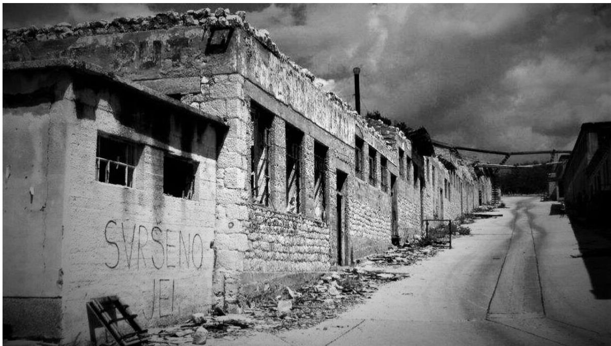
Slika 2. Ruševine nekadašnje kaznionice na Golom otoku