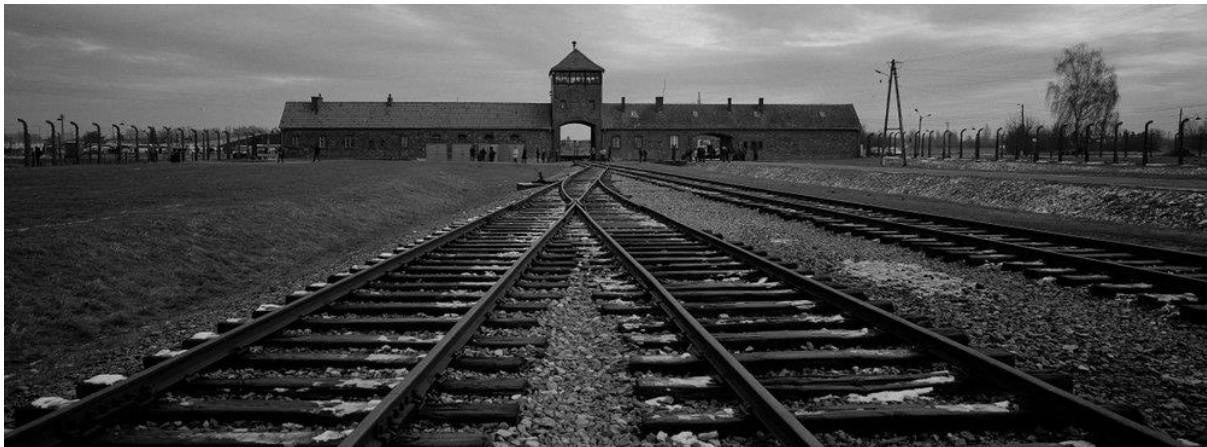
Slika 1. Auschwitz