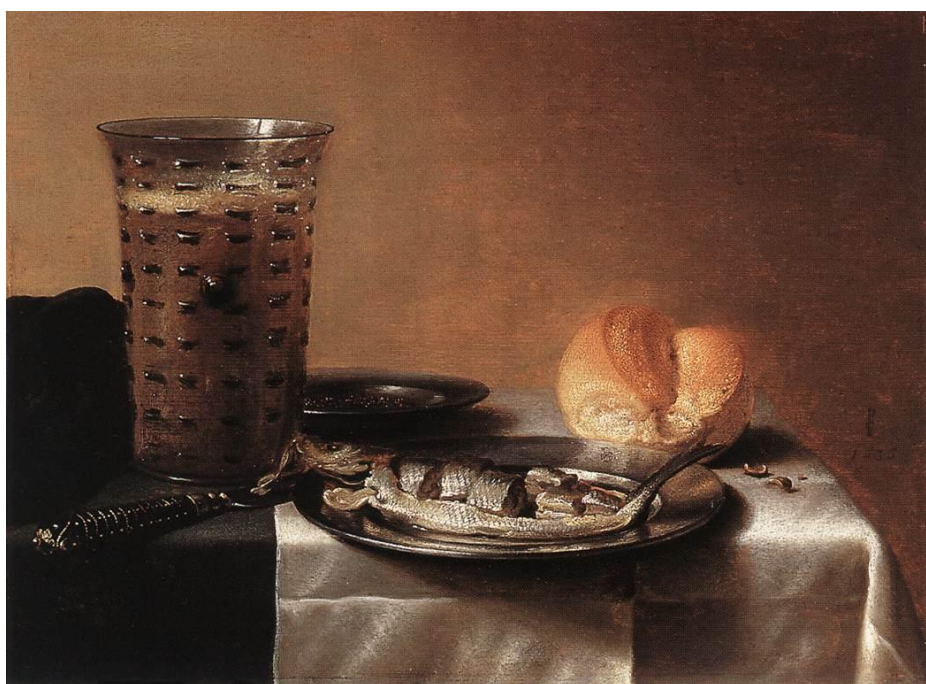
Prilog 12. Pieter Claesz, Mrtva priroda s čašom piva i dimljenom haringom na tanjuru, 1636.