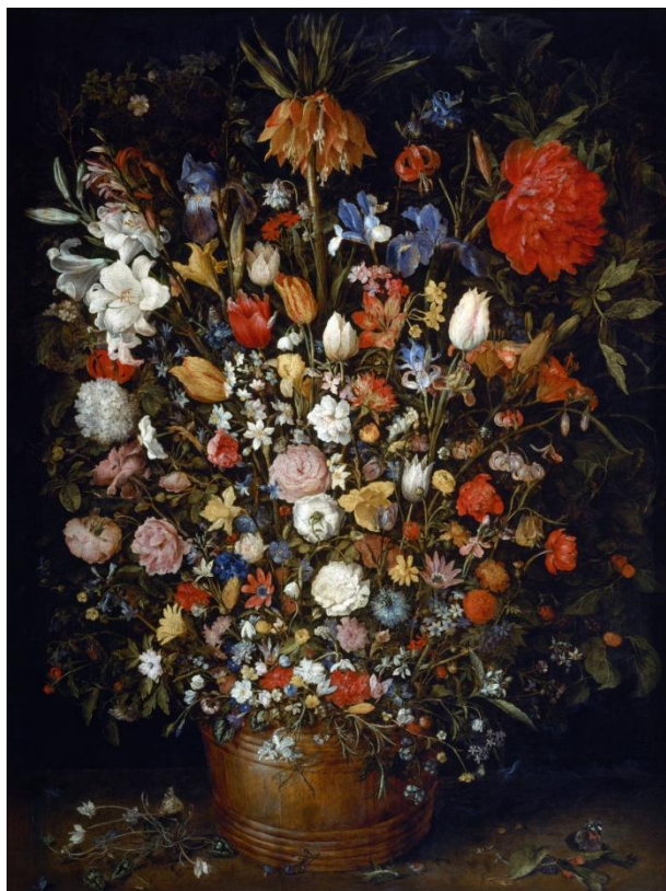
Prilog 5. Jan Brueghel Stariji, Veliki buket u drvenoj posudi, oko 1606.-1607.