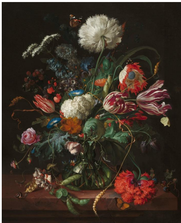
Prilog 7. Jan Davidsz. de Heem, Vaza cvijeća, oko 1660.