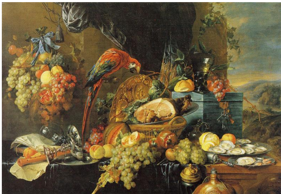
Prilog 16. Jan Davidsz. de Heem, Raskošna mrtva priroda s papigom, oko 1655.