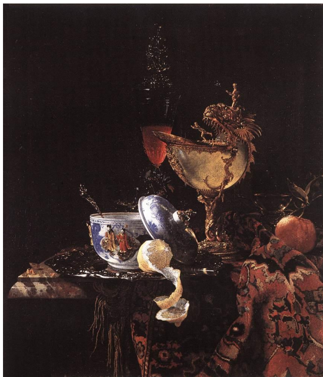
Prilog 15. Willem Kalf, Mrtva priroda s kineskom zdjelom, nautilus pokalom i drugim predmetima, 1662.