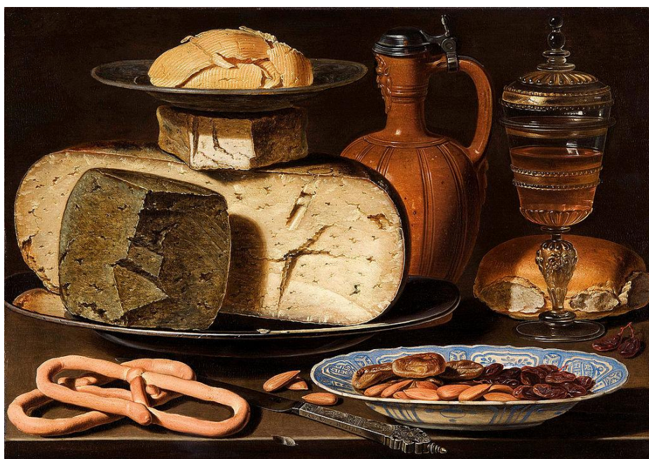
Prilog 10. Clara Peeters, Mrtva priroda sa sirevima, bademima i phecima, oko 1615. (izvor: Mauritshuis, Den Haag)