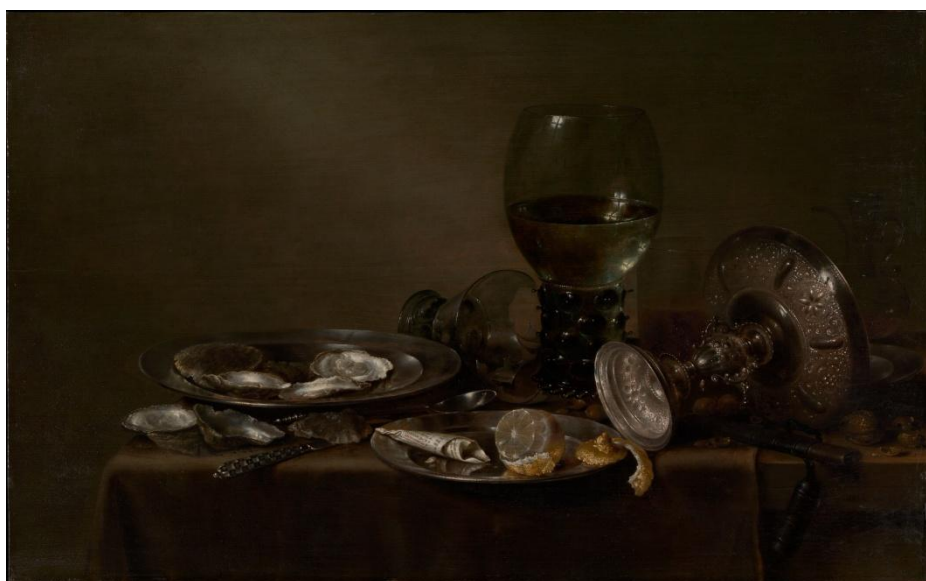
Prilog 14. Willem Claesz. Heda, Mrtva priroda s kamenicama, srebrnom tazzom i staklenim posuđem, 1635.