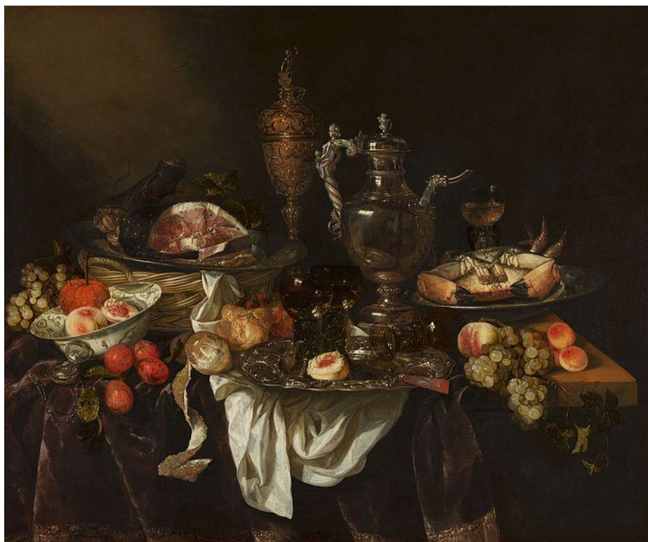
Prilog 18. Abraham van Beijeren, Banket s autoportretom slikara na srebrnom vrču, 1655.-1665.