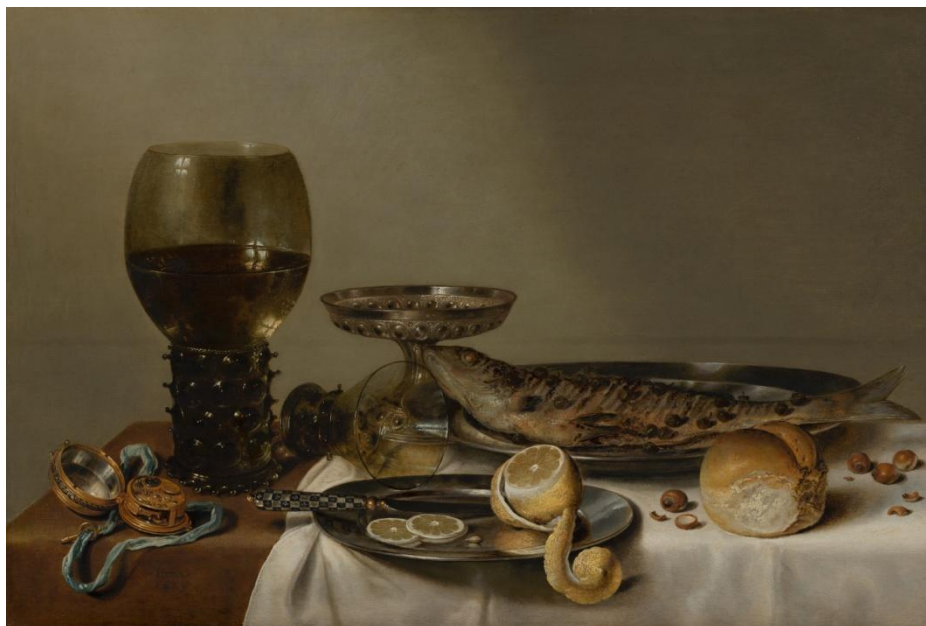
Prilog 11. Willem Claesz. Heda, Mrtva priroda s roemer čašom i satom, 1629.