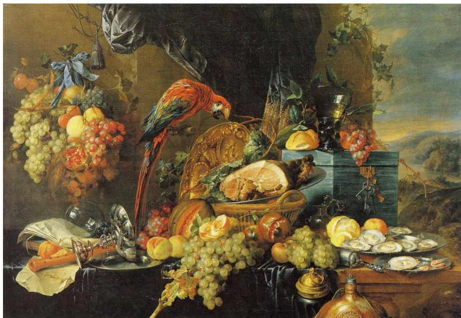
Prilog 16. Jan Davidsz. de Heem, Raskošna mrtva priroda s papigom, oko 1655.