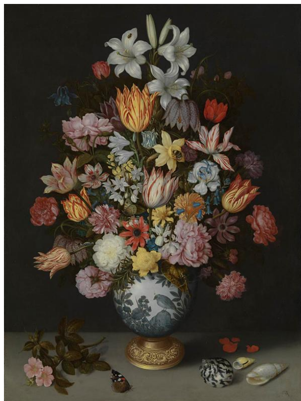
Prilog 4. Ambrosius Bosschaert Stariji, Mrtva priroda s cvijećem u Wan-Li vazi na polici s ostalim cvijećem, školjkama i leptirom, 1609.-1610.