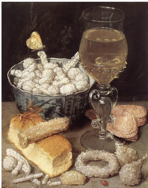
Prilog 9. Georg Flegel, Mrtva priroda s kruhom i slatkišima, oko 1637.