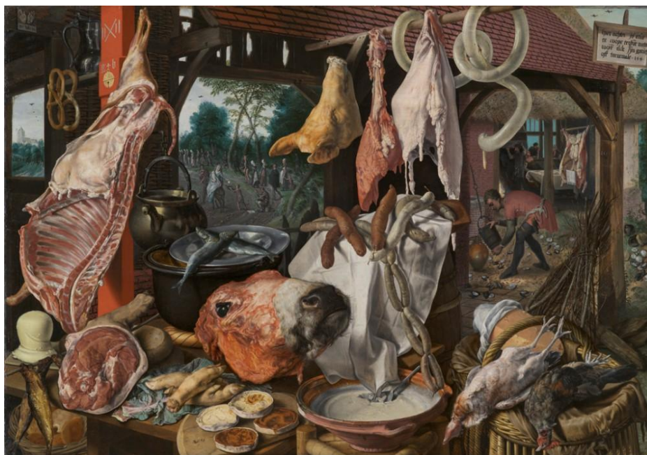
Prilog 8. Pieter Aertsen, Mesarska tezga sa Svetom obitelji, 1551.