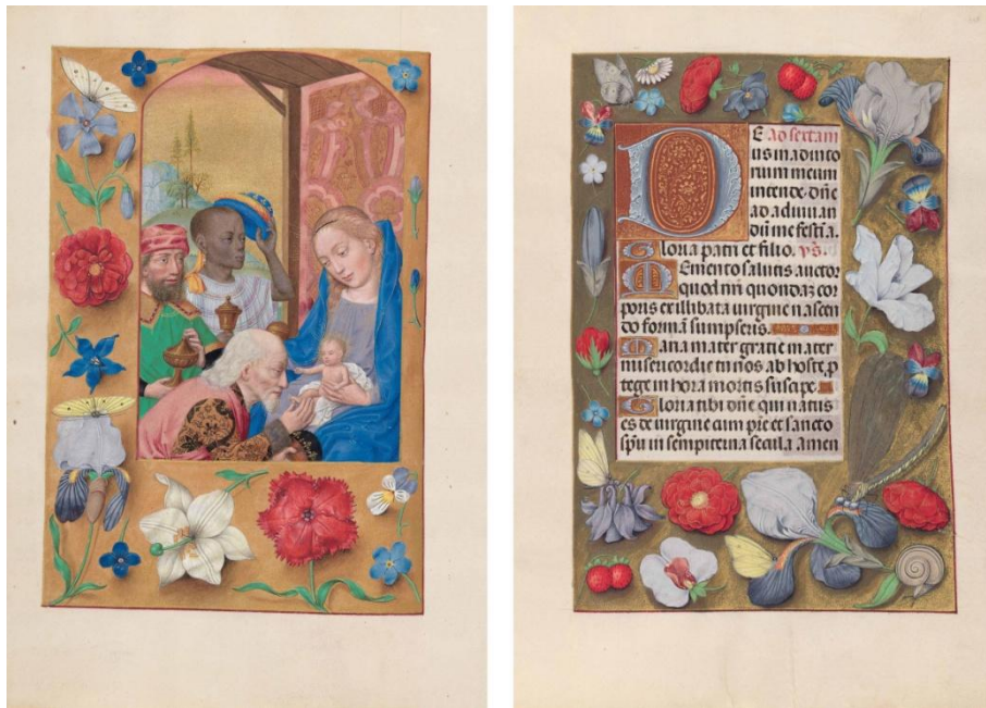
Prilog 1. Časoslov Izabele Kastiljske, 136v i 137r