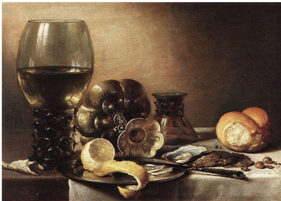
Prilog 13. Pieter Claesz, Doručak s kamenicama, 1633.