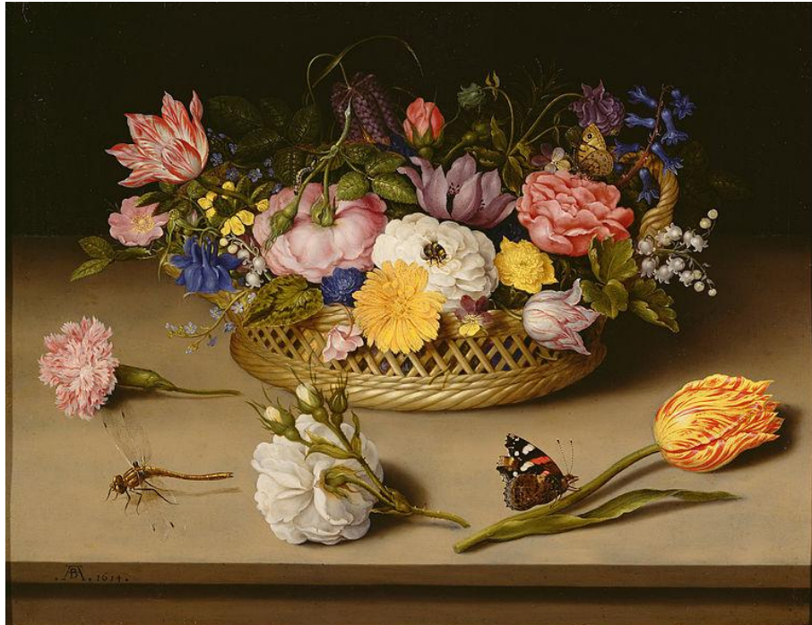
Prilog 2. Ambrosius Bosschaert Stariji, Mrtva priroda s cvijećem, 1614.