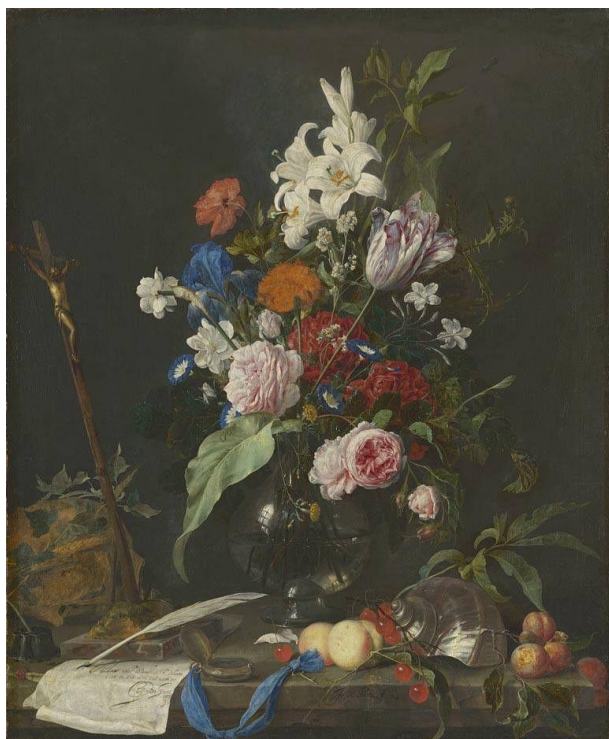
Prilog 6. Jan Davidsz. de Heem, Mrtva priroda s cvijećem, raspelom i lubanjom, oko 1645.