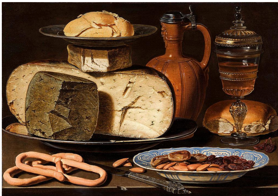
Prilog 10. Clara Peeters, Mrtva priroda sa sirevima, bademima i phecima, oko 1615.