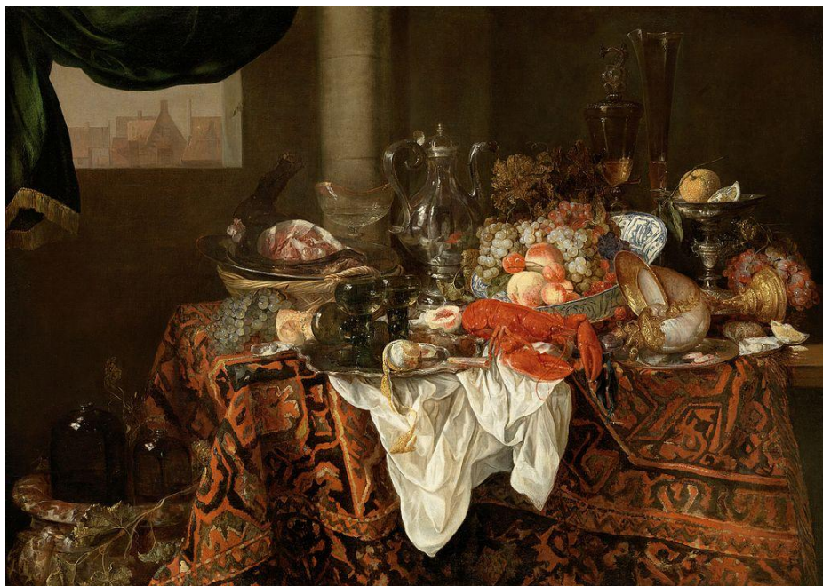
Prilog 17. Abraham van Beijeren, Banquet, 1650-e