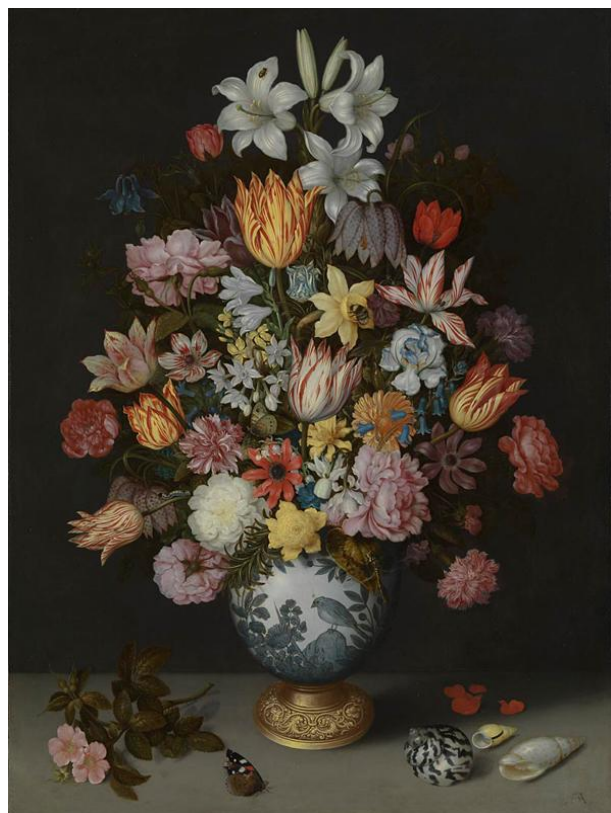
Prilog 4. Ambrosius Bosschaert Stariji, Mrtva priroda s cvijećem u Wan-Li vazi na polici s ostalim cvijećem, školjkama i leptirom, 1609.-1610.