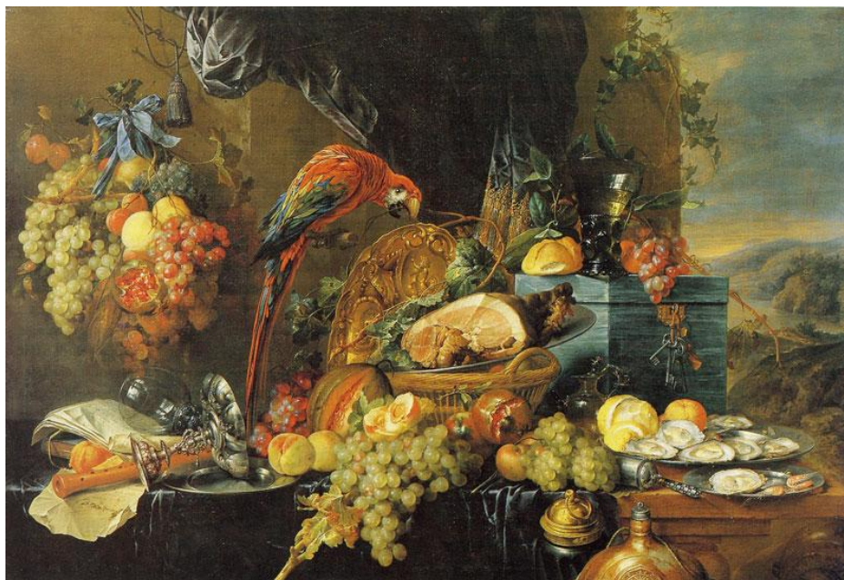
Prilog 16. Jan Davidsz. de Heem, Raskošna mrtva priroda s papigom, oko 1655.