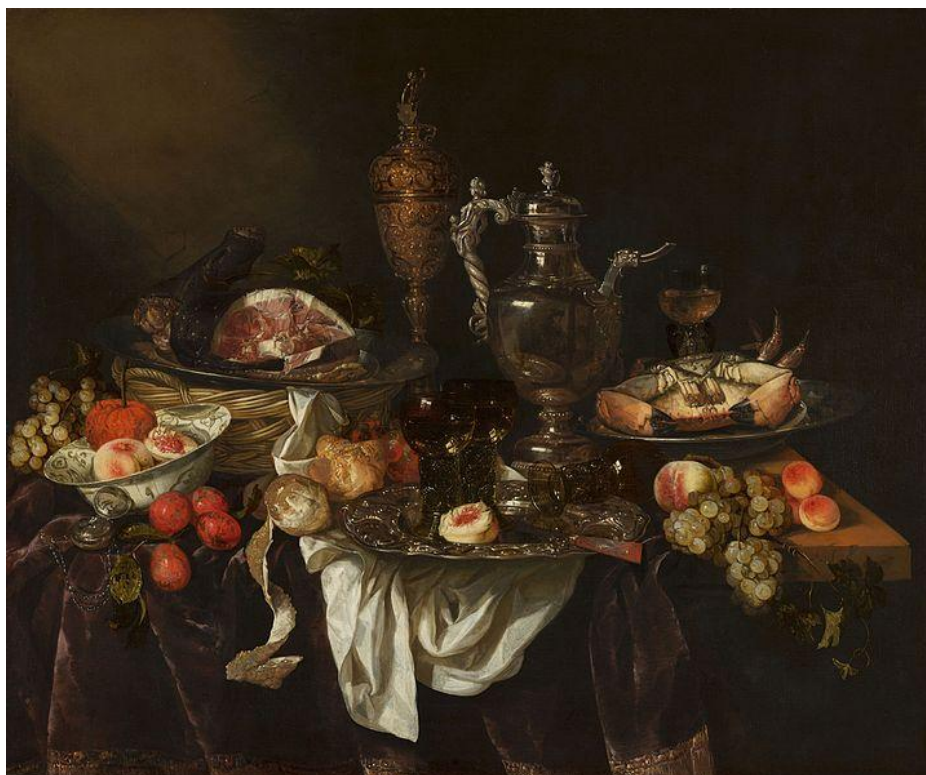
Prilog 18. Abraham van Beijeren, Banquet s autoportretom slikara na srebrnom vrču, 1655.-1665.