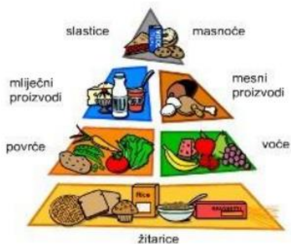
Slika 3. Piramida zdrave prehrane