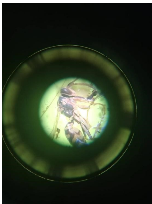
Slika 7. Prikaz Hymenoptere pod binokularnim mikroskopom