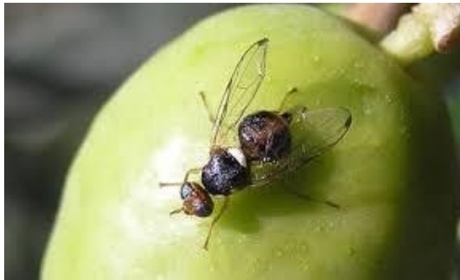
Slika 3. Odrasla maslinina muha

prilagodljivi uvjetima sredine u kojoj borave. Svojom hranom uzrokuju štete na poljoprivrednim usjevima kao i u šumarstvu. Od štetnih nametnika masline najučestaliji su Maslinova muha ( Bactrocera oleae , Rossi, 1790.), Maslinov moljac ( Prays oleae , Bernard, 1788.) i Maslinov svrdlaš ( Rhynchites cribripennis , Desbrochers, 1869.). Nisu svi člankonošci štetni već ima i korisnih koji u prirodi održavaju ravnotežu i ne dopuštaju da se štetnici prenamnože što može biti od velike koristi za poljoprivredne proizvođače. Maslinova muha (Slika 3.) prisutna je širom svih uzgojnih područja maslina na Mediteranu te spada u najvažnijeg štetnika masline. Značajan je gospodarski štetnik, jer se javlja svake godine. Štetnost maslinove muhe ovisi o klimatskim uvjetima. Razvija nekoliko generacija godišnje, na našim prostorima 3- 4. Izravne posljedice napada su otpadanje plodova i gubitak njihove težine, a neizravne se očituju u smanjenju kvalitete i količine ulja (Barić i Pajač, 2012.).