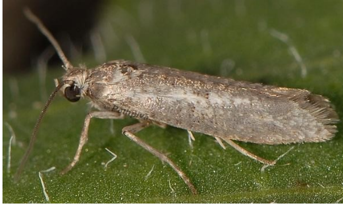
Slika 4. Maslinov moljac

Maslinov svrdlaš je pipa crvenkasto sive boje (slika 5). Prednji dio tijela produžuje se u rilce kojim kao svrdlom buši plodove, te je po tome i dobio ime. Pipa prezimljuje u tlu iz kojeg izlaze odrasli oblici od početka travnja do kraja svibnja i lete po masliniku u potrazi za hranom (Barić i sur., 2014.). Oštećeni se plodovi suše i opadaju. Ženke maslininog svrdlašja plod ubodu do koštice i na mjestu uboda polože po jedno jaje. Lykouressis i sur. (2005.), služili su se metodom otresanja grana u praćenju pojave odraslih oblika na maslinicima.