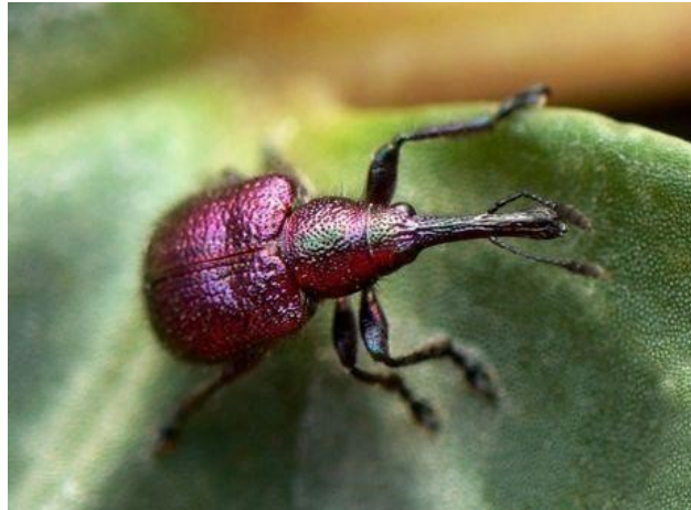
Slika 5. Maslinov svrdlaš

Maslinov svrdlaš je pipa crvenkasto sive boje (slika 5). Prednji dio tijela produžuje se u rilce kojim kao svrdlom buši plodove, te je po tome i dobio ime. Pipa prezimljuje u tlu iz kojeg izlaze odrasli oblici od početka travnja do kraja svibnja i lete po masliniku u potrazi za hranom (Barić i sur., 2014.). Oštećeni se plodovi suše i opadaju. Ženke maslininog svrdlašja plod ubodu do koštice i na mjestu uboda polože po jedno jaje. Lykouressis i sur. (2005.), služili su se metodom otresanja grana u praćenju pojave odraslih oblika na maslinicima.