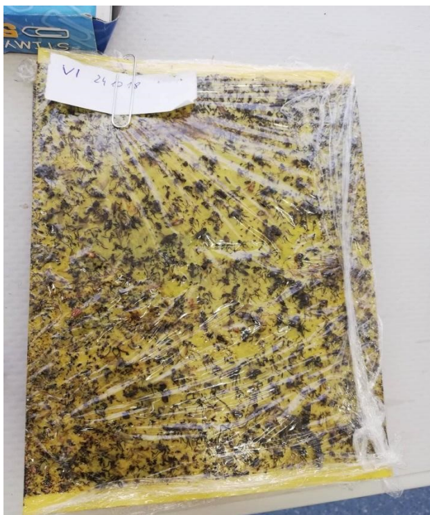
Slika 6. Primjer žute ploče spremne za brojanje člankonožaca