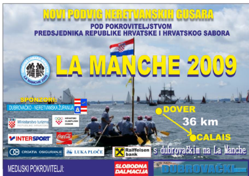
Slikovni prilog 5. La Manche

S lađom se preveslao Jadran, La Manche, veslalo se na Jarunu, posjećuju se Vinkovačke jeseni, lađa je bila u Francuskoj na sajmu brodovlja, a prema riječima predsjednika Udruge pokušava se organizirati da lađari s lađom posjete još nekoliko manifestacija, kako bi se za lađu i maraton više čulo.