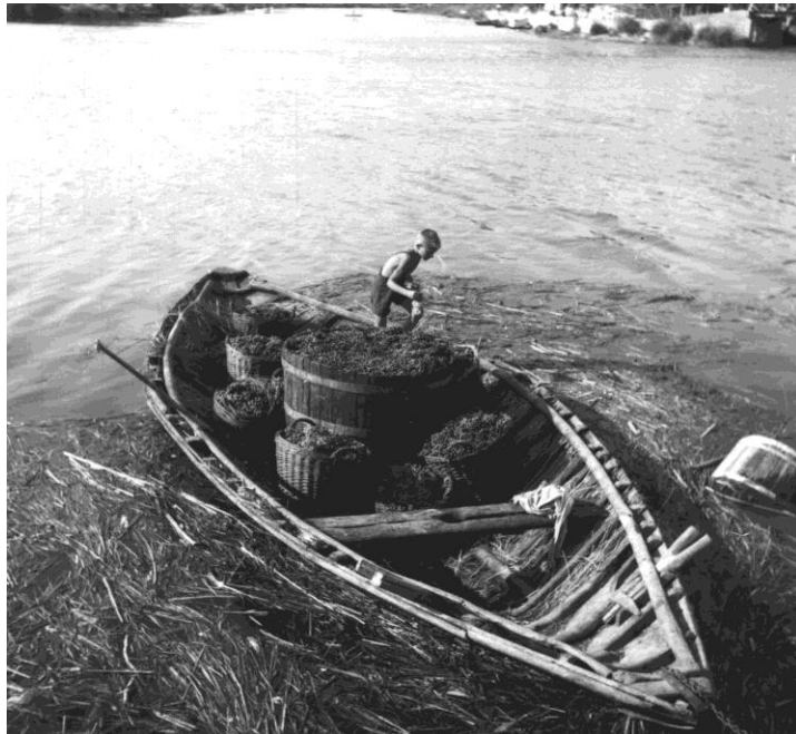
Slikovni prilog 2. Stara lađa

Prije nego krenem s pričom o maratonu lađa prvotno je potrebno istaknuti koju je ulogu lađa imala u dolini Neretve te zbog čega je ona toliko značajna. Lađa je neretvansko plovilo staro nekoliko stotina godina i zbog toga što se najčešće vozila po plitkim vodama nema kormilo nego samo parić .