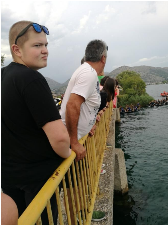
Slikovni prilog 6. Ulazak lađara u crnu rijeku na terenskom istraživanju provedenom 11. kolovoza 2018.

Određeni konflikt i sukob između samih lađara i ekipa se stvaraju tijekom same utrke, posebice u dijelu rute na crnoj rijeci. To je jedan jedini dio Neretve gdje može proći samo jedna lađa, te najčešće dođe do sukoba između prve dvije ekipe od kojih jedna treba propustiti drugoj da prođe taj dio rijeke. Dosad je dolazilo i do fizičkih sukoba kada su se lađari udarali veslima i gurali ne bi li prvi ušli u tok crne rijeke. To je sam ulazak u crnu riku ispod mosta, ispod kojeg može proći samo jedna lađa, i najčešće je ona koja tu uđe prva i pobjednik maratona, iako to nije uvijek slučaj.