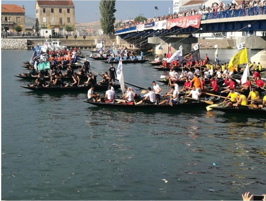
Slikovni prilog 1. Fotografija starta maratona lađa s terenskog istraživanja provedenog 11. kolovoza 2018.

Tada sam bila samo pasivni sudionik koji je slušao povike i komentare navijača te sam uz to naravno i fotografirala i te fotografije ću priložiti u dodacima uz fotografije koje su mi ustupili sugovornici. Kao što je već navedeno, na maratonu lađa sam bila više puta te sam također koristila utiske i s ostalih maratona, uključujući i ovogodišnji maraton za koji sam vodila bilješke o onome što se pričalo na radiju ali i bilješke o komentarima iza same utrke.