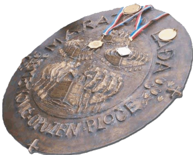
Slikovni prilog 3. Štit kneza Domagoja

Što je onda maraton lađa, kada i kako se održava? Maraton lađa je natjecanje koje se održava svake godine u kolovozu na relaciji Metković – Ploče dužoj 25 kilometara. Maraton se održava drugu subotu u kolovozu, osim prvog maratona, koji se održao u nedjelju 1998. godine (usp. Udruga lađara Neretve 7 ). Kako se lađa ne bi zaboravila grupa iz Vida je lađom veslala rijekom Norin i Neretvom, a njih je pratio i osnivač maratona lađa Milojko Glasović, ujedno i snimatelj i fotograf. On je došao na ideju maratona lađa kako lađa ne bi pala u zaborav te je on i osnivač maratona lađa. Prvi Maraton lađa održan je 13. rujna 1998. povodom obilježavanja sedme obljetnice akcije poznate pod imenom Zelena tabla – Male bare kojom je Hrvatska vojska preuzela vojarne JNA u Pločama (usp. Udruga lađara Neretve). 8 Po riječima Milojka Glasovića tu nedjelju je padala kiša sve do trena kada se maraton trebao veslati u 17 sati. Malo prije maratona je provirilo sunce i tako je ostalo cijelo natjecanje. Tijelo koje se bavi organizacijom maratona lađa je Udruga lađara Neretve, koja se sastoji od nekoliko udruga lađara. Kako se može pročitati na službenoj internetskoj stranici Udruge lađara Neretve prije maratona se svake godine održavaju brzinske utrke u Opuzenu, koje su borba za startne pozicije, te su ove brzinske trke uvelike značajne za prolazak same ekipe na maratonu. Skupina koja pobijedi na maratonu za nagradu dobiva štit kneza Domagoja, koji im se svečano uručuje na cilju u Pločama.