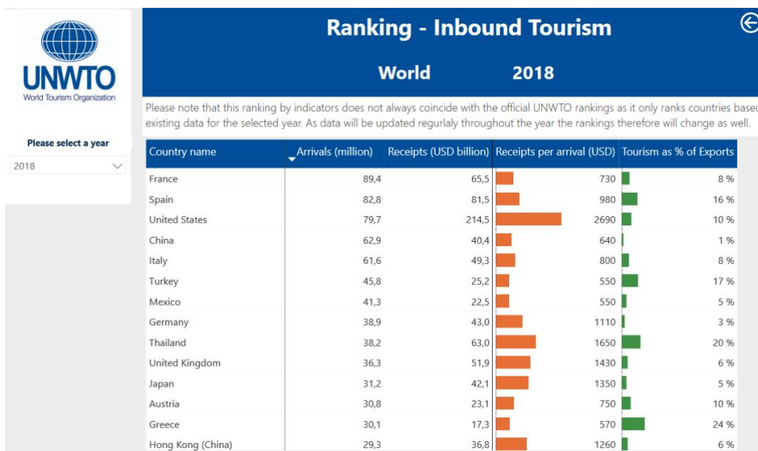
Slika 3. Rangiranje vodećih turističkih zemalja