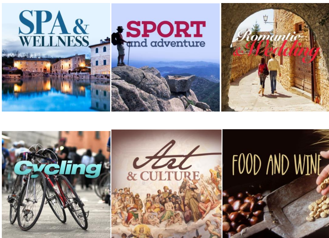
Slika 9. Proizvodi turističke destinacije Toskane

Toskana u svojim promocijama naglašava prirodne ljepote te bogati krajolik njezinih pokrajina, stoga se i cjelokupna ulaganja u marketing ove destinacije usmjeravaju prema njenim svjetski poznatim proizvodima. Regija Toskana se na svjetskim tržištima predstavlja kao jedinstvena marka. Razvoj proizvoda regije i promocija teritorijalno turističke ponude na svjetskim sajmovima i organiziranim događanjima stalna su djelatnost marketinga DMO-a ove regije. Slika 9. prikazuje 'proizvode' turističke destinacije Toskana koji su navedeni na njihovoj službenoj stranici visittuscany.com .