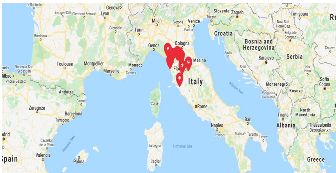
Slika 8. Gradovi regije Toscana