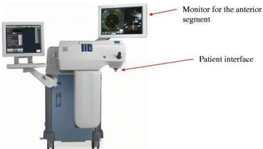
Slika 3. Femtosecond laser