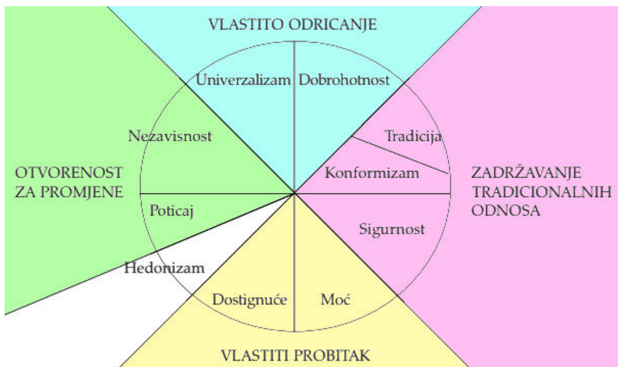
Slika 1. Schwartzova kružna struktura deset motivacijskih tipova vrijednosti.

postignuće, hedonizam, poticaj, nezavisnost, univerzalizam, dobrohotnost, tradicija, konformizam i sigurnost, pretpostavljajući da su tipovi povezani na motivacijskom kontinuumu tako da se slični podržavaju, a različiti koče i da su univerzalni jer se u tom obliku javljaju u svakoj osobi. Tipovi vrijednosti predstavljeni su s 56 pojedinačnih vrijednosti, od kojih je neke Schwartz preuzeo od Rokeacha, a neke od ostalih autora koji su se bavili vrijednostima. Odnos tipova vrijednosti može se predstaviti primjerice kompatibilnošću između vrijednosti postignuća i moći s obzirom na to da se oba tipa zasnivaju na uspjehu i dominaciji nad drugima, dok vrijednosti postignuća koče vrijednosti dobrohotnosti zbog konflikta između brige za sebe i druge. Iz ovog proizlazi sklop svih tipova vrijednosti u kružnu strukturu vrijednosnog sustava (slika 1).