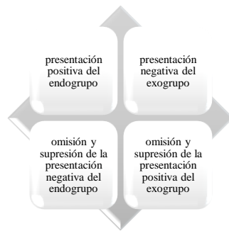
Gráfico 2. Cuadro ideológico (van Dijk, 1998)

describen actores individuales, se describen los participantes que actúan como miembro de un cierto grupo (ibidem). Los discursos unilaterales describen detalladamente actos malos de los Otros y actos buenos de Nosotros, además dejan información clave implícita sobre los grupos (ibidem). Siempre hay el contraste entre Nosotros y Ellos, lo que da como resultado la inclusión y la exclusión, respectivamente. Las estrategias discursivas que pueden ayudar a la construcción positiva o negativa son: la semántica, la argumentación, las figuras retóricas, el léxico, las historias personales... (van Dijk, 1993)