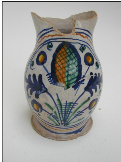
Slika 16 Vrč (Zbirka keramike, Muzej grada Zadra)

Na Slici 16 prikazan je vrč zaveden pod inventarnim brojem MGZ-66 u Zbirci keramike odjela Muzej grada Zadra, Narodnog muzeja Zadar.