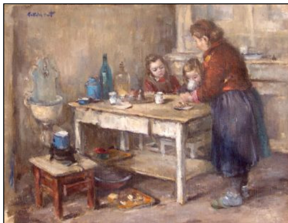
Slika 15 Umjetnička slika Doručak (Zbirka suvremene umjetnosti, Galerija umjetnina)

Na Slici 15 prikazana je umjetnička slika Doručak koja je zavedena pod inventarnim brojem GU-45 u Zbirci suvremene umjetnosti Galerije umjetnina, Narodnog muzeja Zadar.