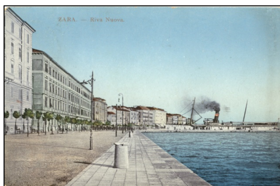
Slika 19 Razglednica Zadra (Zbirka razglednica, Muzej grada Zadra)

Na Slici 19 prikazana je razglednica Zadra zavedena pod inventarnim brojem MGZ-1028 u Zbirci razglednica odjela Muzej grada Zadra, Narodnog muzeja Zadar.