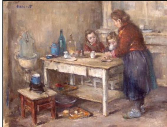
Slika 15 Umjetnička slika Doručak (Zbirka suvremene umjetnosti, Galerija umjetnina)

Na Slici 15 prikazana je umjetnička slika Doručak koja je zavedena pod inventarnim brojem GU-45 u Zbirci suvremene umjetnosti Galerije umjetnina, Narodnog muzeja Zadar.