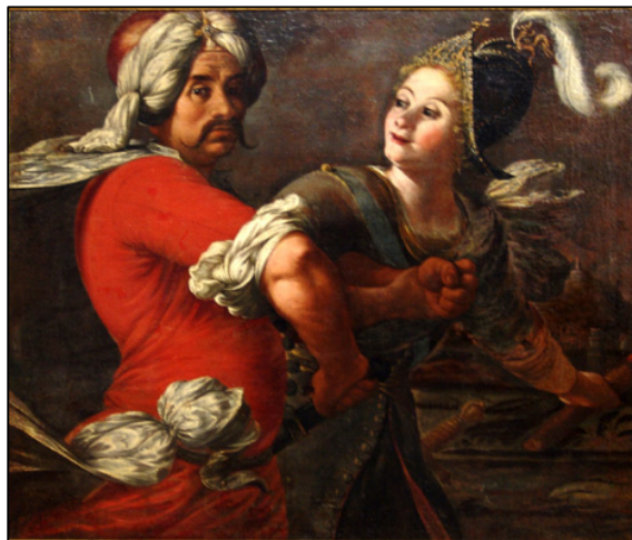
Slika 14 Umjetnička slika Prizor iz Tassovog spjeva (Zbirka starog slikarstva, Galerija umjetnina)

Na Slici 14 prikazana je umjetnička slika Prizor iz Tassovog spjeva - XII. pjevanje zavedena pod inventarnim brojem GU-31 u Zbirci starog slikarstva Galerije umjetnina, Narodnog muzeja Zadar.