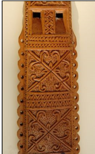
Slika 11 Dvojnice (Zbirka muzičkih instrumenata, Etnološki odjel)

Napomena o povijesti jedinice građe: original