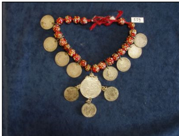
Slika 12 Đerdan (Zbirka nakita, Etnološki odjel)

Na Slici 12 prikazana je ženska ogrlica - đerdan zavedena pod inventarnim brojem EO-559 u Zbirci nakita Etnološkog odjela, Narodnog muzeja Zadar.