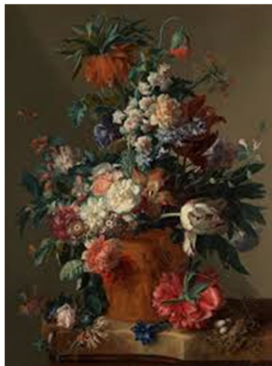
Slika 1 Vase of flowers, Jan van Huysum (1682-1749) 29

funkcionalan opis važno je da katalogizator jasno razumije sve parametre onoga što opisuje. CCO objašnjava jasnu razliku između djela (eng. work) i slike (eng. image) jer se za opis i dokumentiranje djela i slike nerijetko koriste isti elementi opisa što kasnije prilikom pretraživanja korisnicima može biti zbunjujuće, a može utjecati i na točnost rezultata pretraživanja. Prema CCO djelo je umjetnička ili intelektualna kreacija, predmeti ili strukture, likovni radovi i kulturni artefakti dok je slika vizualni prikaz djela najčešće u digitalnom obliku (npr. fotografija). Drugi ključni moment kada je u pitanju stvaranje funkcionalnog opisa je pitanje koliko i koje informacije mora sadržavati kataložni opis. U ovom slučaju CCO preporučuje da minimalan opis mora sadržavati većinu ako ne i sve temeljne elemente opisa kad god je to moguće. 28