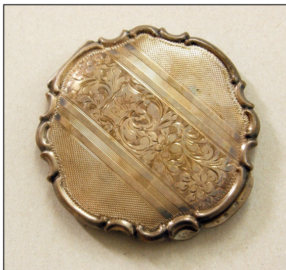
Slika 9 Srebrna pudriera (Zbirka razno, Muzej grada Zadra)

Ovi elementi opisa odabrani si iz razloga jer su u postojećim opisima preuzetima iz M++ programa unesene vrijednosti za navedena polja. Ostali elementi među kojima i oni koji su primjenjivi na opis muzejskih predmeta su izostavljeni kako se opisivanjem ne bi utjecalo na točnost podataka. Korištenjem navedenih elemenata prilikom izrade opisa sukladno AKM pravilniku dokazat će se njegova primjenjivost. Elementi za identifikaciju vremenskog raspona u radu su prikazani na razini skupine jer u verziji AKM pravilnika od 9. rujna 2019. godine nisu uvršteni navedeni elementi.