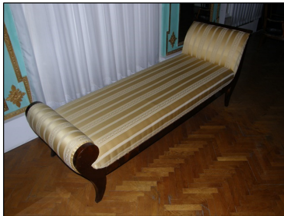
Slika 17 Ležaljka (Zbirka namještaja, Muzej grada Zadra)

Napomena o povijesti jedinice građe: Prilikom kopanja temelja za novogradnju nađeni su brojni keramički fragmenti. (na terenu nekadašnje kuće Filippi, tj. između I. L. Ribara i Riječke ulice)