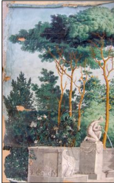
Slika 13 Zidni pano (Zbirka umjetnosti XIX. i XX. st., Galerija umjetnina)

Na Slici 13 prikazan je zidni pano zaveden pod inventarnim brojem GU-MGZ-2359/3 u Zbirci umjetnosti XIX. i XX. st. (do 1945. g.) Galerije umjetnina, Narodnog muzeja Zadar.