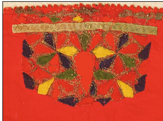
Slika 10 Zalistavac (Zbirka nošnji, Etnološki odjel)

Na Slici 10 prikazan je zalistavac, prsna aplikacija na narodnoj nošnji zavedena pod inventarnim brojem EO-23 u Zbirci nošnji Etnološkog odjela, Narodnog muzeja Zadar.