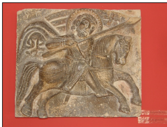
Slika 18 Reljef sv. Krševana (Zbirka kamenih lapida, Muzej grada Zadra)

Na Slici 18 prikazan je reljef sv. Krševana zaveden pod inventarnim brojem MGZ-359 u Zbirci kamenih lapida odjela Muzej grada Zadra, Narodnog muzeja Zadar.