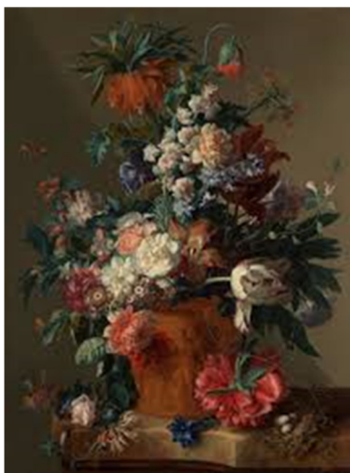
Slika 1 Vase of flowers, Jan van Huysum (1682-1749) 29

funkcionalan opis važno je da katalogizator jasno razumije sve parametre onoga što opisuje. CCO objašnjava jasnu razliku između djela (eng. work) i slike (eng. image) jer se za opis i dokumentiranje djela i slike nerijetko koriste isti elementi opisa što kasnije prilikom pretraživanja korisnicima može biti zbunjujuće, a može utjecati i na točnost rezultata pretraživanja. Prema CCO djelo je umjetnička ili intelektualna kreacija, predmeti ili strukture, likovni radovi i kulturni artefakti dok je slika vizualni prikaz djela najčešće u digitalnom obliku (npr. fotografija). Drugi ključni moment kada je u pitanju stvaranje funkcionalnog opisa je pitanje koliko i koje informacije mora sadržavati kataložni opis. U ovom slučaju CCO preporučuje da minimalan opis mora sadržavati većinu ako ne i sve temeljne elemente opisa kad god je to moguće. 28