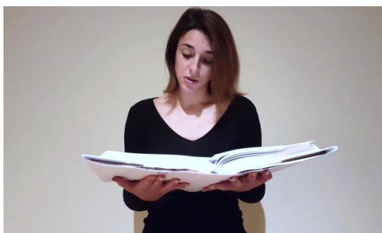
Slika 1. Ženski model u videozapisu

prekidi dovoljno dugi za glatki prijelaz s jednog dijela priče na drugi, a dovoljno kratki da se ne izgubi nit prateći priču. Tijekom čitanja, unutar svake minute je prikazana gradacija mreškanja nosa modela kroz pet točki, pri čemu je u prvoj točki model činio kratki i lagani pokret mreškanja nosa, a u petoj intenzivno i duže mreškanje. Čitavo vrijeme je model u rukama držao veliku knjigu iz koje je čitao priču (Slika 1 i 2). U drugom videozapisu je istu radnju obavljao muški model, uz iznimku čitanja priče "Bremenski gradski svirači". Modeli su, osim po spolu, odabrani i s obzirom na godine. Imajući u vidu prethodno spomenutu mogućnost poistovjećivanja s modelom po nekoj karakteristici, bilo je bitno odabrati modele koji su unutar dobnog raspona predviđenog uzorka, stoga oboje imaju 22 godine. Pri snimanju je bilo nužno voditi računa o mogućim vizualnim i auditornim distraktorima u videozapisu. Iz tog razloga su oba modela nosila običnu crnu majicu, stojeći ispred praznog bijelog zida i čitajući iz knjige čije su korice bile obložene bijelim papirom. Nije bilo nikakvih zvučnih smetnji koje su trebale biti izolirane. Izrađene su dvije verzije konačnog videozapisa, ovisno o tome je li prvo prikazan muški ili ženski model, kako bi se uravnotežili eksperimentalni uvjeti. Stoga, videozapis ženskog i videozapis muškog modela predstavljaju različite eksperimentalne situacije, u sveukupnom trajanju od 12 minuta.