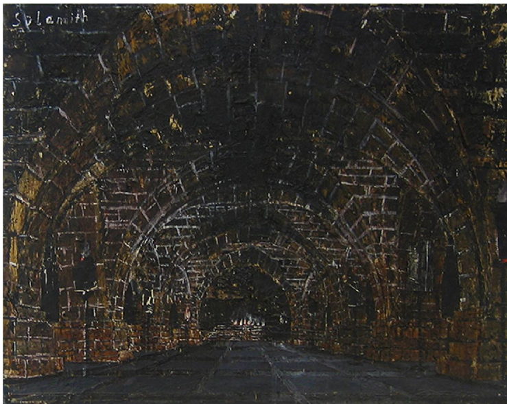
Slika 4: Kiefer, Anselm, Shulamite , 1983.

https://www.independent.co.uk/arts-entertainment/art/great-works/margarete-1981-by-anselm-kiefer-saatchi-collection-970630.html (posljednji pristup: 20. rujna 2019.)