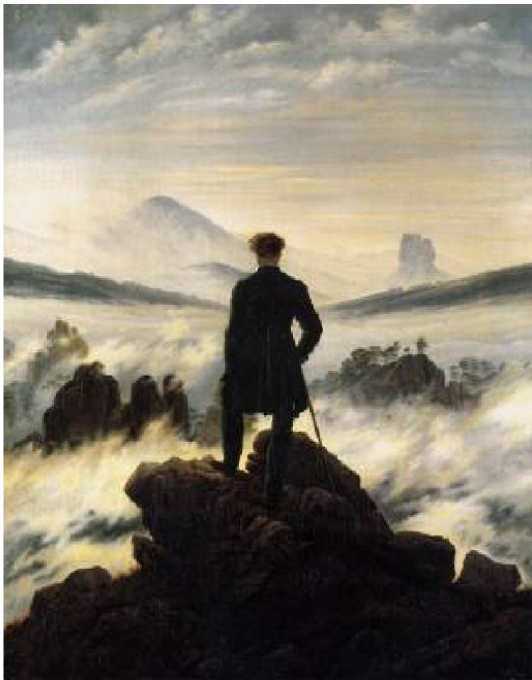
Slika 1: Friedrich, Caspar David, The wanderer above the Mists , 1817-18.

https://www.wga.hu/frames-e.html?/html/f/friedric/2/209fried.html (posljednji pristup: 20. rujna 2019.)