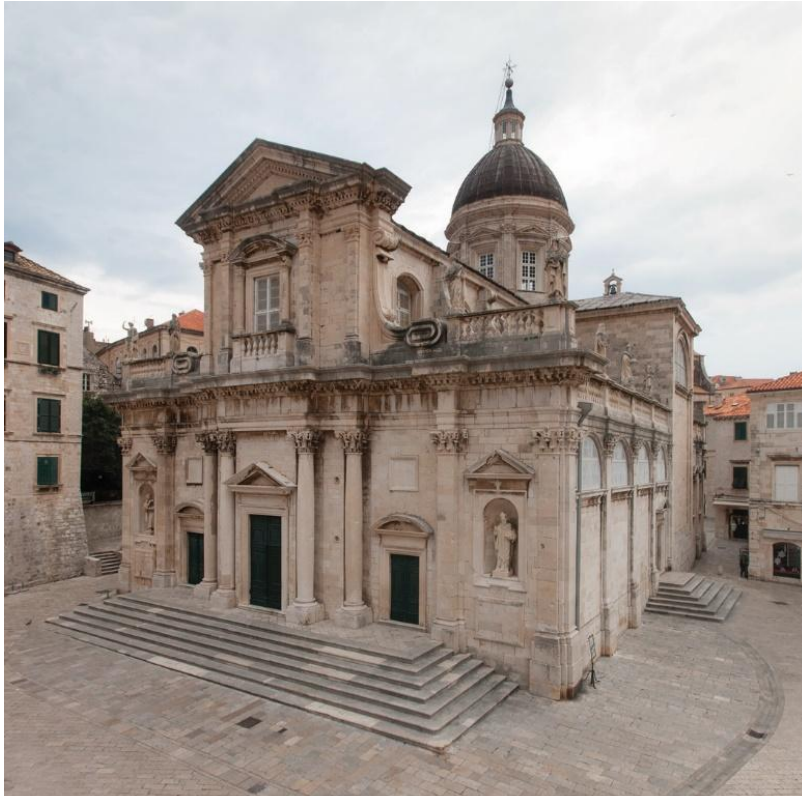
Slika 5. Pogled na pročelje katedrale