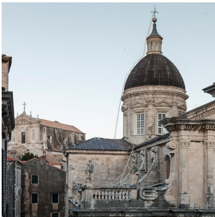
Slika 10. Pogled na kupolu katedrale