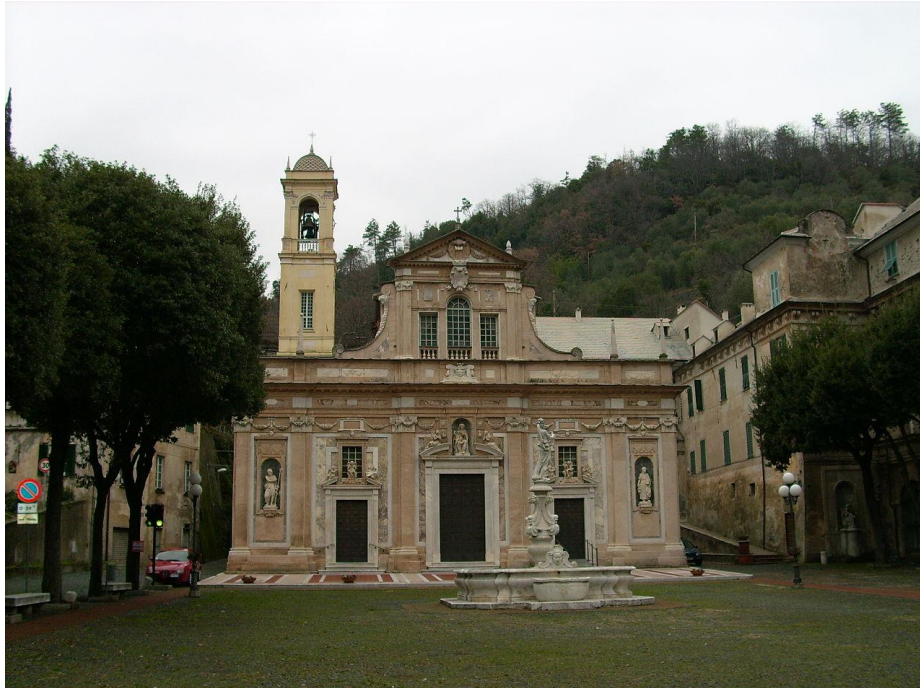
Slika 7. Pogled na pročelje crkve Nostra signora della Misericordia u Savoni