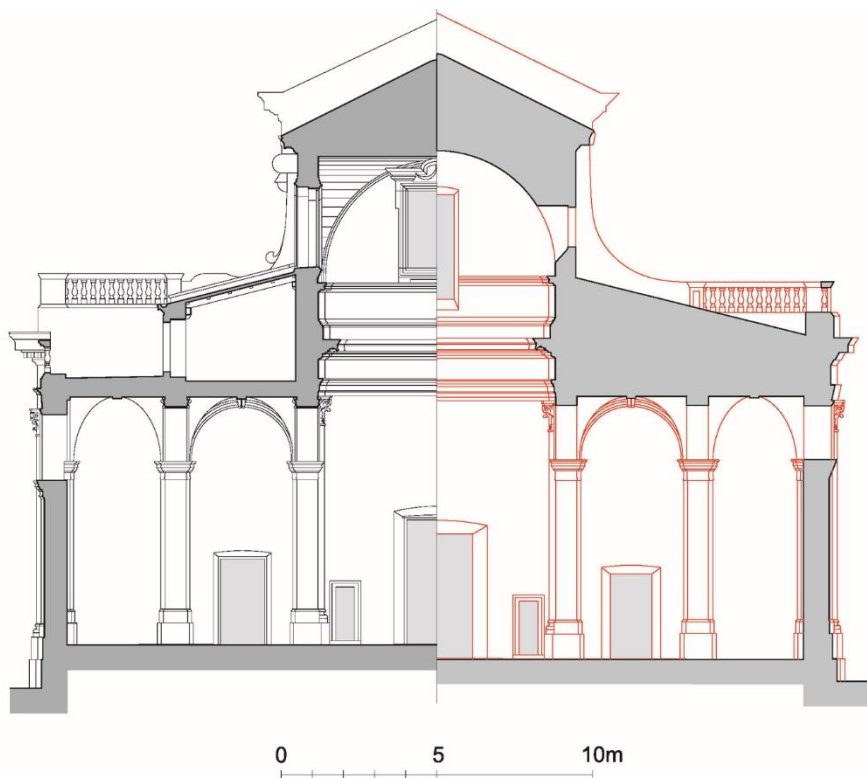
Slika 4. Usporedba presjeka konačne izvedbe (lijevo) i izvornog projekta (desno), (izvor: KATARINA HORVAT-LEVAJ – K. HORVAT-LEVAJ 2015b, 17.)