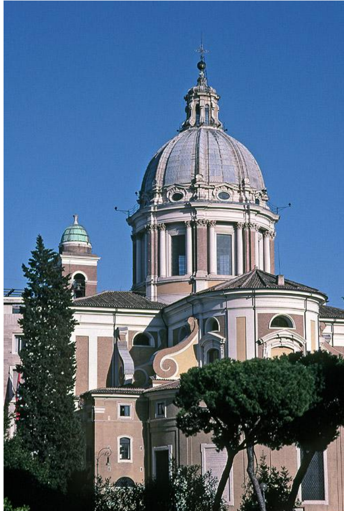
Slika 11. Pogled na kupolu crkve San Carlo al Corso