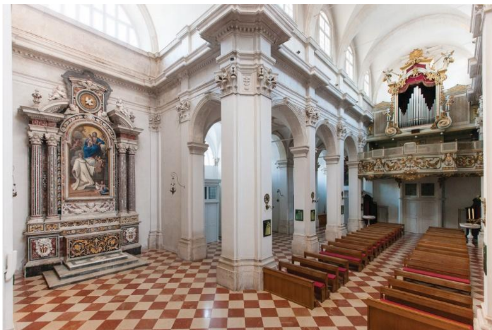
Slika 3. Pogled na glavni brod i transept dubrovačke katedrale