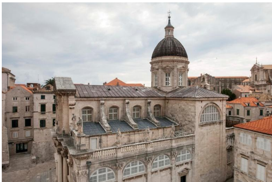
Slika 8. Pogled na sjevernu stranu katedrale