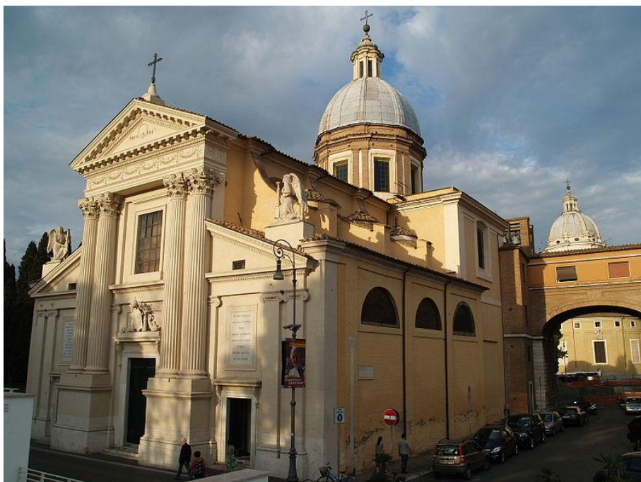
Slika 9. Pogled na vanjsko oplošje crkve San Rocco all' Augusteo