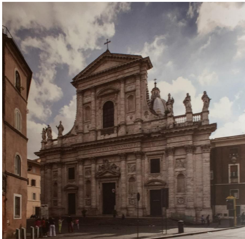
Slika 6. Pogled na pročelje crkve San Giovanni dei Fiorentini u Rimu