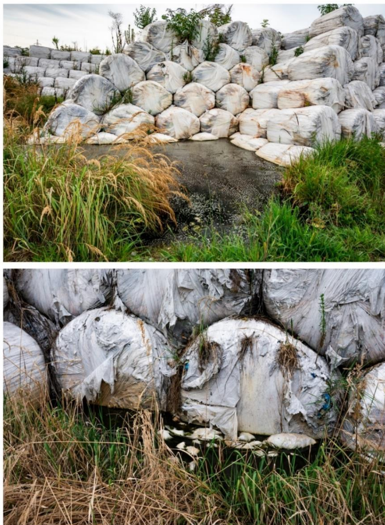
Slika 2. Prikaz procjednih voda na lokaciji Brezje.

(Elaborat zaštite okoliša, 2015: 13). Eluat, odnosno procjedna voda s odlagališta otpada je onečišćena tekućina koja se procijedila kroz slojeve baliranog otpada. „Svi otpaci odloženi u tijelu deponija, stvarat će veće ili manje količine procjednih voda, ovisno o količini vode koja ulazi u tijelo deponija“ (Milanović, 1992: 41). Procjedne vode uglavnom utječu duži vremenski period na podzemne vode. Podzemna voda koje je jednom onečišćena organskim tvarima i anorganskim spojevima može biti neupotrebljiva kao izvor pitke vode kroz duži vremenski period (Milanović, 1992). Zagađena podzemna voda sadrži nedopuštene količine koliformnih i patogenih bakterija, kao i cijanida te soli teških metala (Baraćić i Ivančić, 2010). Dakle, kao praktični problemi svakog deponija ističu se onečišćenost podzemnih voda procjednim deponijskim vodama i onečišćenost površinskih voda deponijskim vodama (Milanović, 1992).