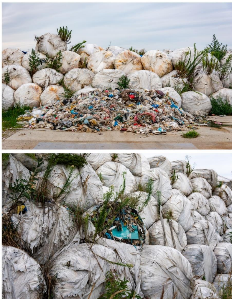
Slika 1. Prikaz mehaničkog oštećenja bala na lokaciji Brezje.

Miješani komunalni i neopasni otpad se na ovoj lokaciji obrađivao i skladištio od 2005. do 2013. godine. Lokacija, koja se prostire na 5,26 ha nije uređena za odlaganje otpada. Od ukupne površine odlagališta, 3,7 ha zauzima balirani otpad. Potrebno je istaknuti kako se na lokaciji nalazi 99.355,73 tona otpada, odnosno oko 125 000 bala grupiranih u 12 blokova s obzirom na godinu skladištenja (Elaborat zaštite okoliša, 2015). Također, potrebno je napomenuti kako su bale pohranjene na armiranobetonskoj i asfaltiranoj podlozi, ali zbog potrebe proširenja, dio se nalazi na zbijenom šljunku na geotekstilu (EcoMission d.o.o., 2018).