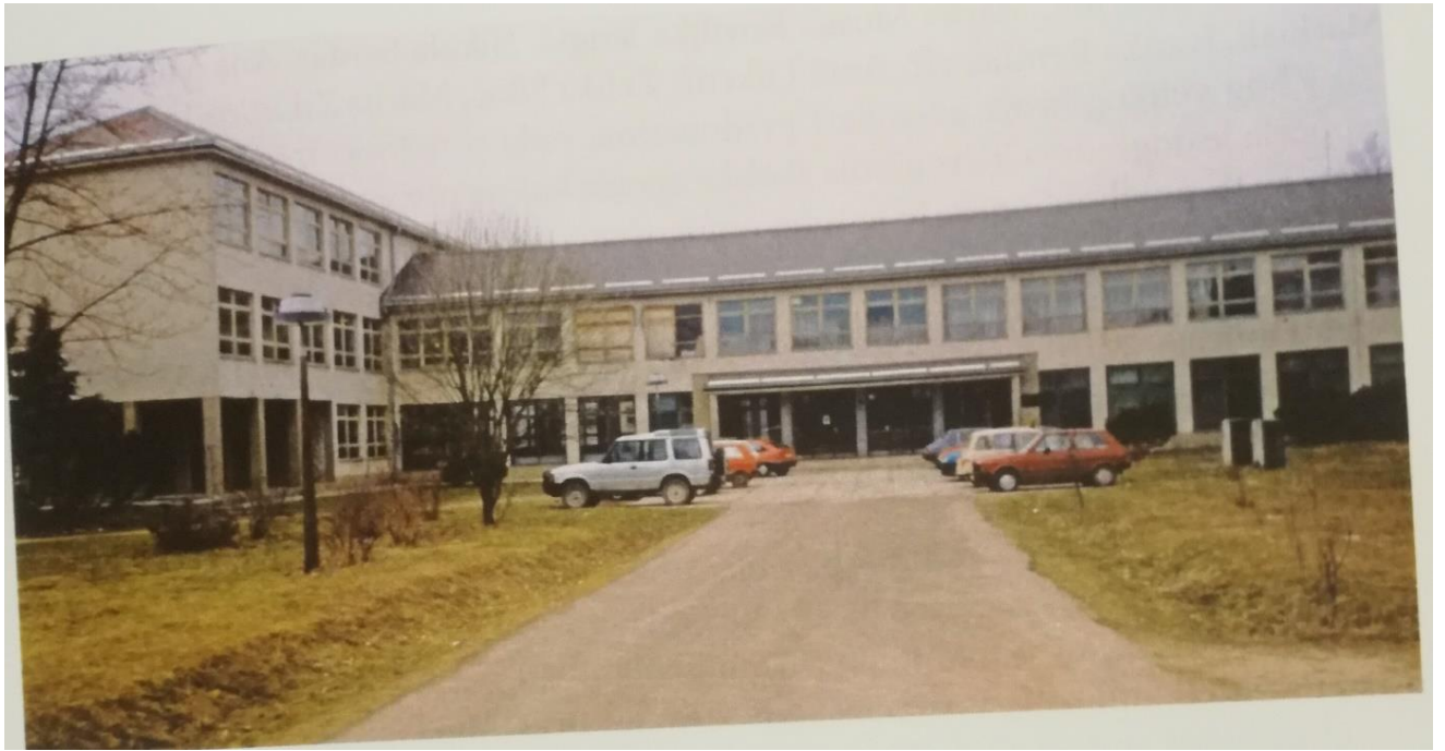
Slika 3. OŠ dr. Jure Turića