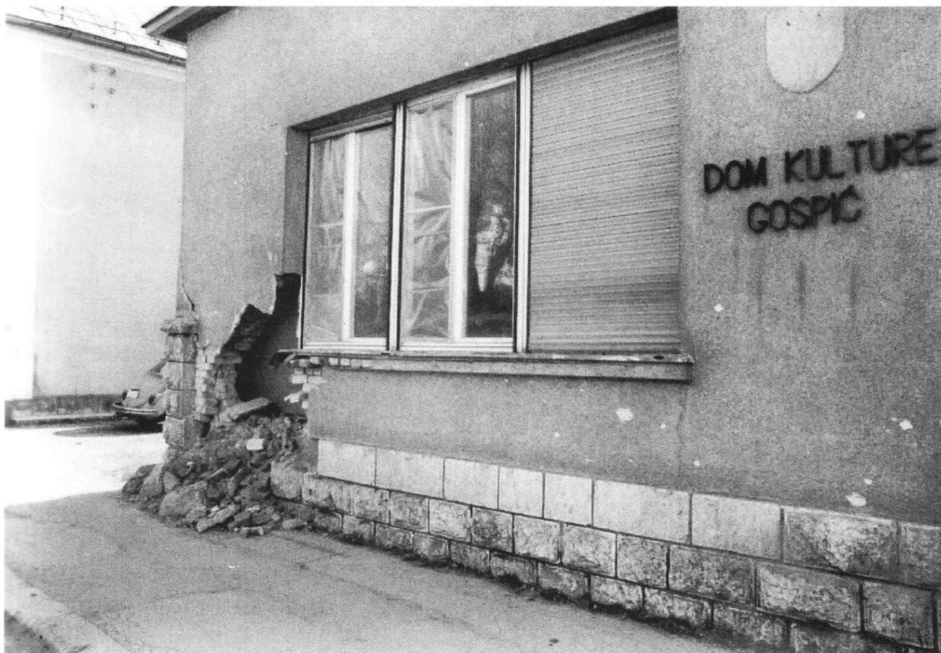
Slika 2. Gradska knjižnica Gospić

od 60 000 knjižnih jedinica i 4000 audio i video zapisa u odnosu na prijeratnih 23 771 svezak knjiga.