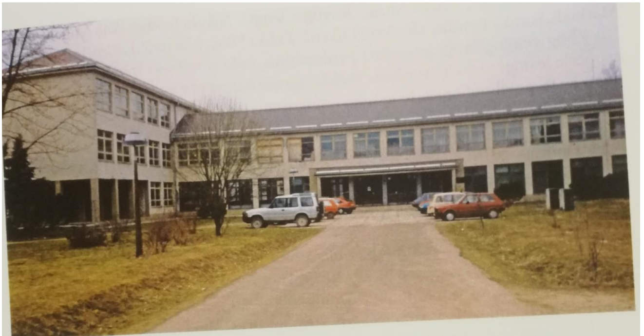
Slika 3. OŠ dr. Jure Turića