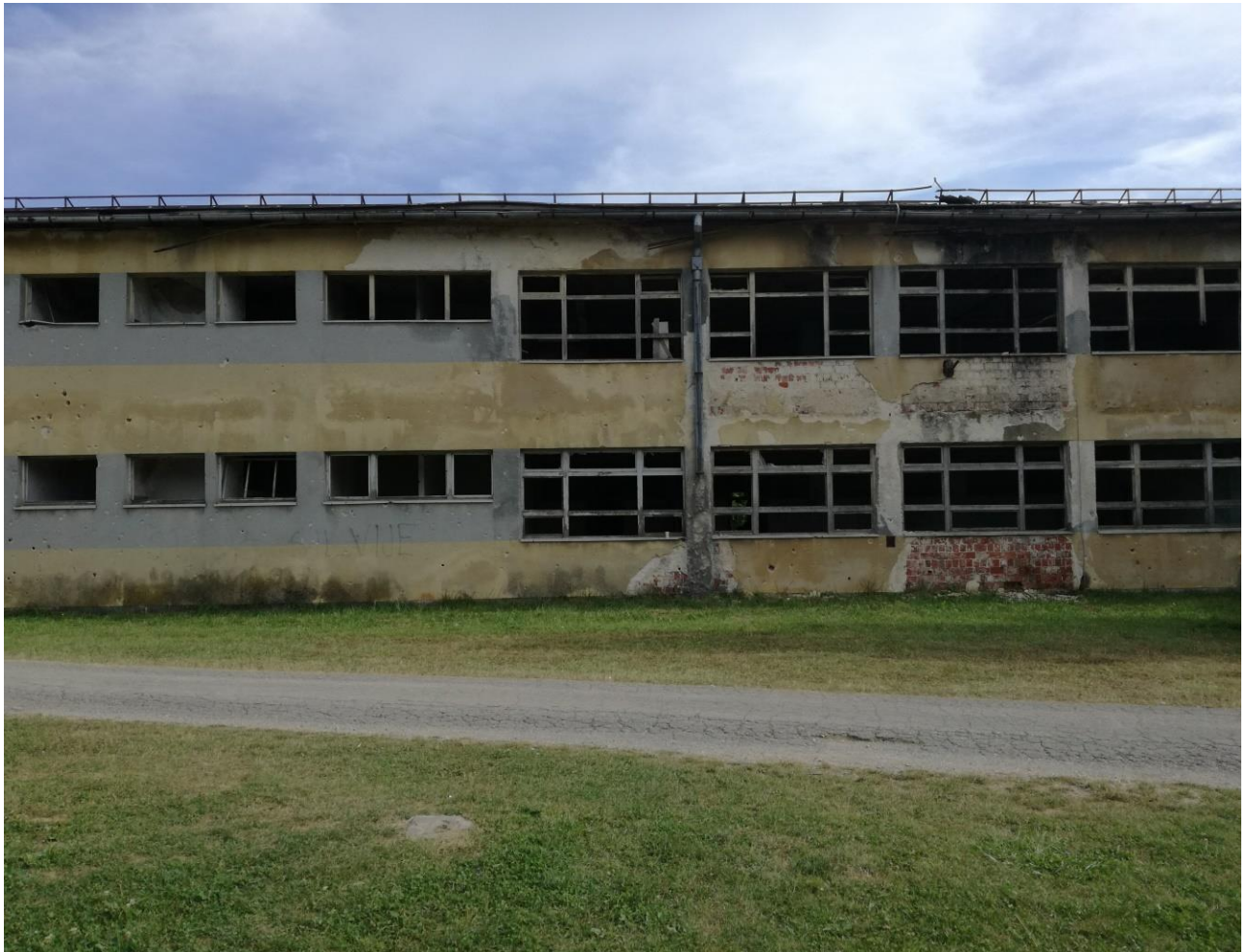
Slika 4. Srednjoškolski centar „Nikola Tesla“