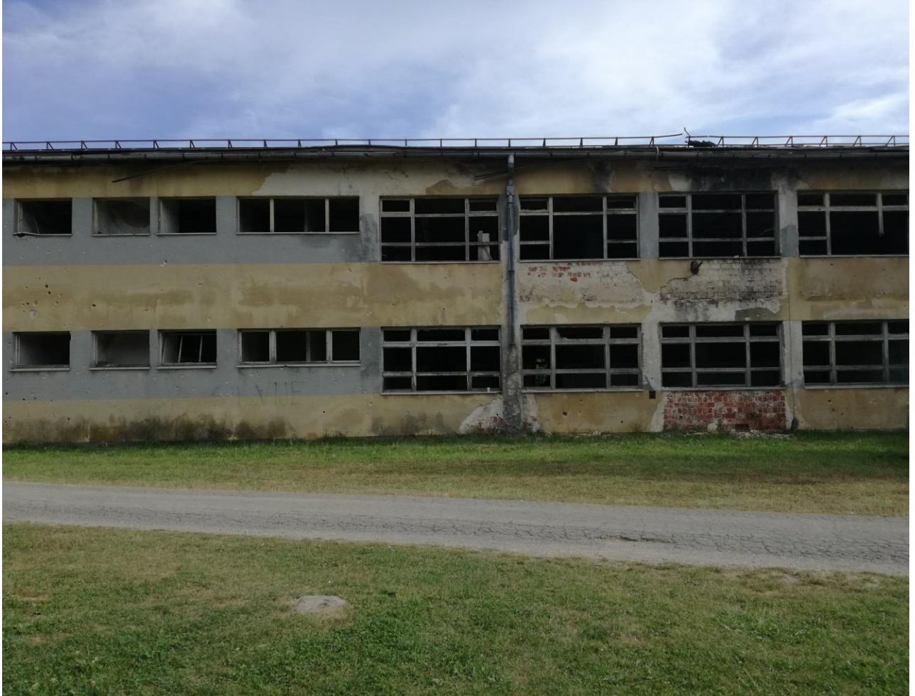
Slika 4. Srednjoškolski centar „Nikola Tesla“