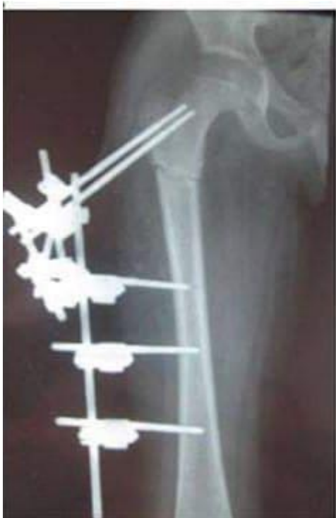
Slika 3. Rendgenski prikaz vanjske fiksacije zgloba kuka ( preuzeto sa: https://benthamopen.com/FULLTEXT/TOORTHJ-11-353/FIGURE/F1/ datum pristupa: 03.11.2018.)

Kod prijeloma kuka, pertrohanterni prijelom se liječi operacijski. Zbog vrlo visoke dobi pacijenata potrebna je potpuna prijeoperacijska priprema koja zahtjeva specifična znanja i vještine. Vrsta osteosinteze se odabire na temelju oblika prijeloma, biološke starosti bolesnika te njegove pokretljivosti prije prijeloma. Najčešće se koriste implantanti koji omogućavaju stabilnost prijelomne pukotine: kutna ploča, dinamička kompresivna ploča, gama čavao i proksimalni ukrivljeni čavao. (10) Na slici 4 prikazana je rendgenska snimka postavljenog gama čavla. Dan nakon operativnog zahvata započinje se sa mobilizacijom pacijenta radi sprječavanja postoperativnih komplikacija i komplikacija dugotrajnog ležanja.