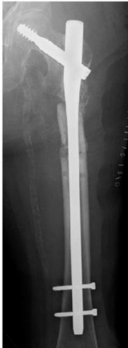
Slika 4. Rendgenski snimak postavljenog gama čavla u kuku ( preuzeto sa https://www.hindawi.com/journals/crim/2013/534570/fig2/ datum pristupa: 18.09.2018.)

Prijelom glave bedrene kosti se može liječiti konzervativno u slučajevima kada je ulomak malen, imobilizacijom sadrenim hlačicama 12-16 tjedna, dok se veći ulomci fiksiraju resorbirajućim vijcima. (2)