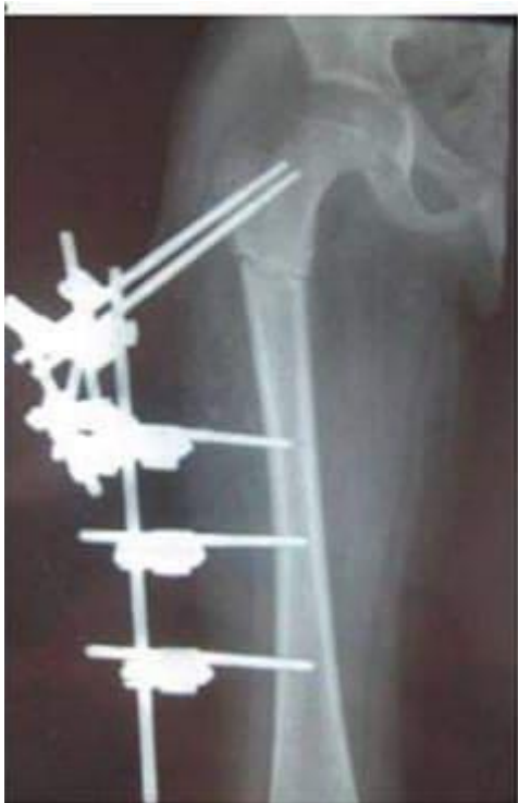
Slika 3. Rendgenski prikaz vanjske fiksacije zgloba kuka ( preuzeto sa: https://benthamopen.com/FULLTEXT/TOORTHJ-11-353/FIGURE/F1/ datum pristupa: 03.11.2018.)

Kod prijeloma kuka, pertrohanterni prijelom se liječi operacijski. Zbog vrlo visoke dobi pacijenata potrebna je potpuna prijeoperacijska priprema koja zahtjeva specifična znanja i vještine. Vrsta osteosinteze se odabire na temelju oblika prijeloma, biološke starosti bolesnika te njegove pokretljivosti prije prijeloma. Najčešće se koriste implantanti koji omogućavaju stabilnost prijelomne pukotine: kutna ploča, dinamička kompresivna ploča, gama čavao i proksimalni ukrivljeni čavao. (10) Na slici 4 prikazana je rendgenska snimka postavljenog gama čavla. Dan nakon operativnog zahvata započinje se sa mobilizacijom pacijenta radi sprječavanja postoperativnih komplikacija i komplikacija dugotrajnog ležanja.