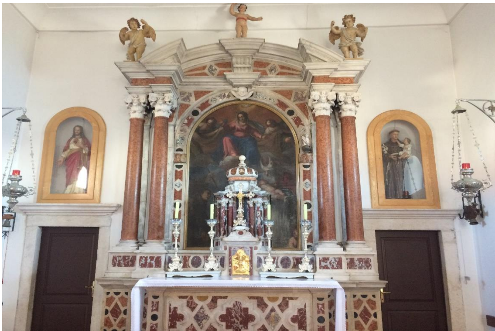
Slika 5. Glavni oltar u crkvi sv. Roka

Najstariji donedavno sačuvani oltar na južnom zidu potječe iz 1680. godine. Bio je sačuvan do Drugoga svjetskog rata, kada je miniranjem obale uništen. Danas su od njega ostali samo fragmenti. Oltar je bio posvećen apostolskim prvacima sv. Petru i Pavlu. Danas na njega podsjećaju dvije velike slike tih svetaca. Na oltaru je bila ugrađena i oltarna slika (pala), koja je devastiranjem oltara spaljena.