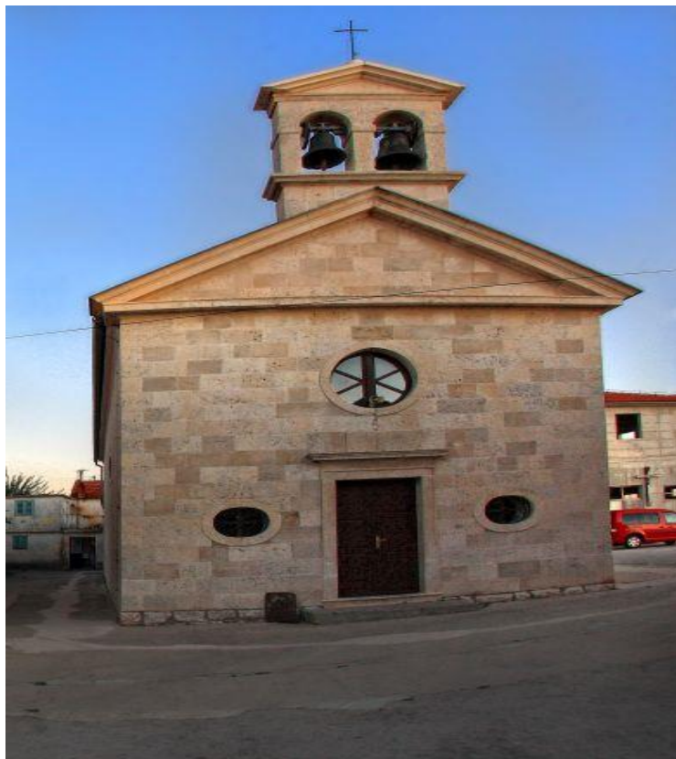
Slika 4. Crkva sv. Roka

Crkva sv. Roka je glavni simbol Bibinja. Nosi ime zaštitnika mjesta, sv. Roka , i sagrađena je njemu u čast u 16. stoljeću kada je vladala kuga, a on ih je sačuvao od te pošasti.