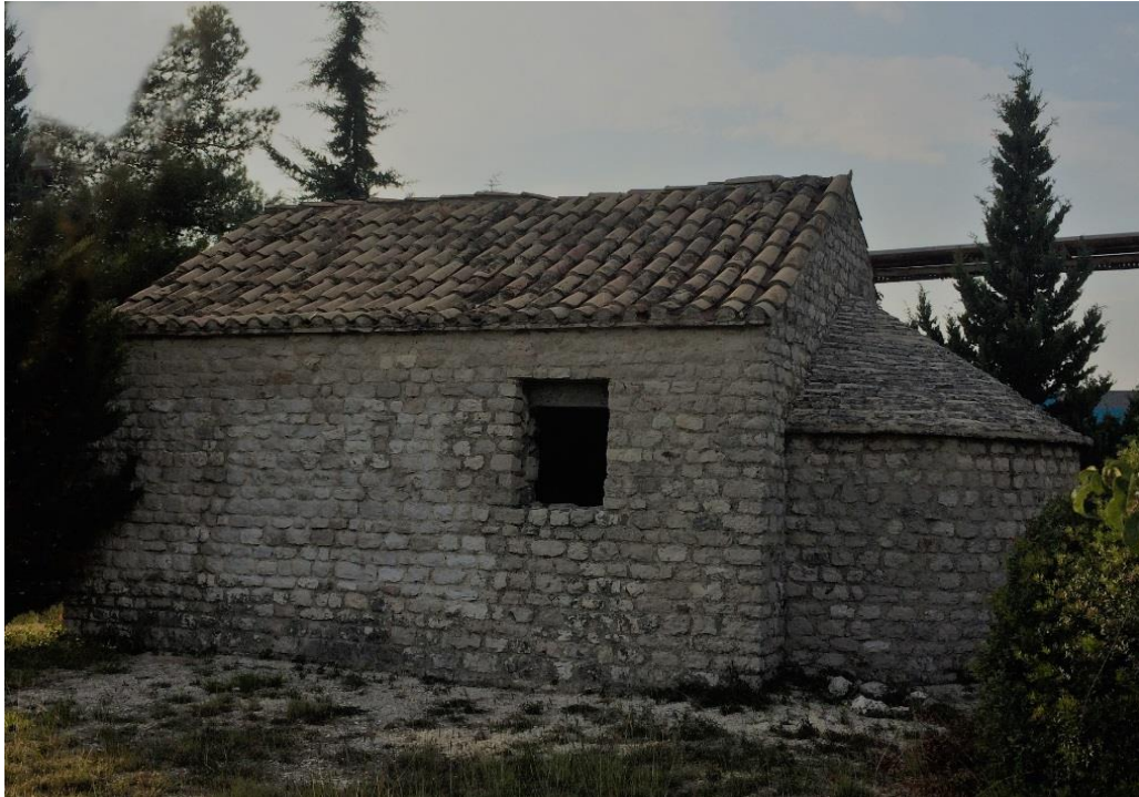
Slika 14. Crkva sv. Jelene