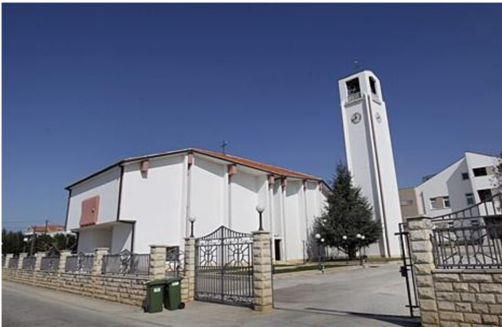
Slika 9. Crkva Uznesenja BDM