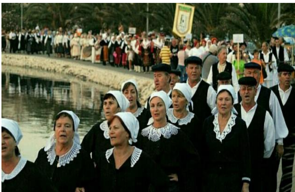
Slika 19. Povorka folklornih skupina

Već spomenuta folklorna skupina „Veseli Bibinjci“ nastupila je na mnogim folklornim smotrama u Zadarskoj županiji te su članovi skupine odlučili i u svojem mjestu organizirati „Večer folklor“. Tako je 13. kolovoza 2004. godine, u organizaciji KUD-a i uz financijsku i materijalnu pomoć Općine Bibinje, Turističke zajednice općine Bibinje i Zadarske županije, održana prva „Večer folklor“. Druženje započinje okupljanjem na Trgu dr. Franje Tuđmana u centru Bibinja odakle se, u svečanom mimohodu, svi sudionici pjesmom spuštaju do starog dijela Bibinja na Trg Sri Sela.