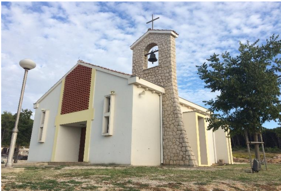
Slika 10. Crkva Svih svetih

Crkva Svih svetih izgrađena je na novome bibinjskome groblju koje se počelo graditi krajem osamdesetih godina 20. stoljeća zbog sve većeg broja stanovnika. Do tada je bilo dostatno staro groblje Kopošanat koje se nalazi na početku bibinjskoga poluotočica na kojem je smješteno današnje Staro selo. Novo groblje izgrađeno je iznad samog mjesta u podnožju brda Sasavac pa nosi isto ime. Odmah se javila potreba za crkvom na groblju Sasavac. Gradnja je pokrenuta i financirana od strane Općine Bibinje uz pomoć župnog ureda sv. Roka. Crkvu je projektirao isti arhitekt koji je radio projekt za crkvu Uznesenja BDM u Bibinjama, dipl. ing.