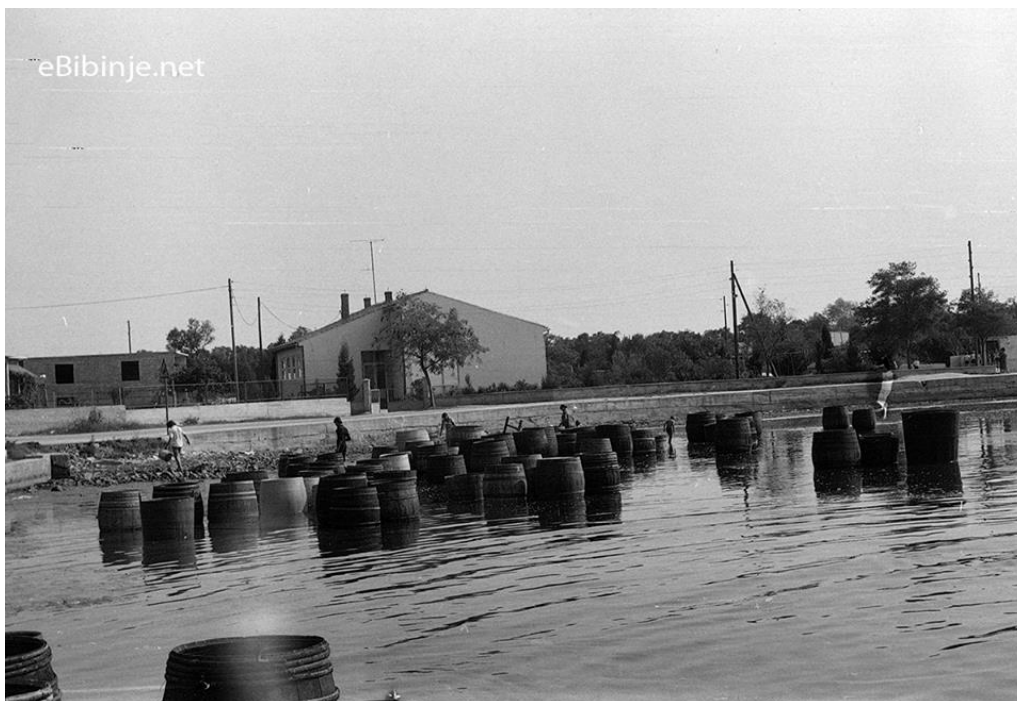
Slika 22. „ Stanjanje “ bačvi u moru u osamdesetima

što je nekad bilo da svaka obitelj ima svoj vinograd i da je u ranu jesen riva puna drvenih bačvi koje se „ stanjaju “ na obali uz more. Taj prizor me vraća u djetinjstvo, u doba kad smo svi odlazili u vinograde pliviti grožđe i brati u vreme od mošta .