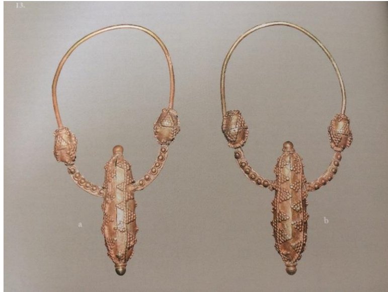
Slika 12. Zlatne naušnice sljepoočničarke

Na lokalitetu Petrina vršila su se arheološka istraživanja u više navrata, a zadnje je bilo 2014.godine koje je vodio dr.sc. Radomir Jurić. Pronađeni su mnogi predmeti u grobovima, a najznačajnije su zlatne naušnice sljepoočničarke. U Bibinjama su već prozване "bibinjske" naušnice. To su naušnice s okomito postavljenom bademastom ili ovalnom jagodom i dvije bočne manje jagode.