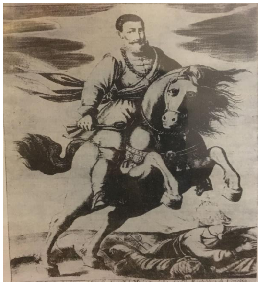
Slika 1. Don Stipan Sorić – bakrorez iz 17. stoljeća

obranu od Turaka pa je don Stipan svoja umijeća i hrabrost iskoristio za obranu domovine i naroda. On je pod krinkom pastoralnog rada u ravnokotarskim župama špijunirao tursku vojsku i prikupljao informacije te surađivao s Mlečanima. Također je prebacivao ljude s turskoga na mletački teritorij. Prebacivao je katolike i pravoslavce, tzv. Morlake. Don Stipan je bio vođa i glavar svoje čete koja se sastojala od takvih prebjega. Slovi kao odlučan i hrabar ratnik s izvanrednim poznavanjem ratne strategije. Sudjelovao je u obrani Zadra i Šibenika i oslobođenju Klisa i mnogih mjesta u blizini Knina. Poginuo je 1648. godine mučeničkom smrću u borbama kod Ribnika u Lici. Porazom kod Ribnika u Lici Mletačka Republika je izgubila dva čovjeka koji su bili vođe naroda i koji su bili ključni izvršitelji planova Republike – don Stipana Sorića i Petra Smiljanića.