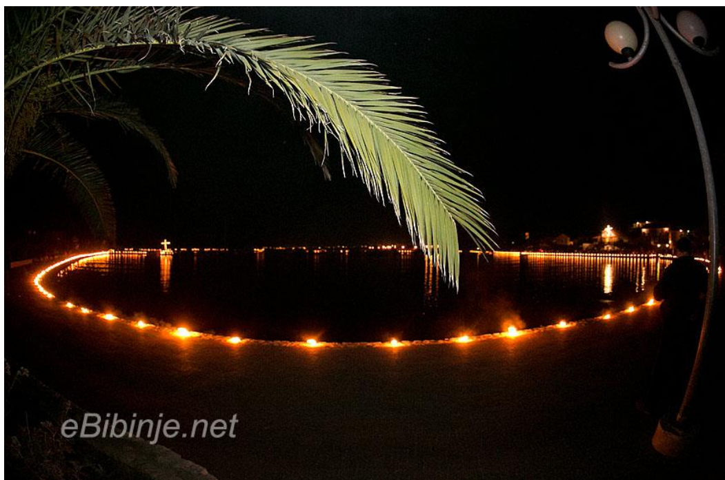
Slika 2. Detalj s procesije Velikoga petka u Bibinjama

Procesija Velikog Petka jedinstveni je događaj koji privlači mnoge vjernike iz cijele Hrvatske i svi se slažu da je to nezaboravan doživljaj.