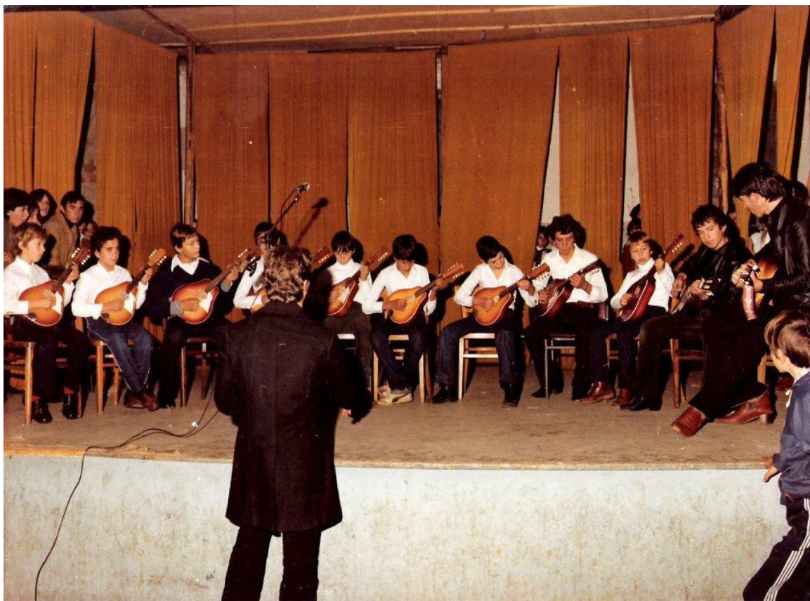
Slika 21. Nastup mandolinskog ansambla „Moba“ osamdesetih