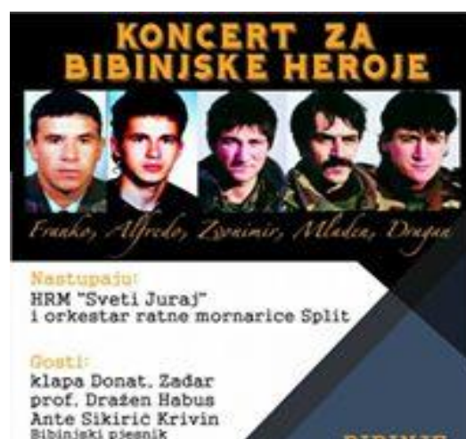
Slika 30. Plakat za koncert