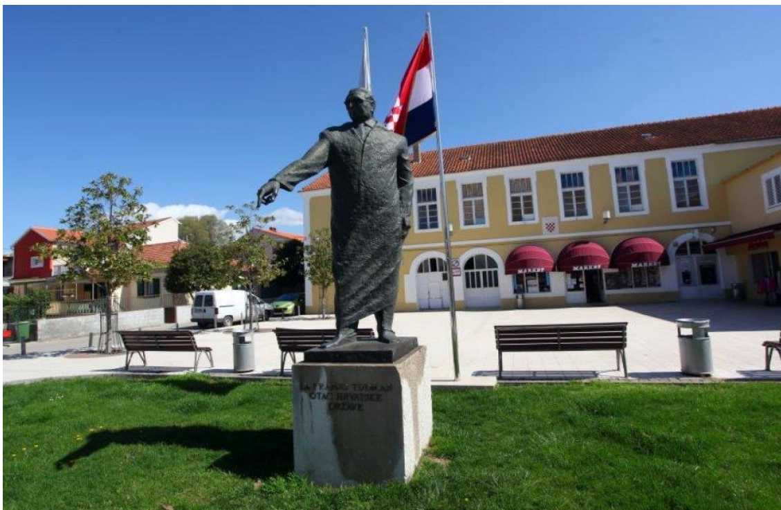
Slika 16. Spomenik dr. Franji Tuđmanu u Bibinjama

Od spomenika, Bibinje ima samo nekoliko iz novije povijesti. Jedan se nalazi na centralnom bibinjskom trgu, a podignut je u čast prvog hrvatskog predsjednika dr. Franje Tuđmana te trg i nosi njegovo ime. Podignut je 2007. godine povodom proslave Dana općine i djelo je mladog gospićkog akademskog kipara Petra Dolića. Brončani spomenik težak je jednu tonu, a visok 2.70 metara. Zajedno s kamenim postoljem doseže 4 metra visine. Trg je uređen po projektu arhitekta Eda Sandalića.