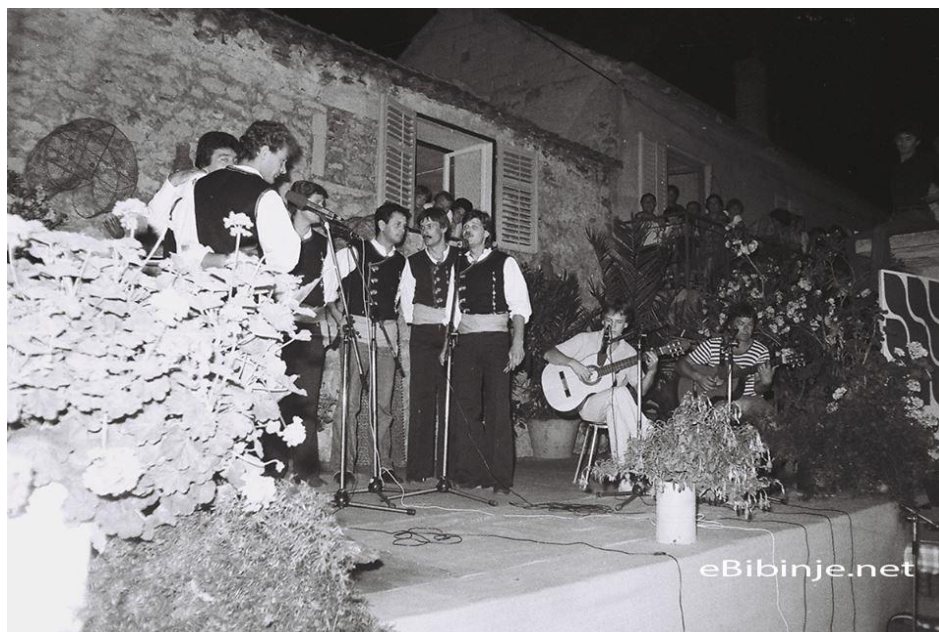
Slika 18. Susret klapa „Raspivano Bibinje“ osamdesetih (preuzeto sa ebibinje.net)

„Raspivano Bibinje“ je danas jedan od najvećih i najpoznatijih susreta klapa u Hrvatskoj te je čast sudjelovati na njemu.