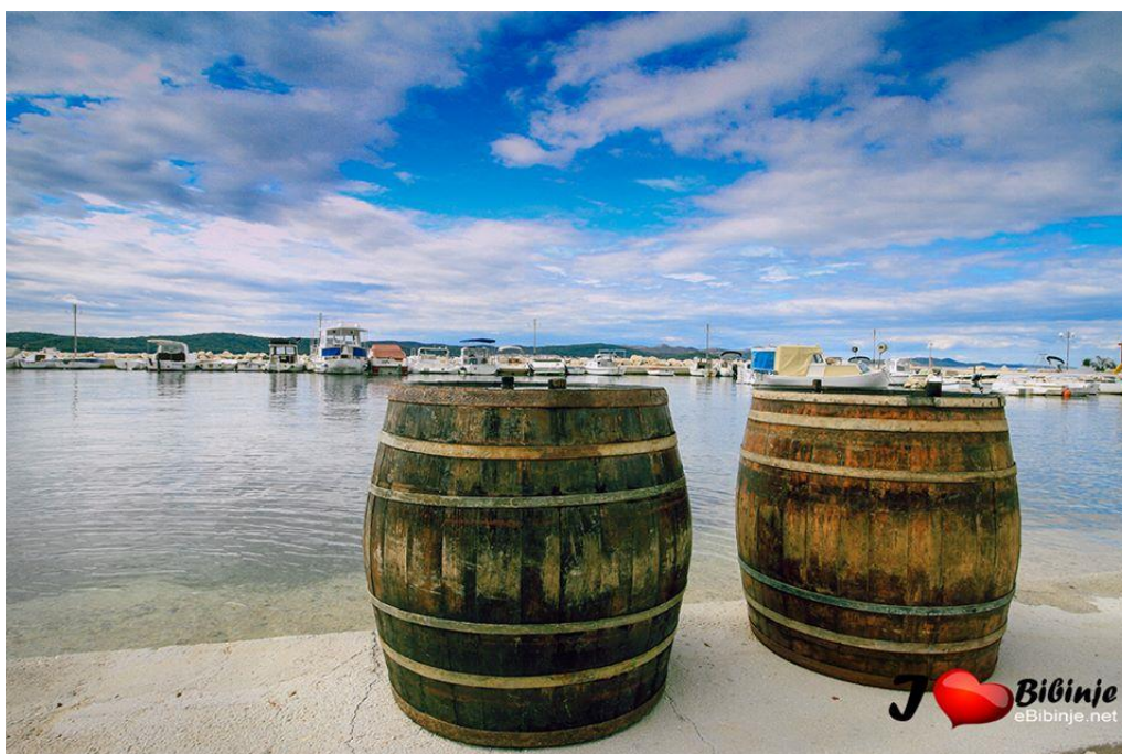
Slika 23. „ Stanjanje “ bačvi u današnje vrijeme