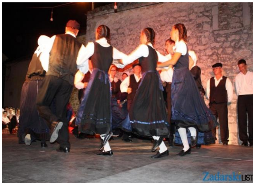
Slika 20. Bibinjsko kolo