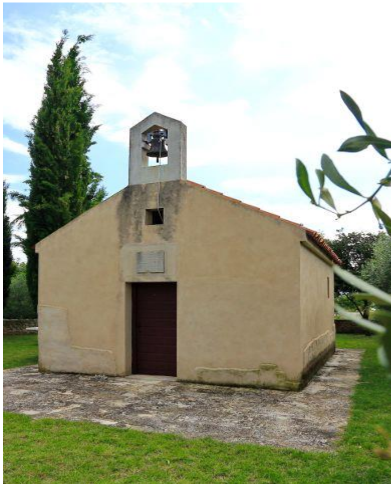
Slika 8. Crkva mučeništva sv. Ivana Krstitelja

O crkvici nema puno zapisa sve do 14. stoljeća. U razdoblju od 1356.-1358. godine, u vrijeme ratovanja Mletaka i hrvatsko-ugarskog kralja Ljudevita I., crkva je porušena. Obnovili su je benediktinci 1376. godine, a o tome svjedoči i kamena ploča s latinskim natpisom. Ta originalna ploča ne nalazi se, nažalost, na crkvi, već je uzidana nad seoskim vratima obližnjeg Sukošana. Kako je tamo dospjela ne zna se.