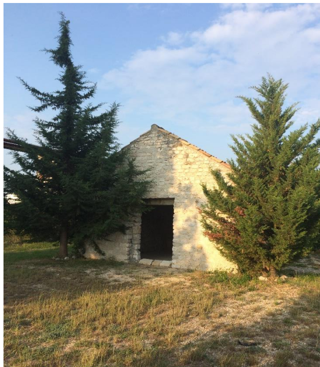
Slika 13. Pročelje crkve sv. Jelene

O crkvi sv. Jelene postoji jako malo zapisa i u principu se ne zna čija je to crkva bila i tko ju je sagradio. Katastarski pripada području Općine Bibinje i u novije vrijeme Bibinjci je svojataju kao svoju. Crkva sv. Jelene je srednjovjekovna crkvice, jednobrodna, s malom apsidom za oltar. Unutar apside su dvije male pravokutne niše. Osim jednog pravokutnog prozora na istočnom zidu, ne postoji više otvora. Izvana je crkva cijela u kamenu, a iznutra je samo apsida nadsvođena. Krov crkve leži na drvenim gredama, a zvonika nema. To je uistinu neobično, ali pretpostavlja se da je postojao prije selidbe crkve.