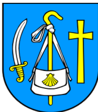
Slika 33. Grb Općine Bibinje

Bibinjski identitet je dobro prikazan u grbu Općine Bibinje. Grb sjedinjuje one tri stvari koje su Bibincima oduvijek bile važne – domoljublje, bogoljublje i čovjekoljublje.