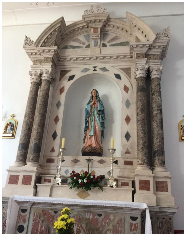
Slika 6. Oltar posvećen Bogorodici, crkva sv. Roka, Bibinje

Treći oltar posvećen je Blaženoj Djevici Mariji. Nekada je donji dio oltara bio u mramoru a gornji dio je bio drven i pozlaćen. Danas je oltar u cijelosti u mramoru. Na oltaru se nalazi lijepi drveni kip Bogorodice nabavljen na početku 20. stoljeća. Osim navedenih kipova, u crkvi se nalaze još dva kipa, jedan je kip zaštitnika sv. Roka, a drugi je kip sv. Josipa.