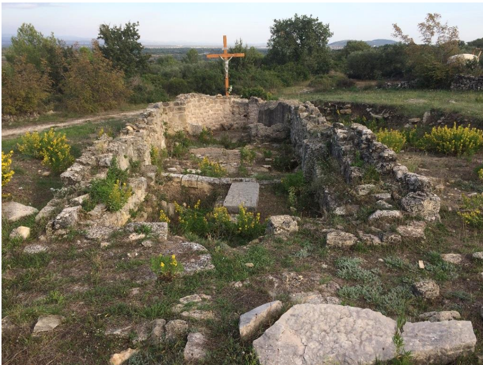
Slika 11. Ostaci crkve sv. Petra na lokalitetu Petrina

Ostaci crkve sv. Petra pronađeni su iznad Bibinja, u blizini brda Križ, na lokalitetu koje se danas zove Petrina. Nekada je to bilo srednjovjekovno naselje Stomorinoselo ili vila Ste. Marie odakle su se stanovnici tog naselja preselili u Bibinje, na poluotočić koji se danas naziva Staro selo i koji su već tada naseljavali Bibinjci. Kao razloge preseljenja neki izvori i narodna predaja navode pošast kuge a neki napade Turaka. Središte Stomorinasela bila je župna crkva sv. Petra iz 8. stoljeća za koju Luka Jelić 1898. godine kaže: "Crkva bijaše na jedan do osam metara dug brod, koji je svršavao okruglom apsidom. Preko sredine bijaše krov poduprt svodom, koji je nosio mali zvonik za jedno zvono; izvana odgovaraju svodu dva potpornjaka, koja odskakuju za jednu nogu. U ruševinama se našlo ulomaka po kojima se moglo suditi da je zgrada iz VIII. stoljeća. Ulomak nadvratnika od bijelog je kamena i s natpisom : et sotoi polites ot . Oko crkve je srednjovjekovno groblje sa stećcima, a na sjeveroistočnoj strani ruševine varoši Petrine."