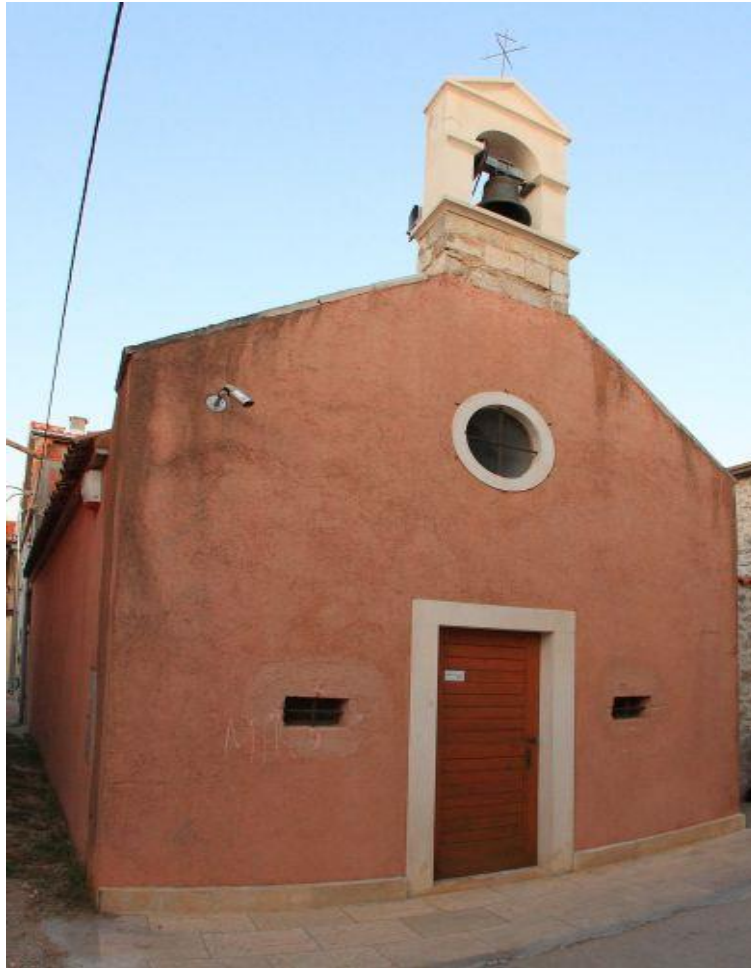
Slika 3. Crkva sv. Ivana Krstitelja

cjelovite ploče. Ploča nije bila namijenjena za crkvu i pretpostavlja se da je dio nekog nadgrobnog spomenika. Na njoj se spominje 1727.g i meštar Grgo Jurišić. Natpis je pisan bosančicom uz nekoliko znakova latinice. Kako je to bivao stari običaj uokolo crkve nalazilo se groblje. Za Ciparskoga rata (1570.-1573.) zajedno s cijelim selom i crkvica je bila porušena. Početkom 17. stoljeća crkvica se obnavlja, zatim ponovno u prvoj polovini 20 .stoljeća, te zadnji puta krajem 20. stoljeća , od 1994. do 1996. godine.