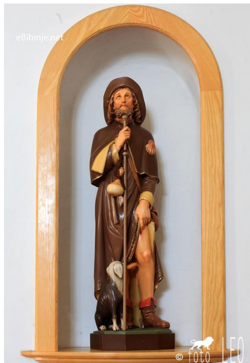
Slika 29. Kip sv. Roka