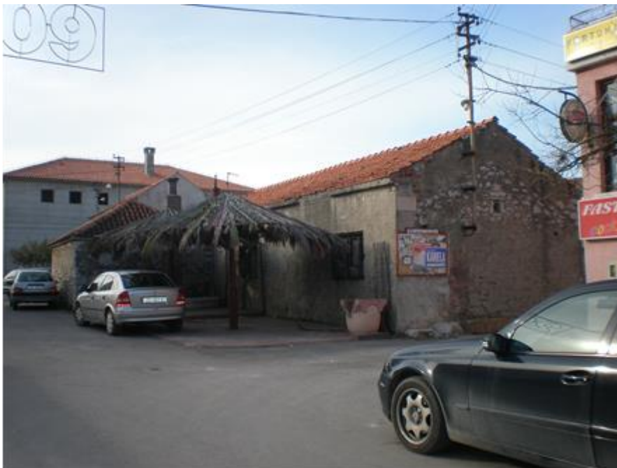
Slika 15. Sikirića mlin u Starom selu u Bibinjama

Tlocrtno je mlin izdužena građevina koja se sastoji od tri dijela . Prvi je ulazni dio s hidrauličkim sustavom, druga prostorija je prostor za "stranke" u kojoj su se ljudi družili dok se masline melju, a treća najveća prostorija služila je za mljevenje maslina i dobivanje maslinovog ulja.