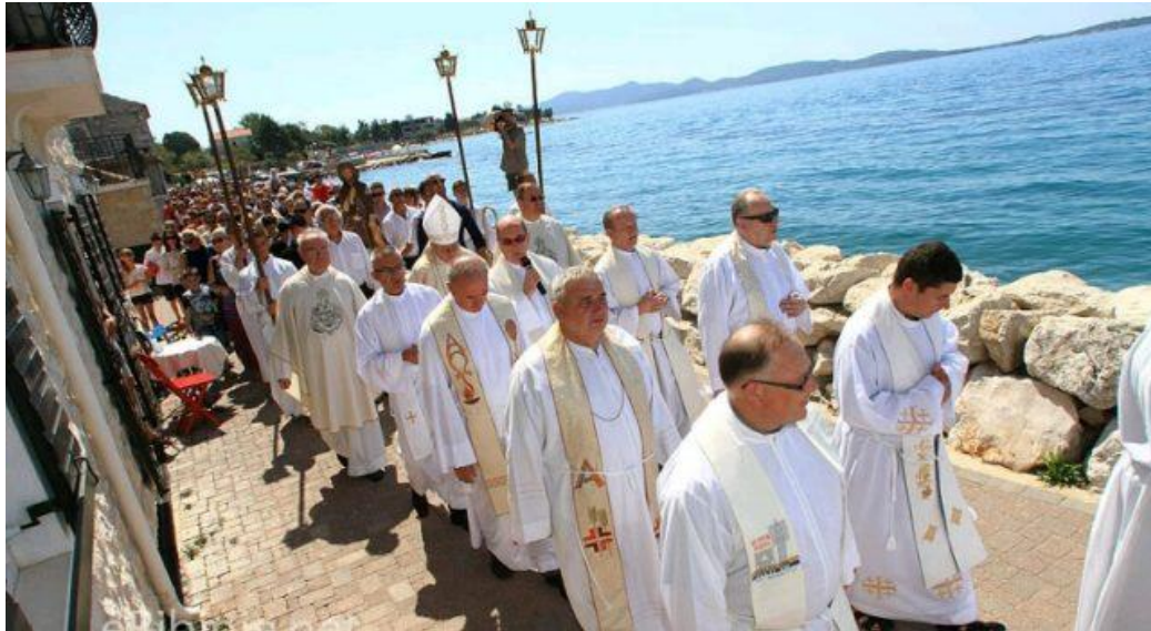
Slika 28. Procesija na blagdan sv. Roka (preuzeto sa www.kalelarga.info.hr )

Na blagdan sv. Roka, nakon glavne mise, tradicionalno kreće povorka s kipom zaštitnika u procesiju oko Staroga sela. Za vrijeme procesije, od davnina, se pjeva pjesma u čast sv. Roka. Nakon procesije ljudi idu svojim kućama i dočekuju goste koji stižu na Rokovu. Peku se janjci za svečani ručak, a djeca hrle na šuškarije . Šuškarije su štandovi s igračkama koji dolaze u Bibinje samo na taj dan, a to je oduvijek bilo posebno veselje za svu djecu. Navečer se u uvali Taline održava koncert i fešta se do jutra.