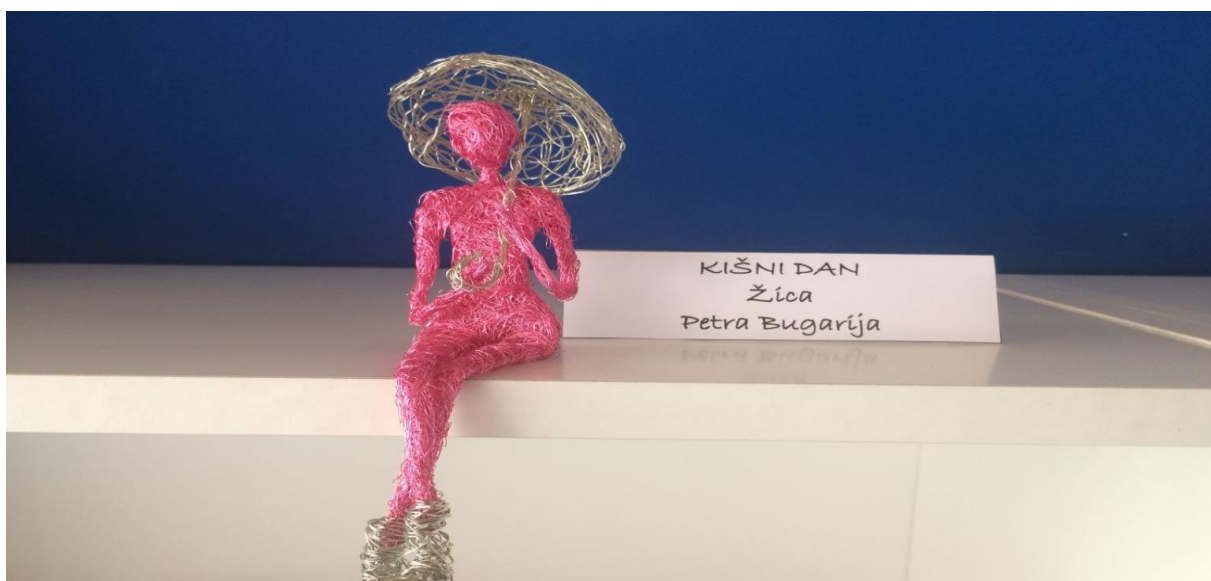
Slika 32. Detalj s izložbe „Naš kutak“