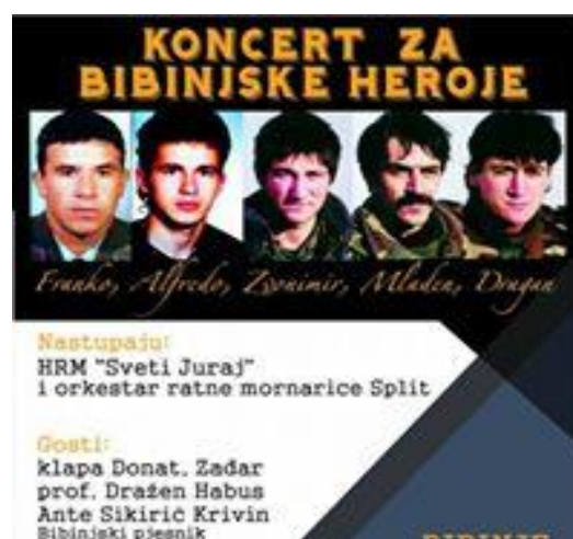
Slika 30. Plakat za koncert