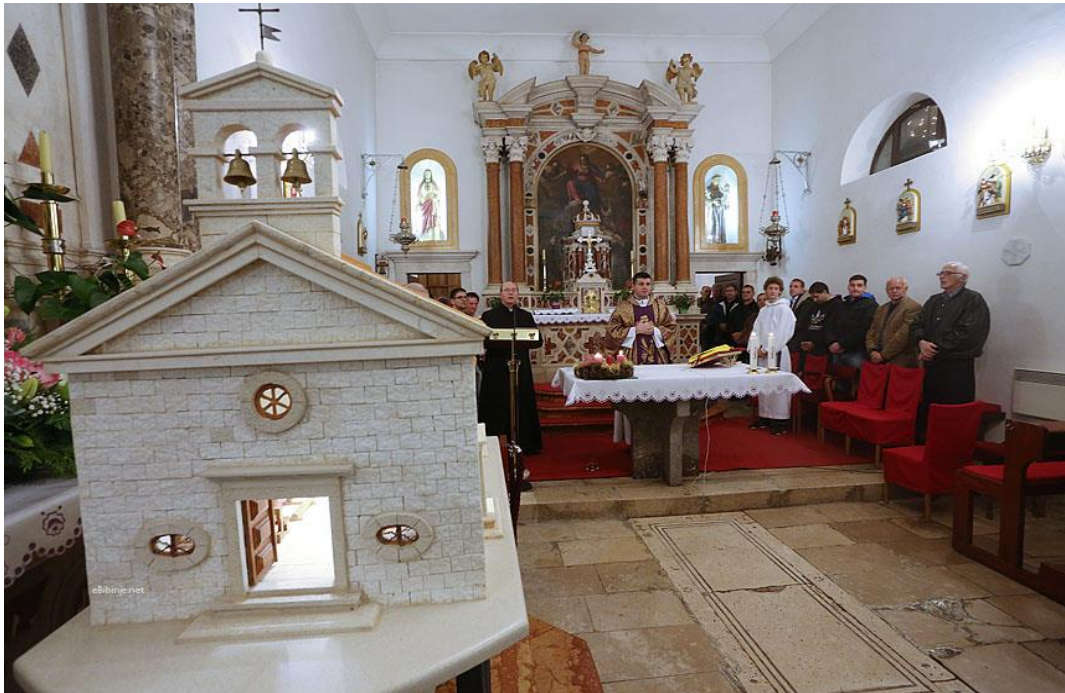
Slika 7. Detalj sa blagoslova replike crkve sv. Roka