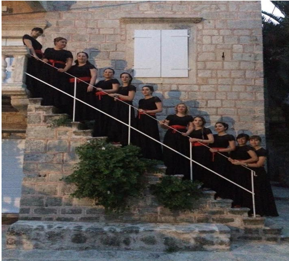
Slika 17. Klapa Garofuli

nastupale na brojnim festivalima i kulturnim događajima diljem Hrvatske i u inozemstvu. Povodom 20. obljetnice svog djelovanja, u kolovozu 2010. godine, Garofulice svojim sumještanima poklanjaju samostalni koncert na kojem kao njihov gosti nastupa klapa „Intrade“. 2015. godine za proslavu 25. rođendana opet održavaju koncert na kojem im je gost bio Krunoslav Kićo Slabinac. Također, već tradicionalno, u kolovozu svake godine klapa „Garofuli“ održava manji intimni koncert na Trgu sv. Ivana u Starom selu.