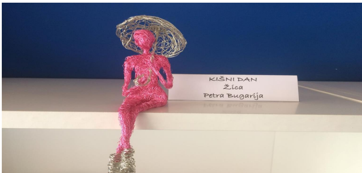
Slika 32. Detalj s izložbe „Naš kutak“