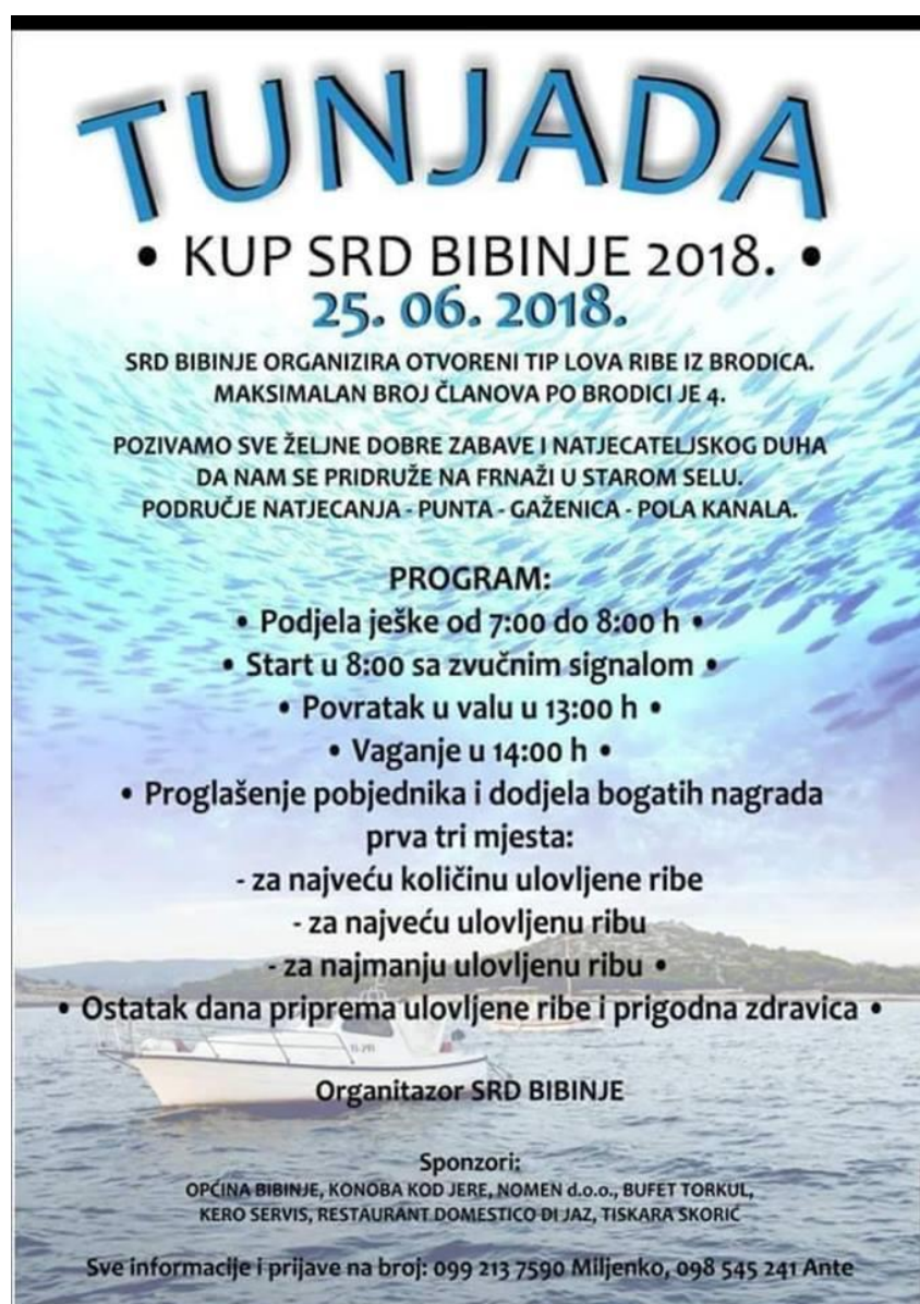
Slika 24. Plakat za Tunjadu 2018

Također su uoči Badnjaka 2018. organizirali natjecanje pod nazivom Lignjada 2018.