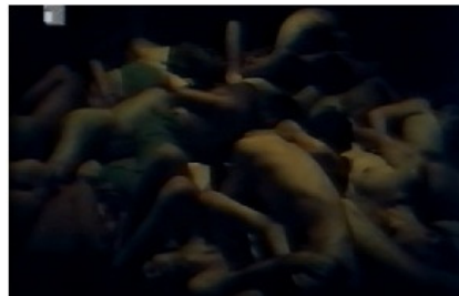
Slika 2: prizor iz filma, www.youtube.com

Branko Ivanda, uz Antu Peterlića, nakon prvotnog stažiranja drugim redateljima (Galić, Vrdoljak, Papić, Babaja) započinje vlastitu redateljsku karijeru modernistički intoniranim