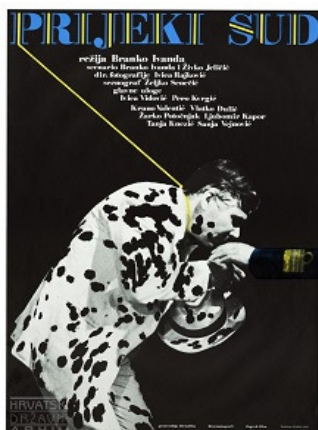
Slika 6: Filmski plakat za Priječki sud (autor: Boris Bućan, www.arhiv.hr )

Pretapanje je uočljivo i u filmskim izražajnim sredstvima kao i u verbalnim izrazima. Plakat filma Priječki sud utemeljen je na vizualnom pretapanju oblika i osobina čovjeka i psa. Na crnoj se podlozi nalazi centralno smješten lik odjeven u bijelo odijelo oslikano crnim točkama koji, u položaju blagog naklona, ljubi ruku nepoznatog pojedinca. Sudeći po obilježju rukava ljubljene ruke, vlasniku ruke bi se lako pripisala uloga autoriteta, državnoga tijela, odnosno autoritarnog predstavnika prijekoga suda. Osim toga, i sam čin naklona i poljupca čin je poniznosti spram onoga čija se ruka ljubi. Ta se „poniznost“ dodatno osigurava vizualno upečatljivom žutom uzicom 20 koja se nalazi oko vrata čovjeka u odijelu, a koja se proteže od samoga naslova plakata. Ta uzica kao da proizlazi iz usko odškrnutih vrata te, bez obzira na tamu crnila, pronalazi svoje odredište, čovjekov vrat. Autoritativna, stabilna, koso postavljena uzica oko vrata, čovjekov položaj tijela, a ponajviše izgled (točkaste) odjeće u promatračevu umu kreiraju sliku psa dalmatinca koji poslušno ljubi gospodarevu ruku. 21 Tim se likovnim sadržajem uspostavlja vizualna analogija čovjeka (lika iz filma i romana, koji je regionalno obilježen kao Dalmatinac) i pasmine psa s kojom taj regionalni etnonim dijeli ime. Uz