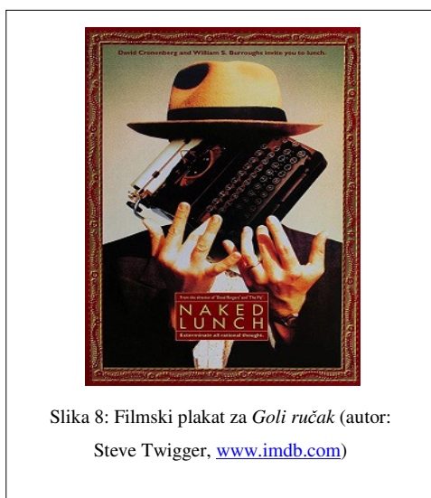
Slika 8: Filmski plakat za Goli ručak (autor: Steve Twigger, www.imdb.com )