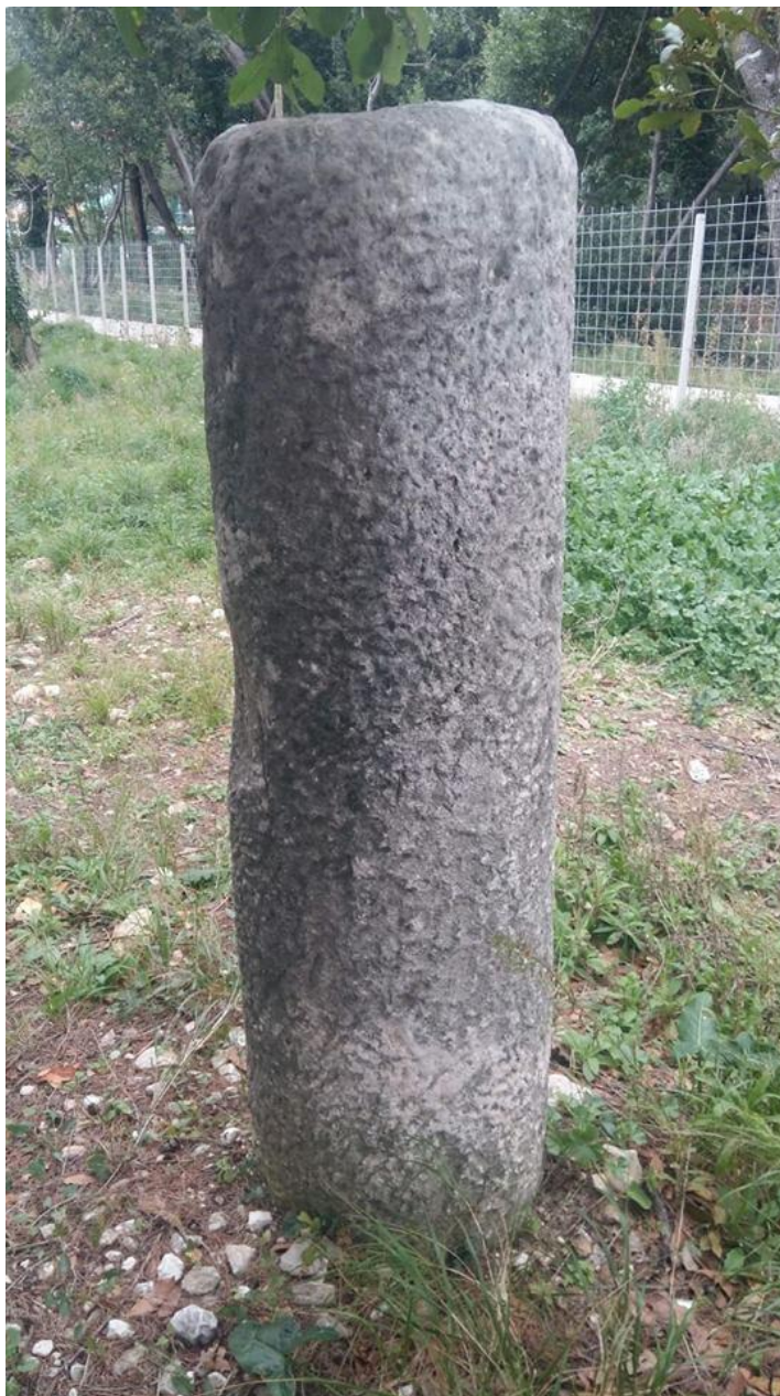
Slika 1. Stup u Podmorju/Dilatu (fotografirano: 27. 12. 2017.)