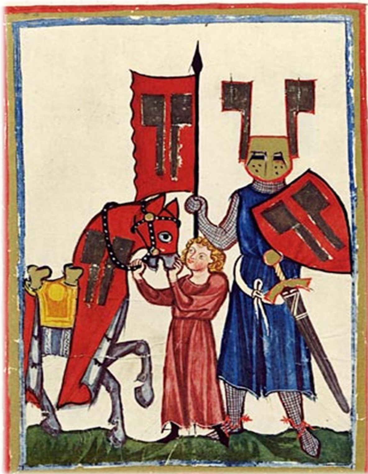
Slika br. 4. "Parzival", (oko 1210.) Wolframa von Eschenbacha