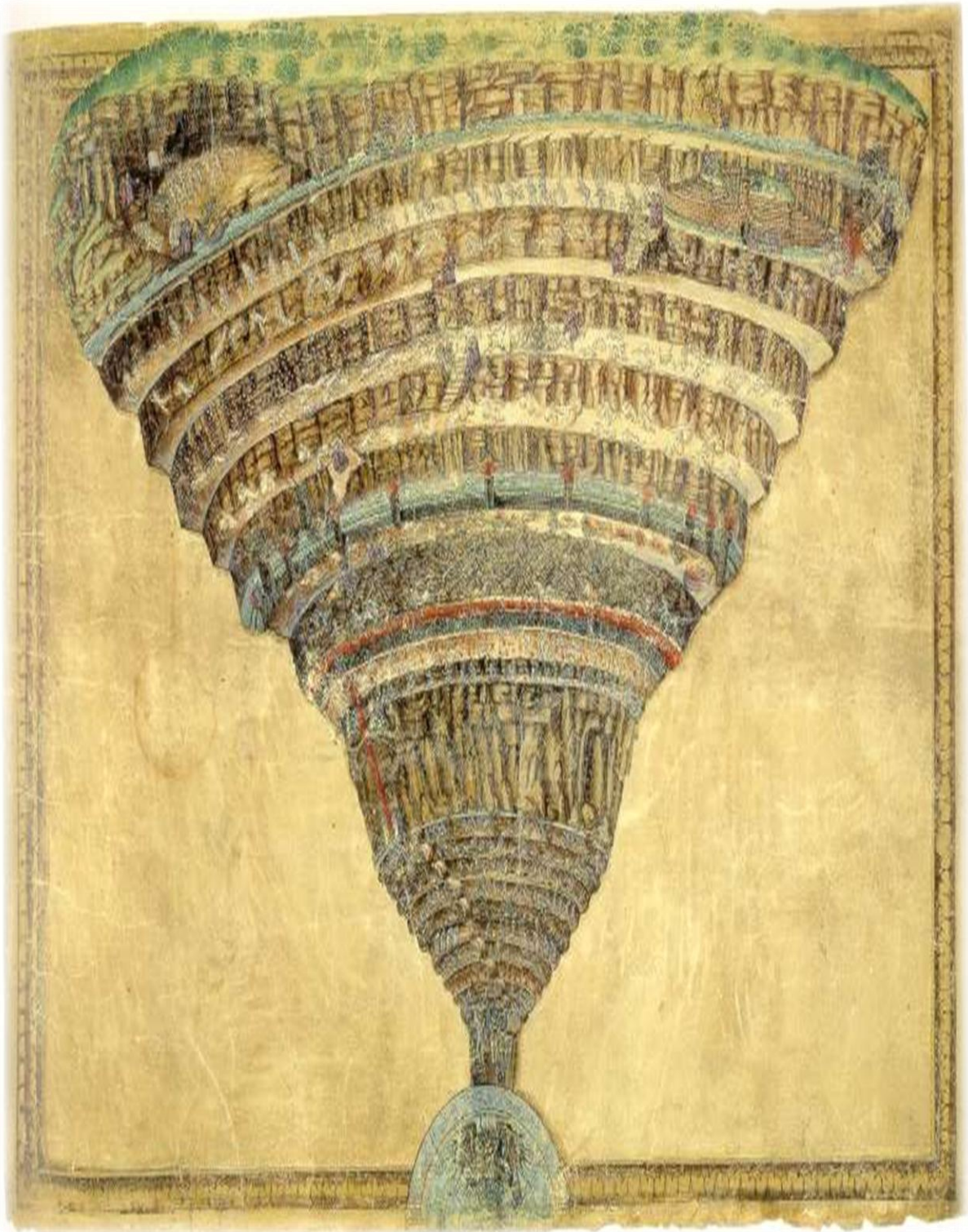
Slika br. 2. Botticellijev prikaz Dantevog "Pakla" (1490.)