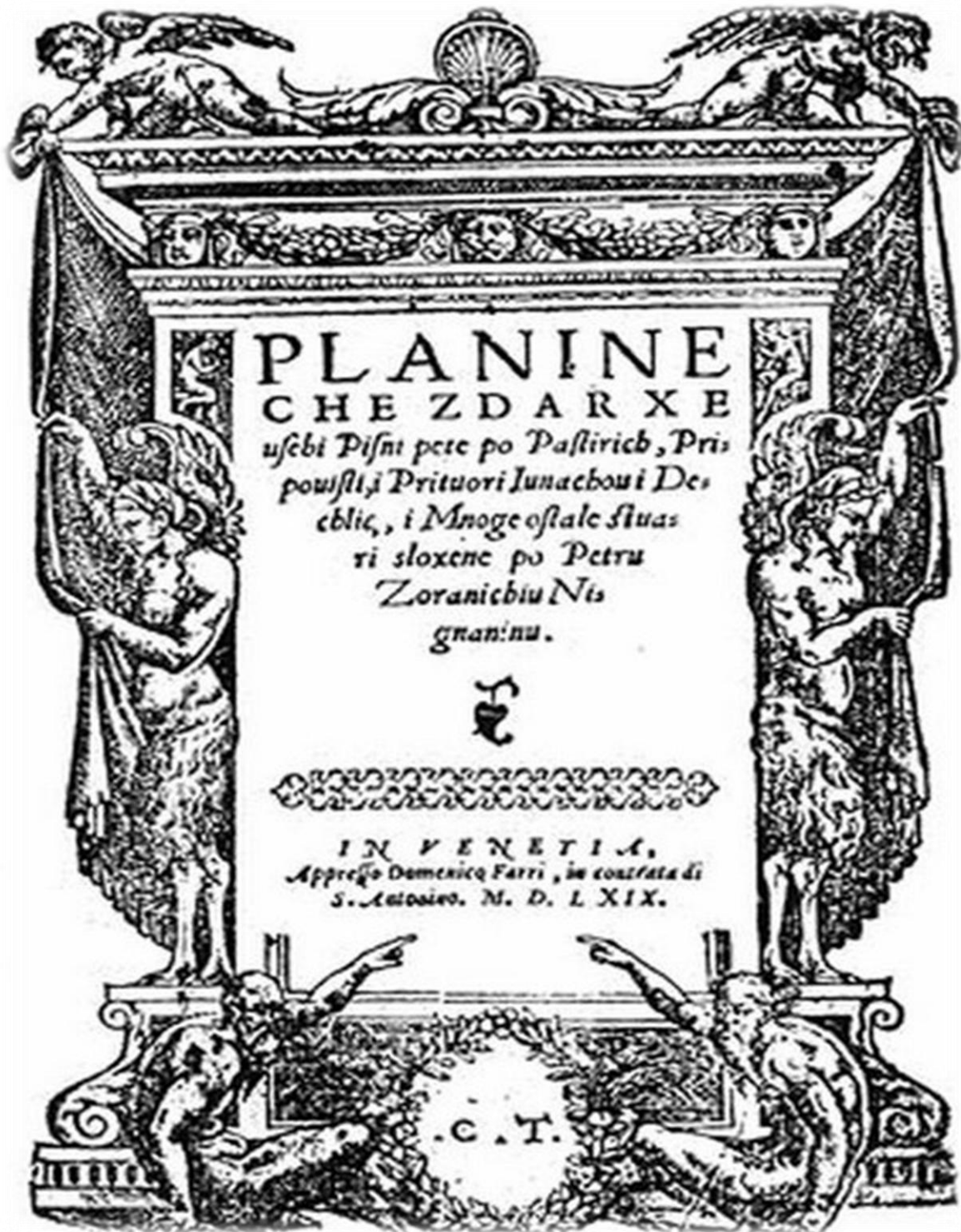
Slika br. 1: Naslovna strana prvog izdanja romana iz 1569. g.