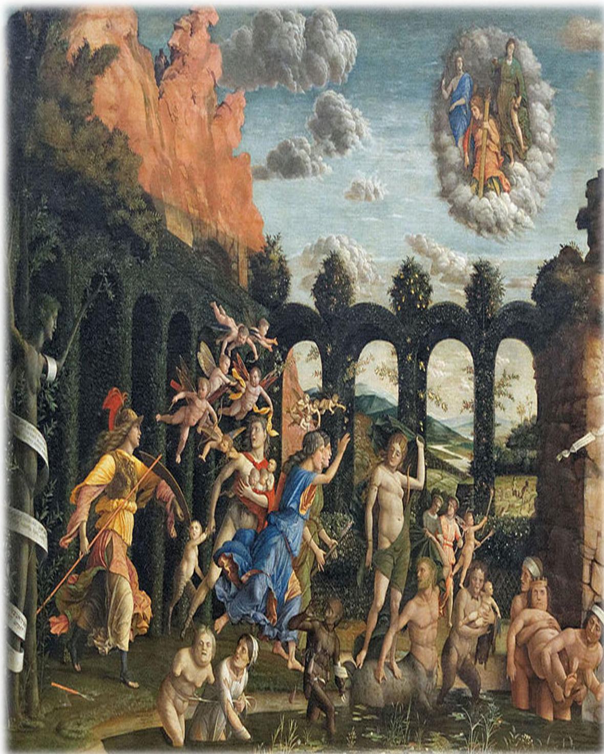
Slika br. 5. Andrea Mantegna "Pobjeda vrline nad porokom", 1502., ulje na platnu, 160 x 192 cm, Louvre, Paris.