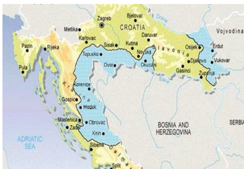
Slika 2. Teritorijalni obuhvat SAO Krajine

po naputcima predsjednika RH dr. Franje Tuđmana 6 . Ove odluke pokazale su se kao iznimno dobar potez, prvenstveno zbog činjenice da se u dva dana, 4. i 5. svibnja, upisalo 3820 osoba starosti od 18 do 60 godina. Zadaća ovog odreda ogleda se u vršenju osiguranja kroz seoske straže u narednim mjesecima, a razvoj negativnih događaja na pobunjenim područjima Hrvatske rezultirao je da će ovaj odred 2. srpnja 1991. postati prva naoružana vojna postrojba, imena bataljun „Klek“ Zbora narodne garde. Bataljunu „Klek“ u to je vrijeme pristupilo 109 pripadnika, a bili su naoružani lakim naoružanjem, prvenstveno puškama M-48. Tako će ovaj odred, još uz odrede Narodne zaštite, te pripadnike MUP-a dočekati prvu agresiju na općinu.