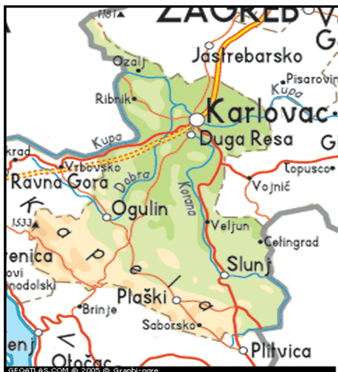
Slika 3. Geografski smještaj Saborskog

Naime, toga dana mjesto je prestalo postojati, te je time doživjelo tužnu sudbinu Vukovara i Škabrnje. Napad je zamišljen da krene 8. studenog, a radi loših vremenskih uvjeta (nemogućnost korištenja artiljerije i zrakoplovstva) odgođen je na 12. studeni 1991. godine. U njemu je sudjelovalo, što se neprijateljske nadmoćnije strane tiče, otprilike 700 pripadnika JNA, 1. bataljun br TO Plaški, jedinice 5. Partizanske brigade s Plitvica s oklopnim transporterima i tenkovima, TO Titova Korenica, četa vojne policije, četa policije iz PS Plaški, Jedinica za posebne namjene, dragovoljci iz Srbije, te odjeljenje službe državne sigurnosti. Sveukupno, dakle, oko 1500 vojnika, 18 tenkova, 6 oklopnih transportera, 3 MIG-a i nekoliko helikoptera. 8 Hrvatske snage raspolagale su sa cca 200 ljudi, 4 neispravna minobacača, 3 topa bez optičkih naprava, nekoliko mitraljeza, te pješačkim naoružanjem. Branitelji su pružali otpor koliko su mogli, a oko 20 sati u mjesto su ušli tenkovi agresorske vojske i od tog trenutka pa sve do 5.8.1995. godine Saborsko se nalazilo pod okupacijom. Za vrijeme okupacije porušeno je i zapaljeno 350 kuća, 51 osoba je smrtno stradala, a ostali su prognani.