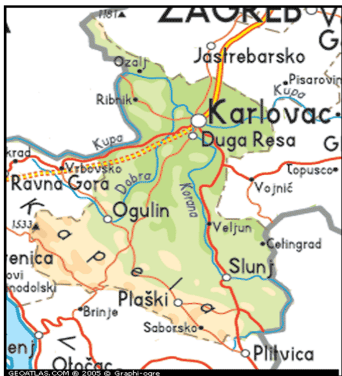
Slika 3. Geografski smještaj Saborskog

Naime, toga dana mjesto je prestalo postojati, te je time doživjelo tužnu sudbinu Vukovara i Škabrnje. Napad je zamišljen da krene 8. studenog, a radi loših vremenskih uvjeta (nemogućnost korištenja artiljerije i zrakoplovstva) odgođen je na 12. studeni 1991. godine. U njemu je sudjelovalo, što se neprijateljske nadmoćnije strane tiče, otprilike 700 pripadnika JNA, 1. bataljun br TO Plaški, jedinice 5. Partizanske brigade s Plitvica s oklopnim transporterima i tenkovima, TO Titova Korenica, četa vojne policije, četa policije iz PS Plaški, Jedinica za posebne namjene, dragovoljci iz Srbije, te odjeljenje službe državne sigurnosti. Sveukupno, dakle, oko 1500 vojnika, 18 tenkova, 6 oklopnih transportera, 3 MIG-a i nekoliko helikoptera. 8 Hrvatske snage raspolagale su sa cca 200 ljudi, 4 neispravna minobacača, 3 topa bez optičkih naprava, nekoliko mitraljeza, te pješačkim naoružanjem. Branitelji su pružali otpor koliko su mogli, a oko 20 sati u mjesto su ušli tenkovi agresorske vojske i od tog trenutka pa sve do 5.8.1995. godine Saborsko se nalazilo pod okupacijom. Za vrijeme okupacije porušeno je i zapaljeno 350 kuća, 51 osoba je smrtno stradala, a ostali su prognani.