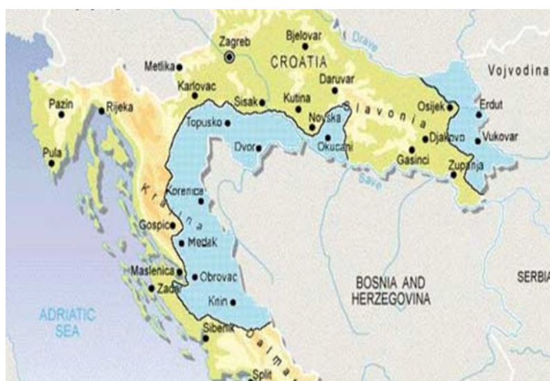
Slika 2. Teritorijalni obuhvat SAO Krajine

po naputcima predsjednika RH dr. Franje Tuđmana 6 . Ove odluke pokazale su se kao iznimno dobar potez, prvenstveno zbog činjenice da se u dva dana, 4. i 5. svibnja, upisalo 3820 osoba starosti od 18 do 60 godina. Zadaća ovog odreda ogleda se u vršenju osiguranja kroz seoske straže u narednim mjesecima, a razvoj negativnih događaja na pobunjenim područjima Hrvatske rezultirao je da će ovaj odred 2. srpnja 1991. postati prva naoružana vojna postrojba, imena bataljun „Klek“ Zbora narodne garde. Bataljunu „Klek“ u to je vrijeme pristupilo 109 pripadnika, a bili su naoružani lakim naoružanjem, prvenstveno puškama M-48. Tako će ovaj odred, još uz odrede Narodne zaštite, te pripadnike MUP-a dočekati prvu agresiju na općinu.