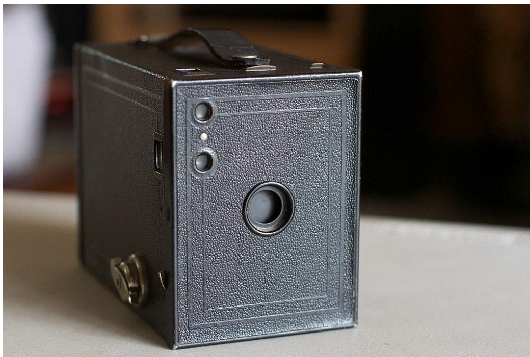
Slika 4. Kodak Brownie