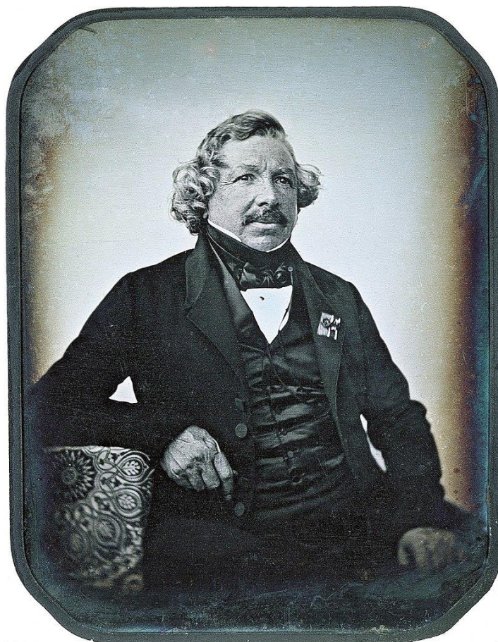
Slika 3. Dagerotipija Louisa Daguerra