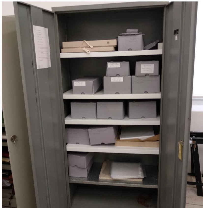
Slika 6. Ormar za pohranu fotografija, Zadarski arhiv

Najčešće se koriste čelični ormari zaštićeni zapečenim lakom ili oni od kromiranog čelika. 48 Svakako se trebaju izbjegavati ormari izrađeni od drva, eloksiranog, pocinčanog ili lakiranog metala radi oslobađanja štetnih lignina, otapala odnosno metalnih iona.