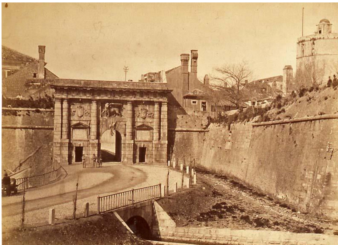
Slika 5. Zadar, Kopnena vrata, 1875.