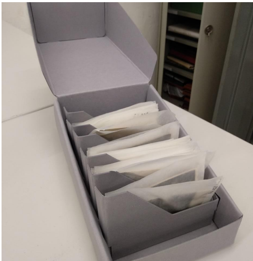
Slika 7. Fotografije spremljene u posebnim kutijama i vrećicama, Zadarski arhiv

Prilikom njihova vađenja iz vrećica potrebno je koristiti rukavice kako se slike ne bi oštetilo (znoj, prljavština...). Vrećice izrađene od polivinilklorida (PVC) strogo su zabranjene. 51