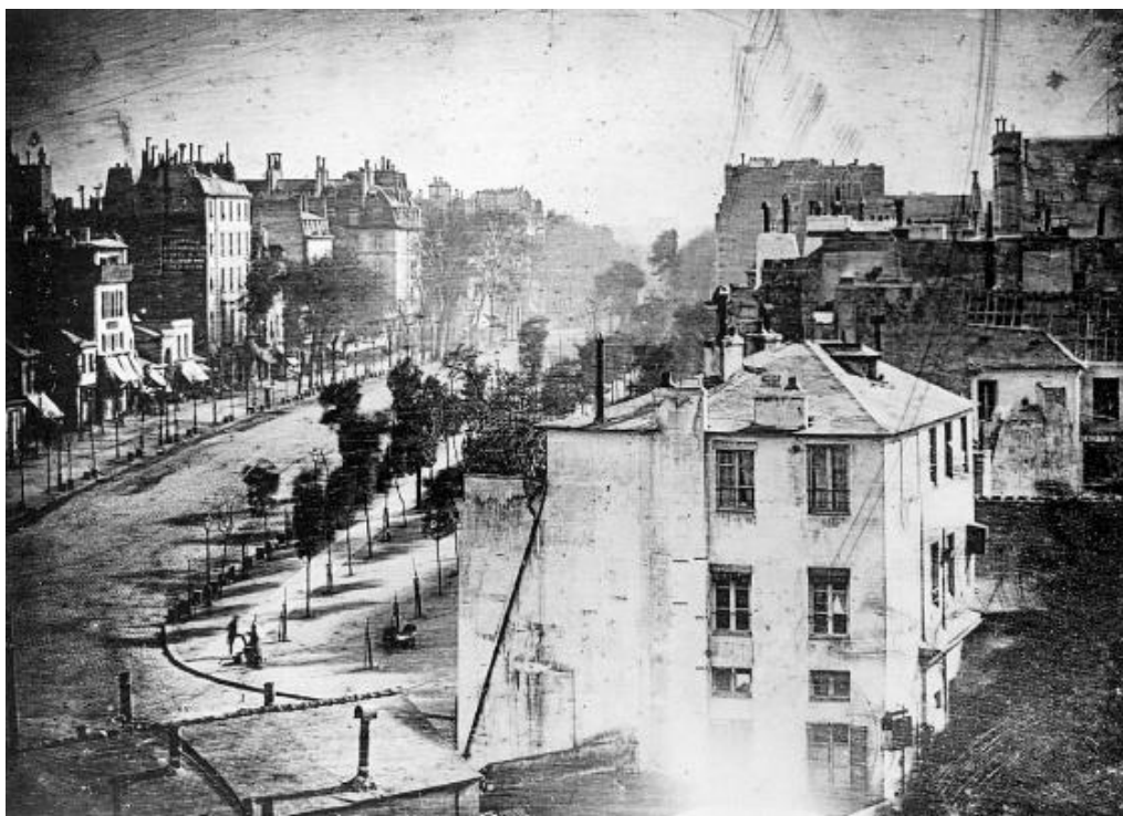
Slika 2. Boulevard du Temple

Taj postupak najranije izrade trajne fotografije je nazvan po svom izumitelju, dagerotipija . Jedna od glavnih mana ove fotografske tehnike je bila to što kod nje nije postojala mogućnost umnožavanja i kopiranja (svaka je slika bila unikatna, jedna jedina). Istovremeno dolazi do izuma drugog fotografskog postupka zvanog kalotipija (izumitelj William Fox Talbot). Ono što je kalotipiju razlikovalo od dagerotipije je bila mogućnost izrade više fotografija iz negativa. 6 Nju smatramo pretečom modernog fotografskog filma. Kalotipiju koristi George Eastman koji proizvodi prvi fotografski film, čime se otvara cijelo tržište komercijalno dostupnih fotoaparata. Njegova kompanija je tako 1900. godine izbacila na tržište prvi fotoaparat dostupan širokoj populaciji – Kodak Brownie . 7 Vrlo brzo (1907.) se pojavljuje i prvi komercijalni fotografski film u boji naziva Autochrome Lumiere (braća Lumiere).