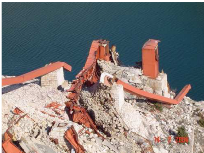
Slika 6 Srušeni Maslenički most 21. studenog 1991. ( URL 8 )

„Maslenica“ gdje je odnio pobjedu nad tenkovima JNA, to je ujedno i dokaz zašto je dobio nadimak „čovjek oklopnjak“. 14