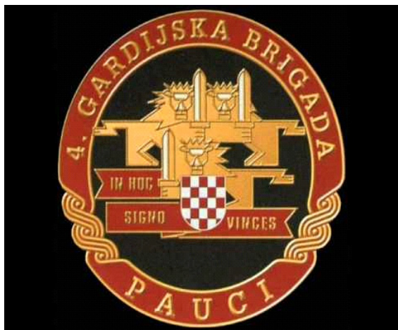
Slika 4 Grb 4. gardijske brigade ( URL 4 )

Zadar, "Kruševo", "Zelene Table – Male Bare", "Šibenik", Vrljika, "Drniš", Ston, "Dubrovnik", Ljeto, "Maslenica", Maestral, "Oluja", "Južni Potez"... Gradovi su to te akcije tijekom kojih su Pauci oslobađali svoju zemlju okupiranu od strane srbo – četničkih agresora. 8