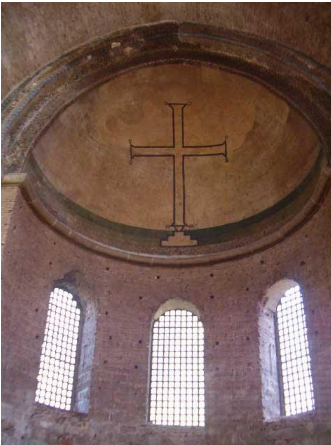
Slika 1 Mozaik u apsidi Hagia Irene, Carigrad, 8. stoljeće