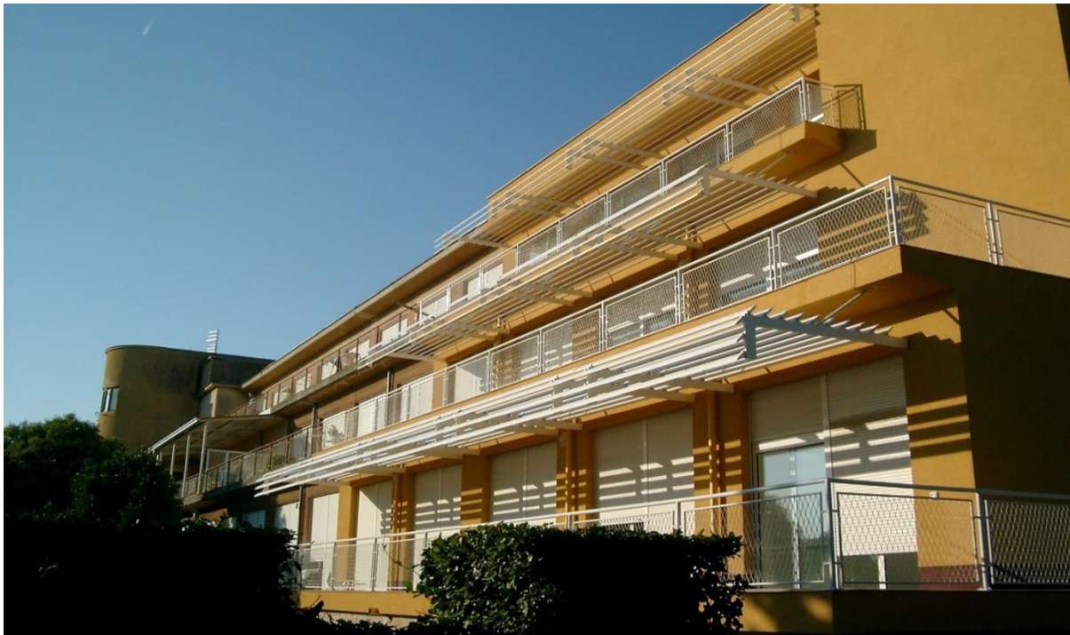
Slika 6. Specijalna bolnica za ortopediju Biograd na moru

"Današnji naziv Specijalna bolnica za ortopediju potječe iz 1994. godine." 7 Danas strukturu bolnice čine 3 odjela, a koji pružaju usluge iz djelatnosti ortopedije, te fizikalne medicine i rehabilitacije. 8 Također, Projekt Zdravstveno-turistički centar Biograd na Moru od strateške je važnosti za bolnicu i njezina osnivača. Bolnica planira uvesti pružanje usluga fizikalne terapije za turiste, a kako bi se stvorili uvjeti za bolnički smještaj i medicinski tretman iznad standarda zdravstvene zaštite." 9