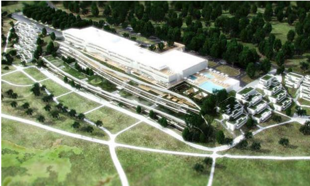
Slika 9. Vizualizacija zdravstvenog centra u Ninu.