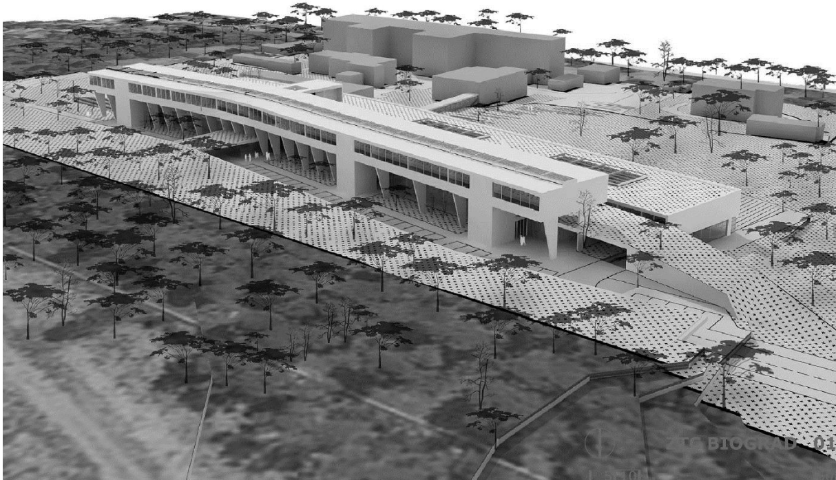
Slika 8. Prvonagrađeni rad na natječaju za Zdravstveno-turistički centar u Biogradu n/M.