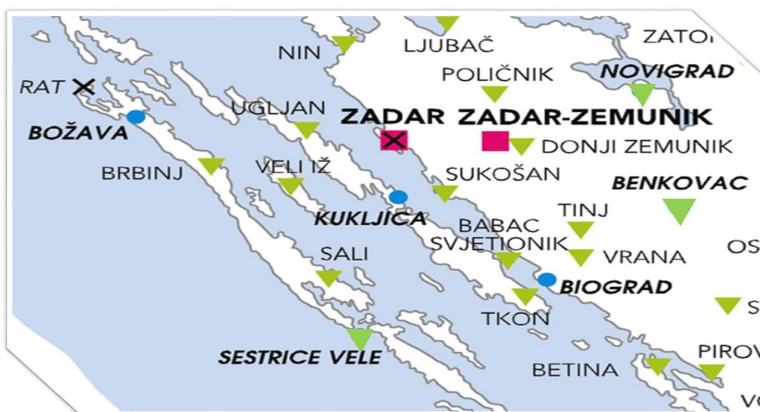
Slika 4. Meteorološke postaje Zadarske županije

U svrhu provjere naših ciljeva rada bilo je potrebno pribaviti meteorološke podatke s postaja u Zadarskoj županiji. Postaje koje smo odabrali za prikupljanje podataka jesu: Zadar-Zemunik, Zadar (grad), Biograd, Kukljica i Božava. Raspored meteoroloških podataka prikazan je na slici 4. iz dijela karte Zadarske županije. Grad Zadar, i Zadar-Zemunik označeni su ljubičastim kvadratićem, a Božava, Biograd i Kukljica plavim krugom, ostale meteorološke postaje s kojih nismo uzimali podatke označene su obrnutim zelenim trokutom.