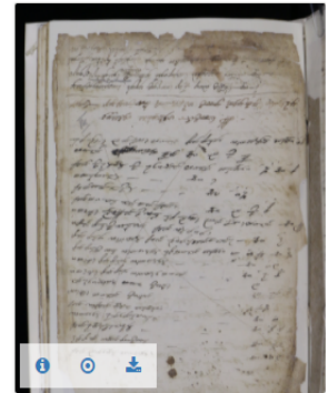
Slika 2. Kali_20.6